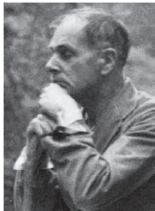
Afonso Lopes Vieira

Bastar-nos-ia abrir o vol. I para ficarmos elucidados quanto aos nomes, prestigiados e perfeitamente enquadrados num cânone da cultura finissecular portuguesa, com os quais se correspondia: Bulhão Pato, Teófilo Braga, Guerra Junqueiro, Joaquim de Araújo, Xavier da Cunha, Henrique Lopes de Mendonça, Conde de Monsaraz, Alberto Osório de Castro, Manuel da Silva Gaio, Alberto de Oliveira, Trindade Coelho, Eugénio de Castro, Júlio Brandão, Júlio Dantas, António Correia d'Oliveira, D. Tomás de Noronha, Carlos de