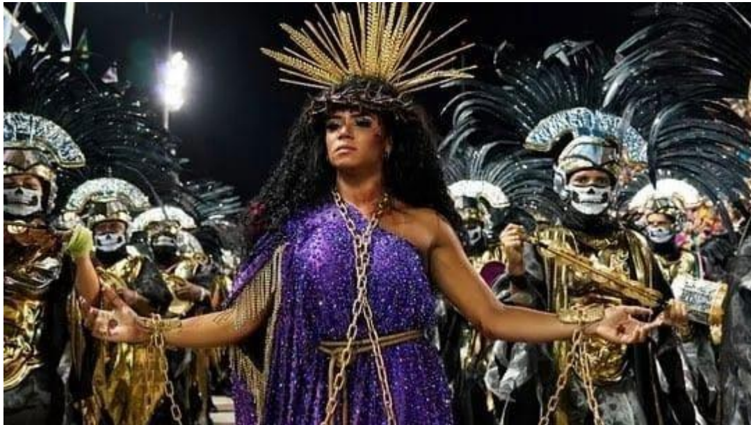
Figura 1 - Imagem do jesus mulher no desfile da escola de Samba Mangueira.

https://gazetaweb.globo.com/porta/ noticia/2020/02/_98231.php