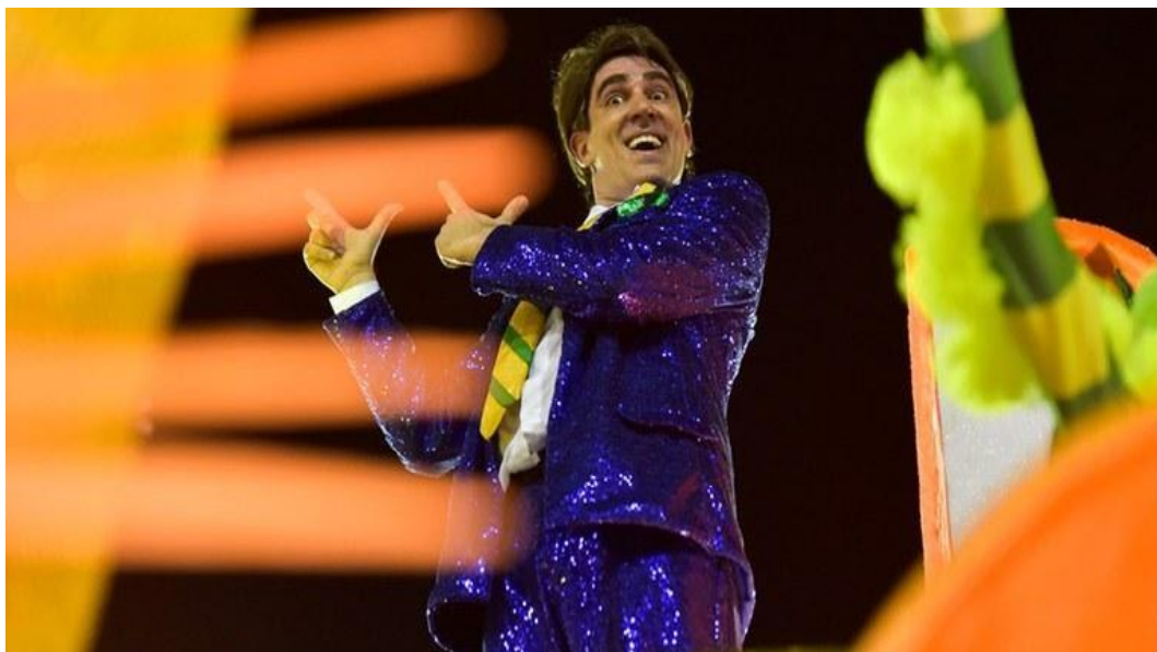
Figura 2 - Humorista Marcelo Adnet no desfile da Escola São Clemente.

Hoje, o vigário de gravata Abençoa a mamata Lobo em pele de cordeiro Trago em três dias seu amor La garantia soy yo Só trabalho com dinheiro Chamou o VAR, tá grampeado Vazou, deu sururu Tem marajá puxando férias em Bangu Balança na rede Abre a janela, aperta o coração O filtro é fantasia da beleza Na virtual roleta da desilusão Brasil, compartilhou, viralizou, nem viu E o país inteiro assim sambou Caiu na fake News.