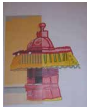
Imagem 8 – Conclusão da figura do aluno O.