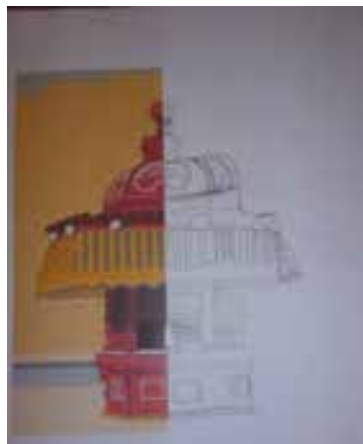
Imagem 7 – Conclusão da figura do aluno I.

Os alunos mostraram-se logo confusos com uma tarefa que seria, aparentemente bastante complexa. No entanto, foi referido que não precisariam de fazer a simetria de forma perfeita, fazendo como conseguissem. A maioria dos alunos entendeu que teriam de representar a restante figura consoante o eixo de simetria vertical, portanto em forma de espelho.