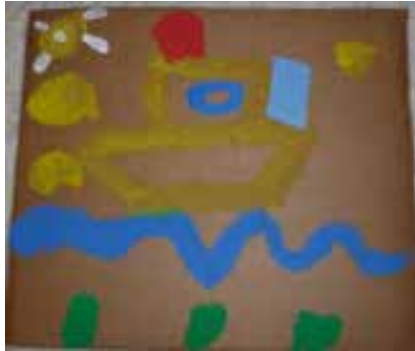
Imagem 1 – Composição visual do aluno P.