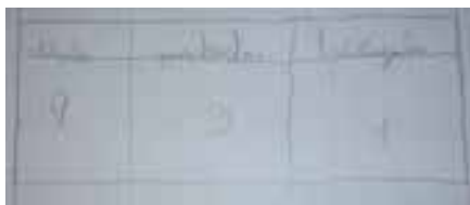
Imagem 3 – Organização das figuras geométricas do aluno B.

Momento 4 - Seleção e organização das figuras geométricas representadas nas suas próprias composições visuais: Este último momento consistiu na replicação do exercício desenvolvido no segundo momento desta sequência didática I, tendo tido como centro as produções individuais de cada aluno. Foi dada a oportunidade aos alunos de decidirem sobre o modo de apresentação, organização e tratamento de dados. Foi possível observar que a maioria dos alunos optou pela elaboração de uma tabela, um aluno construiu um gráfico de barras e outro aluno, uma sequência.