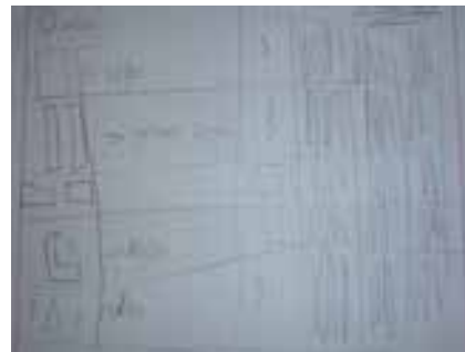
Imagem 4 – Organização das figuras geométricas do aluno S.