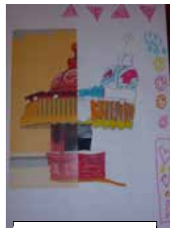
Imagem 10 – Conclusão da figura do aluno Q.