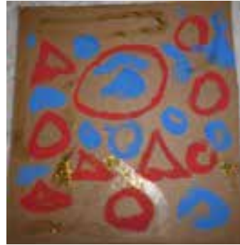
Imagem 2 – Composição visual do aluno T.

Momento 4 - Seleção e organização das figuras geométricas representadas nas suas próprias composições visuais: Este último momento consistiu na replicação do exercício desenvolvido no segundo momento desta sequência didática I, tendo tido como centro as produções individuais de cada aluno. Foi dada a oportunidade aos alunos de decidirem sobre o modo de apresentação, organização e tratamento de dados. Foi possível observar que a maioria dos alunos optou pela elaboração de uma tabela, um aluno construiu um gráfico de barras e outro aluno, uma sequência.