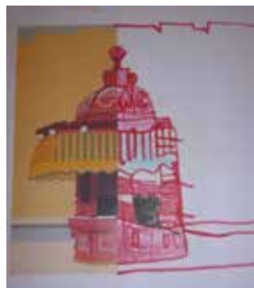
Imagem 9 – Conclusão da figura do aluno C.