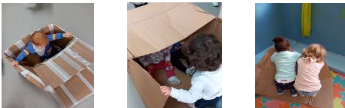
Figura 2 - Exploração livre das caixas

A outra proposta que se considerou ter marcado as crianças pela positiva, na qual se observou a felicidade das mesmas, foi a exploração livre das caixas, e para esta ser efetuada, colocaram-se diversas caixas pelo chão da sala, com o intuito de as crianças as explorarem como pretendiam, e o resultado desta experiência foi que elas entravam e saíam do interior da caixa simulando um túnel, subiam e desciam simulando um escorrega, batiam em cima da caixa produzindo som, simulando um tambor, interagiam umas com as outras através do jogo “cucu”, em que uma criança fechava a caixa com dois colegas no interior desta dizia “Não tá cá” e quando a abria e os via dizia “Tá aqui” e quando as crianças permaneciam sentadas no interior da caixa eu e/ou o meu par pedagógico rastejávamos esta pelo chão, simulando um carro (Figura 2).