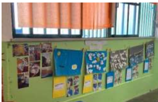
Figura 3 - Projeto "Olhar para o céu"