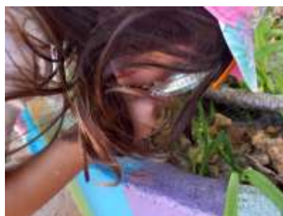
Figura 6 - Exploração do espaço exterior do Jardim de Infância II (Rede Pública)

As outras propostas que considerasse ter-se destacado durante esta prática pedagógica foi a construção da espiral do caracol utilizando botões na mesa de luz (Figura 7) e como refiro no excerto do anexo 6.