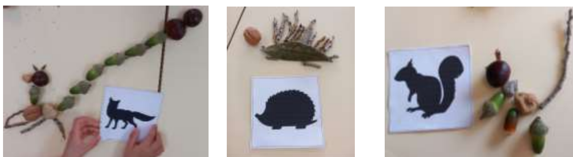
Figura 5 - Construção de silhuetas de animais do outono

Ao longo desta prática pedagógica, foi evidente o quanto as crianças aprenderam com as diversas propostas educativas, tanto eu como o meu par pedagógico dedicámo-nos a planejar e implementar propostas educativas que proporcionassem experiências ricas, significativas, permitindo que as crianças explorassem, descobrissem e aprendessem de forma ativa. No entanto, acreditou-se que algumas destas se destacaram mais, por exemplo, a construção de silhuetas de animais do outono utilizando diversos elementos da natureza, tais como, paus, folhas, bolotas, nozes e pedras (Figura 5).