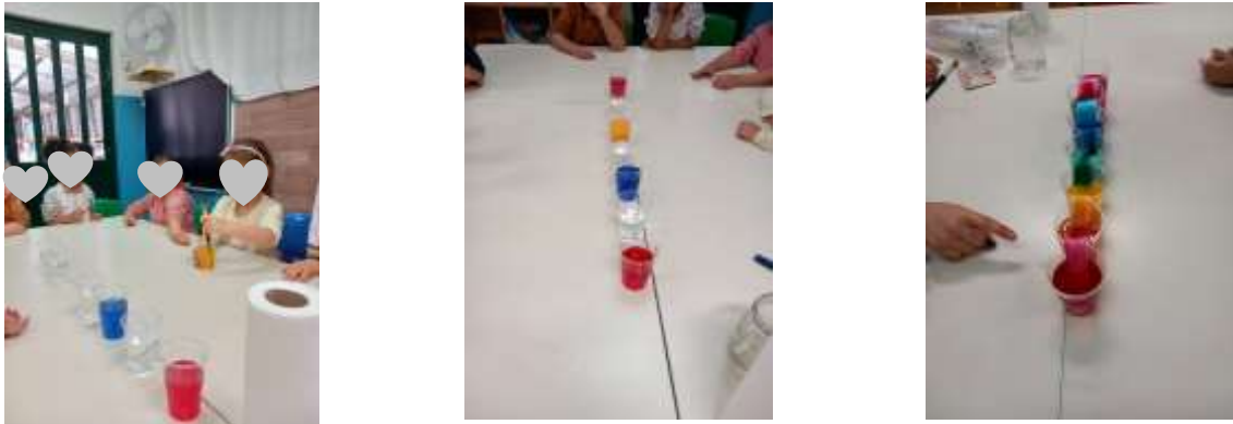
Figura 4 - Experiência do Arco-íris

ativamente envolvidas na experiência. (Excerto do anexo 4. Reflexão individual da semana 20 e 21 de maio de 2024).