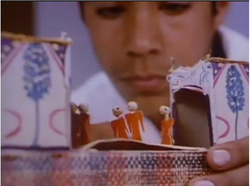
Day of the Dead 1957