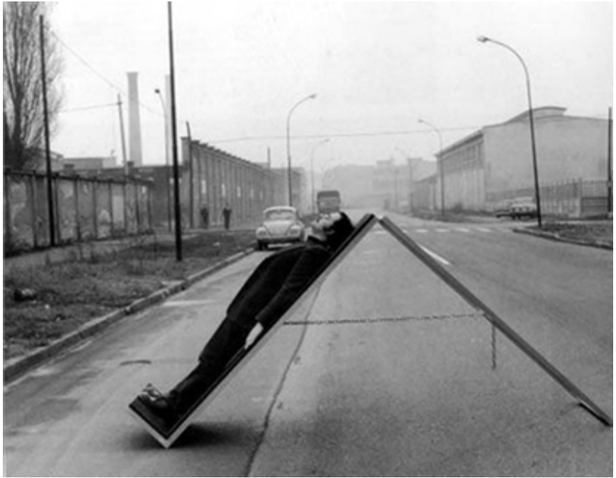
Per Oggi Basta! 1974