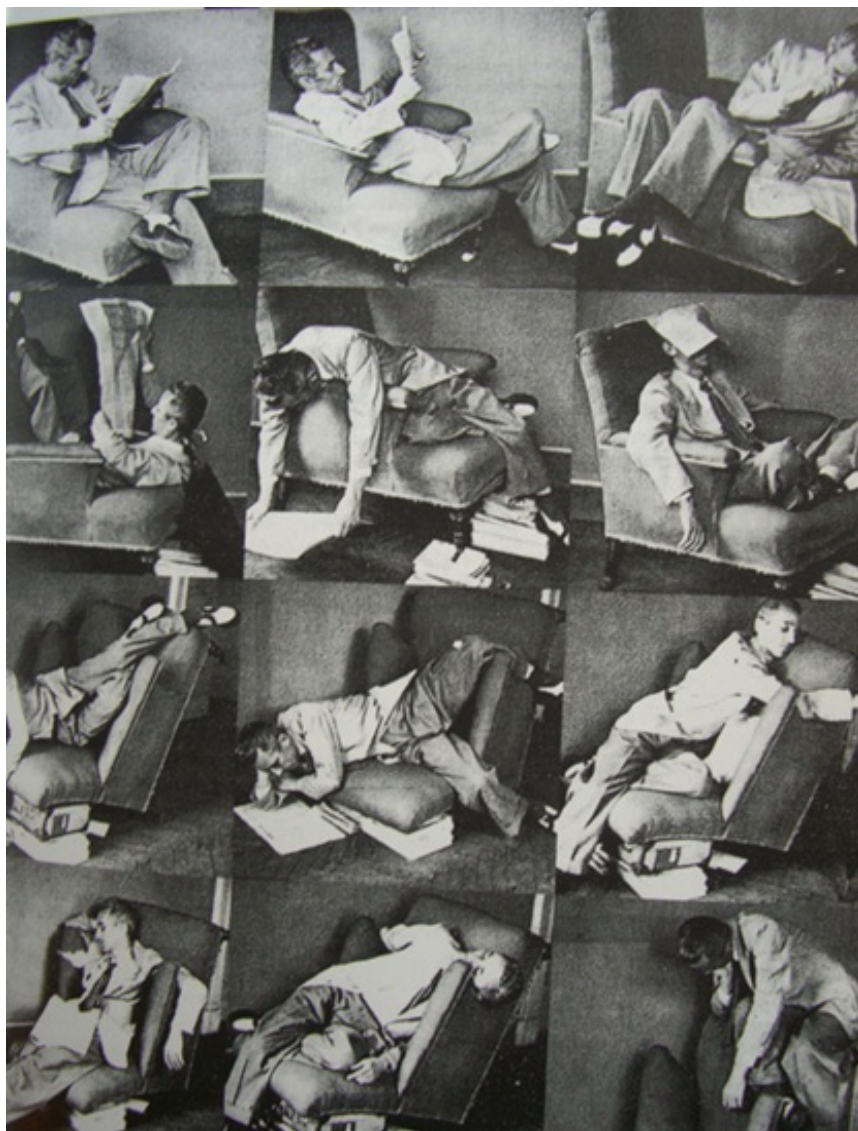
Ricerca della comodità in una poltrona scomoda 1944