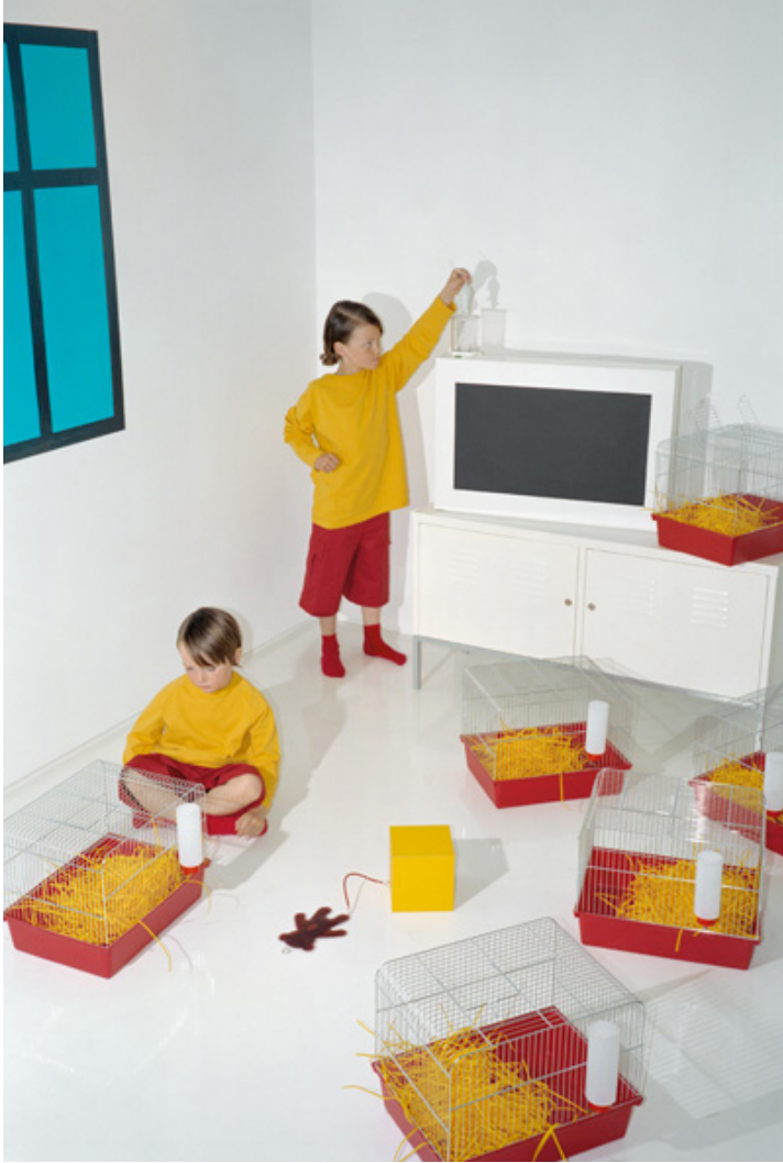
Is This Your Future? 2004