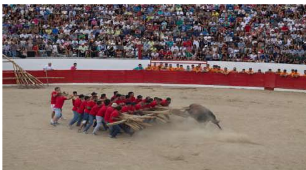
Figura 3 – Lide do touro em Aldeia da Ponte, 2015

A Capeia Arraiana, ou simplesmente Capeia é uma manifestação tauromáquica popular, exclusiva do concelho do Sabugal, única “... sui generis ...” (Cabanas, 2011, p. 107). É caracterizada pelo facto da lide do touro ser feita com recurso ao Forcão (Figura 2), um grande objeto de madeira, com forma triangular, habitualmente conduzido por um grupo de homens que o utiliza para fazer frente ao touro.