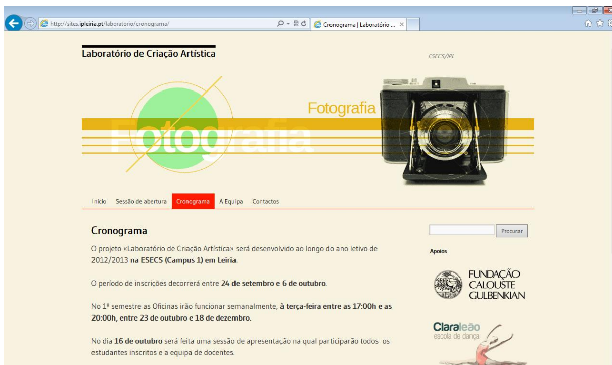
Fig. 2 – Sítio web do projeto Laboratório de Criação Artística (Centro de Recursos Multimédia da ESECS)

A divulgação do projeto foi feita também através de outros meios, nomeadamente, do Boletim Digital , a newsletter do IPLeia que tem periodicidade mensal e que faz referência às iniciativas de maior destaque no seio da comunidade académica do Instituto. Contudo, foi na ESECS que a comunicação relativa ao Projeto LCA teve maior expressão, dada a diversidade de meios utilizados. O Gabinete de Relações Públicas e Cooperação Internacional divulgou por email o projeto e a forma de fazer a inscrição, fazendo a ligação ao sítio web ; a mesma informação esteve presente no écran digital do átrio principal; foi feita divulgação junto dos novos estudantes do ano letivo 2012/2013 pelos coordenadores de curso; teve ainda destaque no sítio web do Curso de Animação Cultural – o Portal de Animação Cultural .