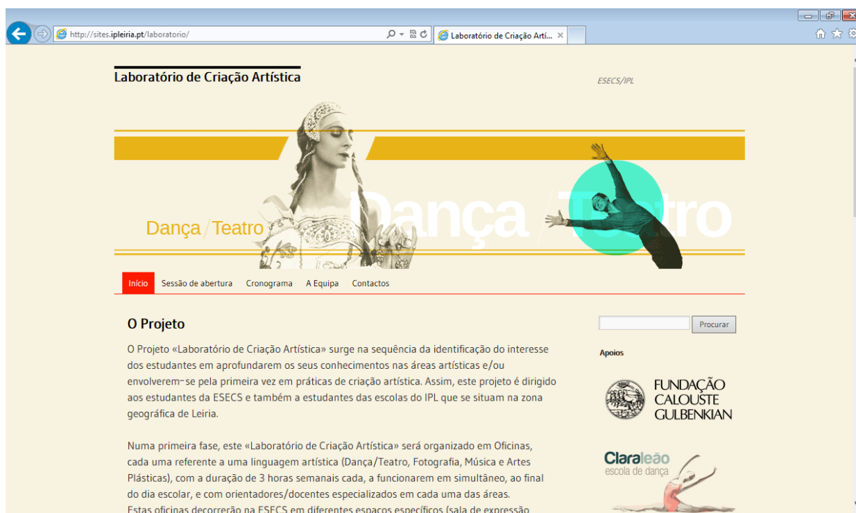
Fig. 1 – Sítio web do projeto Laboratório de Criação Artística (Centro de Recursos Multimédia da ESECS)

As oficinas de criação artística que constituíam o projeto foram a base para a criação de um código de expressão que se utilizou também noutros meios de divulgação. A criação deste sítio web e da imagem do Projeto LCA, esteve a cargo do Centro de Recursos Multimédia da ESECS. Com ligação a partir do sítio web da ESECS, esteve disponível no endereço http://sites.ipleiria.pt/laboratorio/ durante todo o ano letivo de 2012/2013 (Fig. 1 e 2).