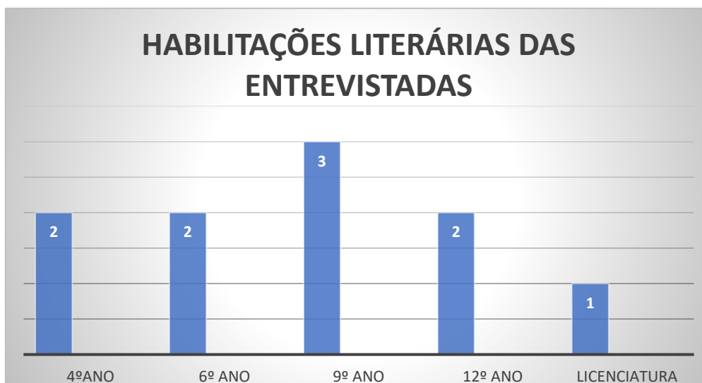
GRÁFICO 1 – HABILITAÇÕES LITRERÁRIAS DAS ENTREVISTADAS

Estamos a falar de uma população, à qual não exigida formação específica, que dispõe de um nível de formação académica muito baixo, ao contrário de outros profissionais que trabalham em meio escolar como os professores e os técnicos das diferentes equipas multidisciplinares (os mediadores, os psicólogos os terapeutas), bem como os animadores dos já referidos serviços de CAFS e AAFS.