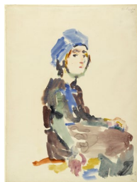
Oskar Kokoschka, 1922