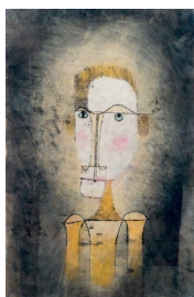
Paul Klee, Retrato de Homem Amarelo, 1921