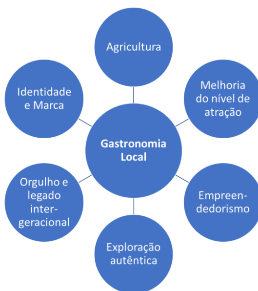
Figura 2 - A contribuição da gastronomia local para o desenvolvimento sustentável de um destino. Adaptado de du Rand et al. (2003)

Idêntico a este raciocínio, du Rand et al. (2003), apresentou uma relação entre “Gastronomia Local” e fatores que integram esse conceito, como demonstrado na figura 2, tendo como objetivo o desenvolvimento sustentável de um determinado destino. Este e os outros referidos autores demonstram reflexão convergente acerca da ligação de diferentes fatores e conceitos em torno da gastronomia local.