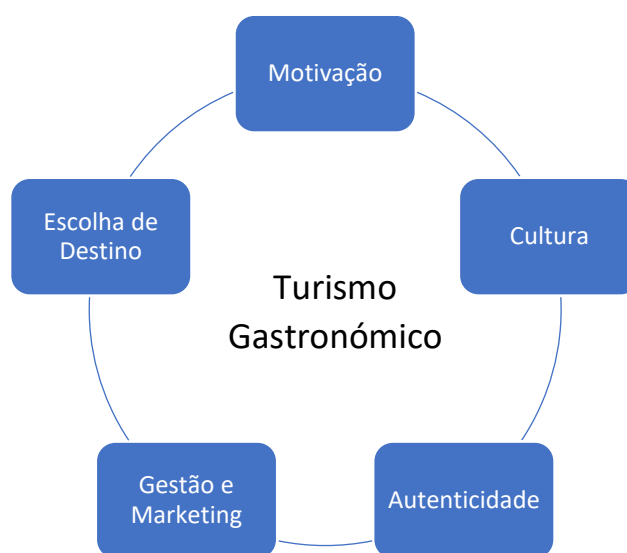
Figura 1 - Representação gráfica de fatores intrínsecos ao turismo gastronómico. Baseado em Robinson et al. (2018)

De acordo com Guiné et al. (2021), a identidade de uma sociedade, além de diversos aspetos da cultura e do património, está, em certa medida, associada à sua gastronomia. Quanto ao turismo gastronómico e às suas vertentes, Robinson et al. (2018) estabeleceu 5 pilares essenciais e circundantes, que se encontram esquematizados na figura 1. Esses pilares são fortemente referidos por vários autores em torno deste tema de discussão.