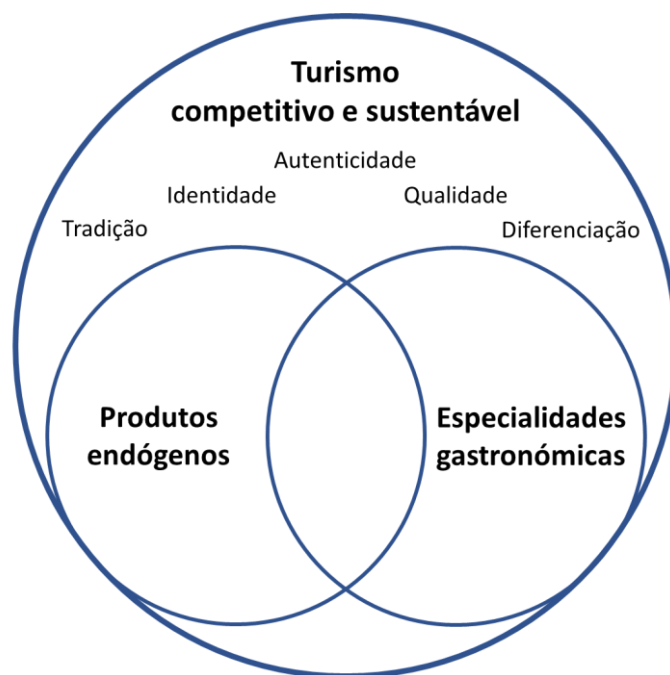
Figura 3 - Modelo de síntese.

De modo a sintetizar o estudo efetuado, esquematizamos visualmente as principais conclusões apuradas (figura 3), desenvolvidas mais adiante. Nesse sentido, seguem-se as principais conclusões inferidas, bem como as limitações do estudo, o contributo do estudo para as organizações e sugestões para futuras investigações relacionadas com a temática.