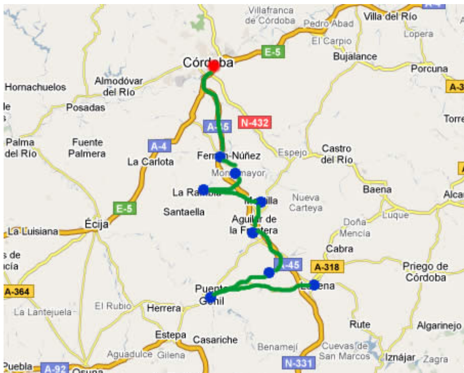
Figura 3. Ruta del Vino Montilla-Moriles