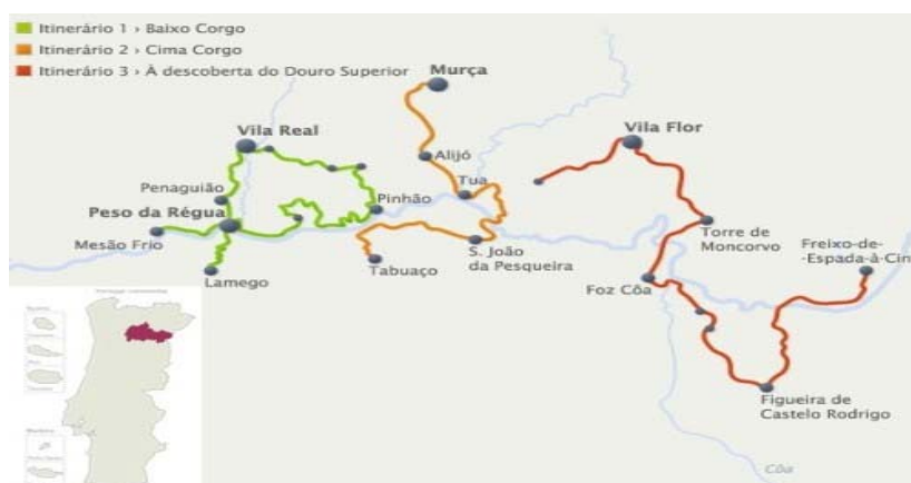
Figura 1. Itinerarios en la Ruta del Vino de Oporto

En cuanto a su diseño, la Ruta del Vino de Oporto se presenta dividida en tres itinerarios: Baixo Corgo , Cima Corgo e Douro Superior (figura 1). Cada uno de estos tres itinerarios presenta singulares propias, lo que permite al visitante contactar con diferentes aspectos de la realidad de la región, pasando por lugares de referencia como, entre otros, Peso da Régua , Vila Real , Tua , Foz Côa , Freixo-de-Espada-à-Cinta .