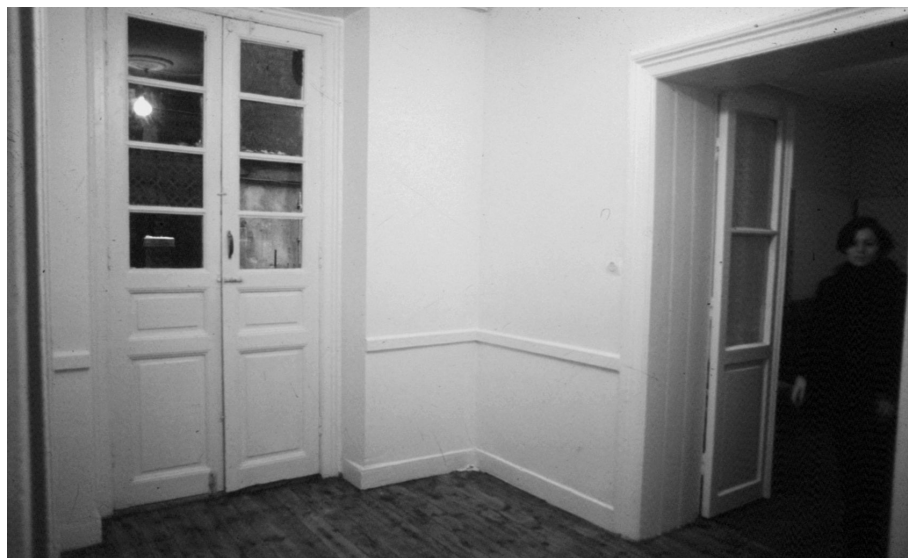
Özge Açıkkol, “About a Useless Space”, no espaço Oda Projesi, Galata, Istambul, 2000.

“A informação visual de um espaço não pode ser interpretada claramente sem a referência a informações relacionadas com a acção. E há evidências crescentes que a unidade funcional entre percepção visual e acção actua não apenas da percepção para a acção, mas também da acção para a percepção.” 9