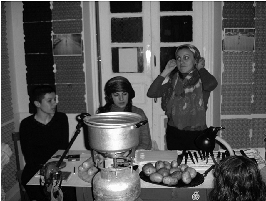
"101.7 Efem", projeto da estação de rádio em colaboração com Bookstr e THEN, no espaço Oda Projesi, Galata, Istanbul, 2005

A julgar pelo número de conceitos disponíveis (que não são de todo sinónimos mas que muitas das vezes se sobrepõem e/ou cruzam conteúdos) pode verificar-se que o problema não reside na nomeação destas práticas. No que diz respeito à aceitação das mesmas por parte do mundo da arte, a questão também não se coloca, pelo menos a julgar pelo número de publicações, eventos, conversas, seminários e exposições dedicados ao tema, produzidos na última década. 15