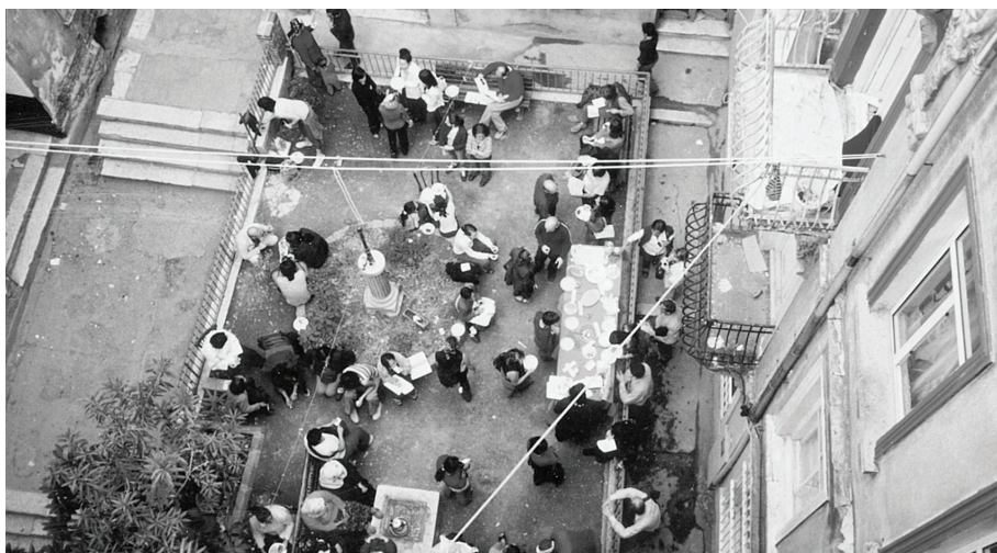
Oda Projesi em colaboração com Naz Erayda, "COURSE" (20 de Setembro, 2003), 8ª Bienal Interna- cional de Istambul, "POETIC JUSTICE". Reuniões Oda.

Em 1997, três colegas recém-licenciadas decidem alugar um espaço de ateliê na cidade onde residem. Devido às dificuldades orçamentais que marcam os primeiros anos de prática profissional, as três colegas optaram por procurar um espaço num bairro da cidade onde o nível de vida fosse mais acessível e, conseqüentemente, as rendas mais baixas. Depois da prospeção devida, alugaram um apartamento de tipologia T2 numa zona da cidade tradicionalmente habitada por migrantes internos provenientes dos territórios mais a leste da Turquia, e.g., zona que corresponde aos territórios curdos. Apesar de o bairro Galata se encontrar localizado junto a uma das artérias mais movimentadas da cidade, este ficou à margem da valorização das zonas centrais, mantendo o seu perfil essencialmente residencial e um comércio predominantemente tradicional. Visto procurarem essencialmente um espaço disponível para desenvolverem a sua prática artística, Özge Açikkol, Günes Savas e Seçil Yerse decidiram fixar aqui o seu local de trabalho, alugando um apartamento que dispusesse de uma divisão para cada uma delas.