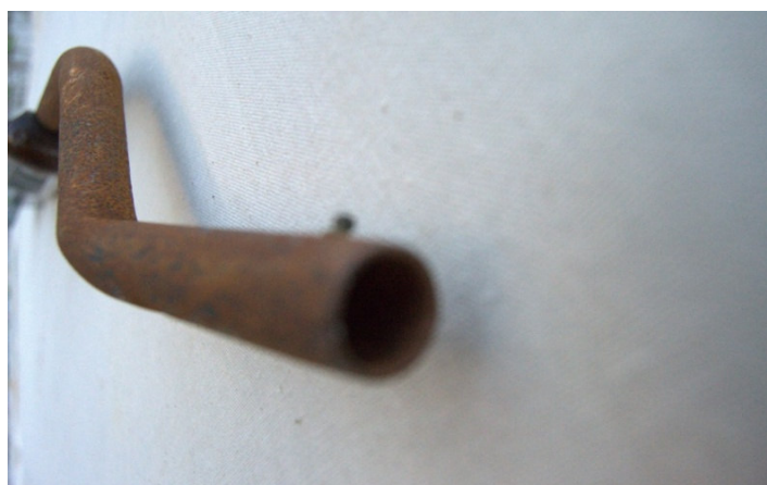
Figura 4. Acto #10, 2022

Eu estimo essa qualidade em toda a minha prática.