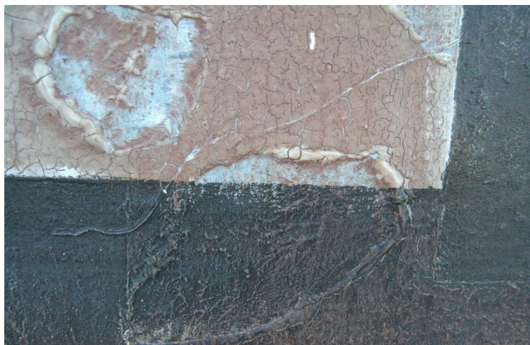
Figura 12. (pormenor) Chão #7 , 2021

Por conseguinte, a experiência que ocorre aquando da visita dos espaços em degradação e/ou baldios é muito produtiva e é inevitável o seu grande peso para a minha prática de atelier. São ocorrências muito frutíferas, sendo impactantes não só a nível material, mas também conceptual, como já referi. O meu comportamento durante estes encontros resulta em reações que, por sua vez, são alvo de reflexão que, a seguir, são pontualmente transportadas ou traduzidas para as minhas pinturas. Para exemplificar esta influência pictórica, recorro à pintura intitulada Chão #7 . Uma das características que prendem a minha atenção são as suas cores, estas demonstram um grau de dessaturação que tem ocorrido de forma gradual. Este fenómeno é típico em ambientes e objetos em degradação. Este fenómeno ocorre devido ao processo de degradação do sangue e pela ação dos raios ultravioleta que, por sua vez, afeta a qualidade e o timbre da cor. Assim sendo, esta pintura não foi finalizada por meio da minha intervenção, esta prosseguiu a ajustar a sua expressividade conforme os seus elementos. Pictóricamente, está representada uma tela