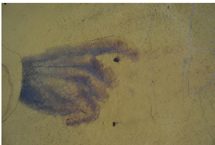
Figura 13. (pormenor)Acto #10, 2022

de forma a ter alcance para tocar a arma, direciona-se num movimento para o interior desta. O objeto em questão é representado apenas por linhas simples de inscrição trémula que marcam minimamente a sua presença. Portanto, a tradução deste ato para a tela não é uma reprodução fiel à fotografia e aproxima-se mais de um reflexo da experiência retratada. A pintura, ao possuir poucos elementos, exige que faça uso dos dados que tenho no momento, o que, por sua vez, me impele a um momento de introspeção e de análise para com o momento do ato. Portanto, a pintura figura-se como uma face adicional ao ato que a gerou e esta face é bastante próxima à particular curiosidade e análise que me foi gerada pela sensação durante a ocorrência deste.