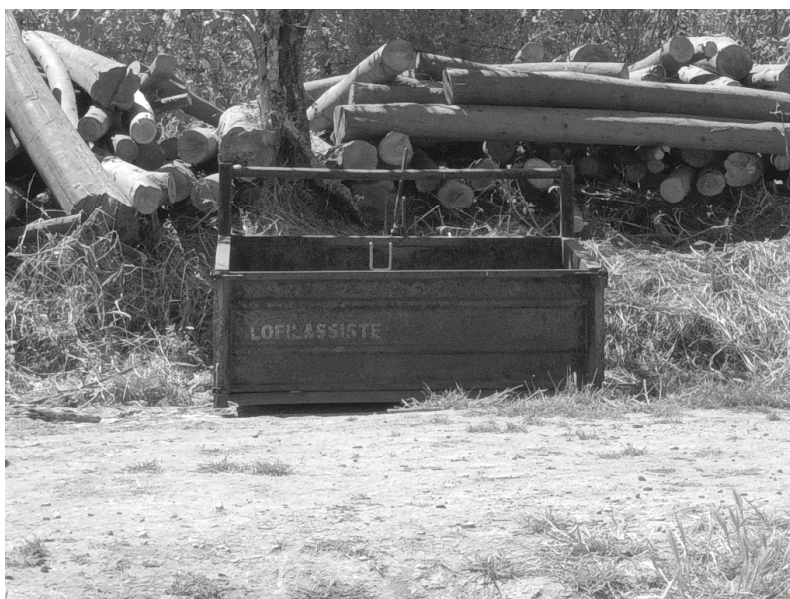
Figura 5. Contentor metálico numa serraria

Como referi no capítulo anterior, os espaços abandonados e remotos são um foco de interesse na minha prática artística. É possível reparar que nestes locais é notável a presença frequente de diversos objetos e materiais como, madeira húmida, telhas partidas, plásticos frágeis, várias formas de resíduos e outras matérias diversas. No meio desta variedade, que é por vezes caos, um dos materiais que me são mais proeminentes são os metais enferrujados que normalmente se encontram em barras, placas, máquinas, peças soltas de elementos arquitetónicos, partes que compõem grandes máquinas industriais, objetos pequenos, utensílios variados, móveis e outras diversas coisas que são típicos de se encontrar conforme as características de cada espaço particular. Maioritariamente, os espaços que visito são de natureza fabril.