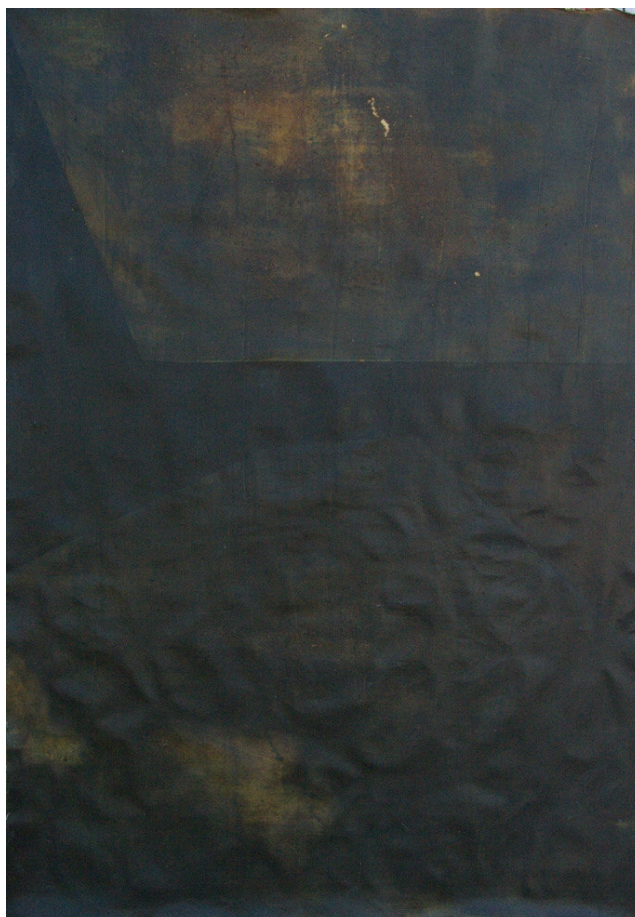
Figura 10. Sem número, 2021

presença representativa destes elementos sólidos que flutuam confere um contraste com o plano bidimensional, sendo que este movimento ocorre no interior da pintura mediante uma trajetória ascendente relativamente à superfície do suporte. Por causa destes elementos aqui anunciados esta pintura beneficia de ser exposta na posição horizontal, uma vez que faz alusão às águas calmas onde coisas flutuam e emergem. Portanto, esta decisão resulta da valorização do valor de movimento e mistério inerentes a esta pintura.