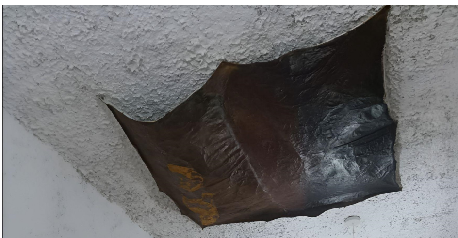
Figura 7. Cortaste-me, 2024

Esta tinta tem uma beleza muito particular que é possível reparar pelo seu brilho, presença, suavidade do toque quando seca e as suas cores saturadas. Para mim, o que