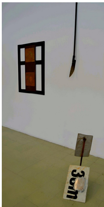
Figura 6. Acto #2, 2022

e, por vezes, são referenciados, senão mesmo, inseridos diretamente.