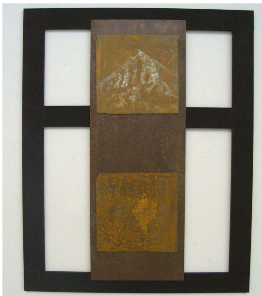
Figura 3. Acto #2, 2022

As cores dos objetos que escolho são majoritariamente desbotadas e esta preferência