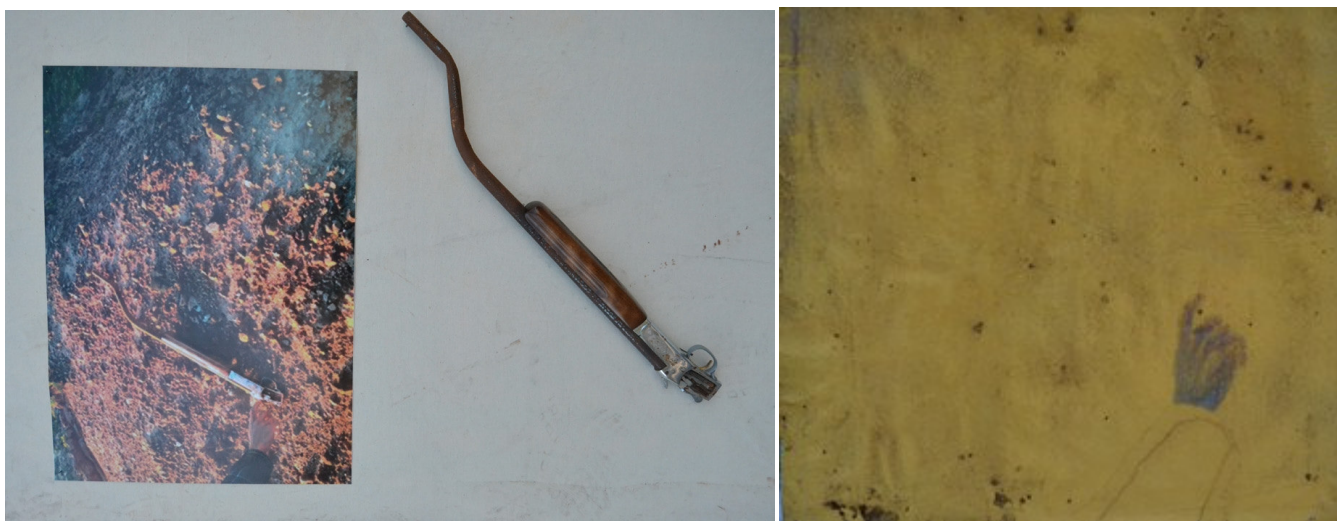
Figura 11. Acto #10, 2022

Esta peça contém três momentos, três naturezas e três olhares sobre o ato anunciado