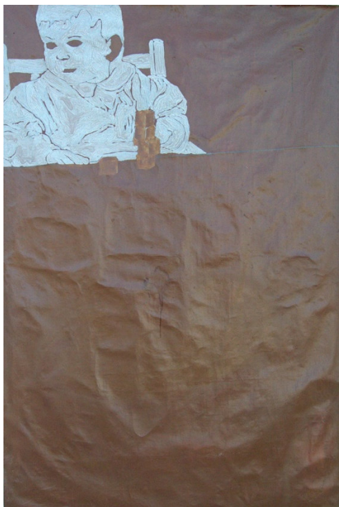
Figura 8. Denominador , 2022

Com o intuito de clarificar a afirmação contida na última frase, tomo como exemplo alguns dos meus trabalhos. A minha pintura, intitulada Denominador representa pictoricamente o tampo de uma mesa e uma criança que se abstrai de brincar com um conjunto de cubos que se encontram pousados sobre a mesa à sua frente. A única indicação de que há um tampo de mesa é uma linha oblíqua que traça sobre a superfície da tela. Excetuando os cubos, que possuem uma cor levemente distintiva do fundo, apenas a criança está sugerida de mesma forma, uma vez que, esta está representada monocromaticamente por uma cor clara e formas irregulares. Esta pintura é comumente exposta de forma a