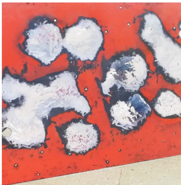
Figura 2. O que é um Espelho, 2017

A recolha de objetos antigos presentes nos locais citados é parte integrante e por vezes é impulsionadora da minha prática artística. No entanto, saliento que – apesar deste aspeto ser indispensável para o meu trabalho –, incorporar os objetos recolhidos durante este ato diretamente no resultado é uma raridade. Como fiz notar, a recolha ocorre segundo um processo de seleção estipulado que, primeiramente, é ditado pelo material e vida útil; segundo e mais importante, é ditado pelo encontro que, por sua vez, depende da experiência que ocorre no instante presente. Posso afirmar que os objetos que se destacam em relação a tantos outros e que são a seguir coletados, não são escolhidos segundo a sua utilidade ou alguma outra finalidade artística que posso estar a projetar.