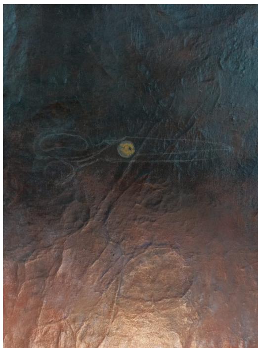
Figura 14. (pormenor) Cortaste-me, 2024

elementos figurativos que, dessa forma, são posicionados meticulosamente sobre a área da tela. As imagens ultrapassam as representações figurativas e conceituais, e surgem como potenciadoras da poesia que as formas e os materiais possibilitam, sendo assim cruciais pela presença que proporcionam. Em outras palavras, os aspetos da matéria são elevados à condição de guia de toda a pintura. Mesmo quando surgem elementos figurativos, estes trabalham em prol das cores e materiais. Há, da minha parte, uma vontade em evitar a visão exclusivamente figurativa a que Antoni se refere: