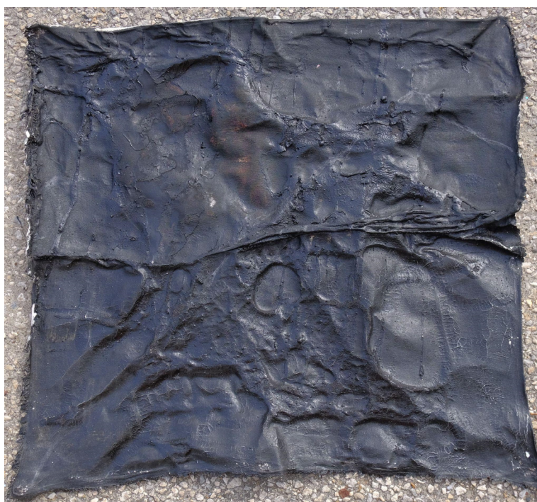
Figura 9. #0006, 2021

Irei agora recorrer a outra pintura da minha autoria para demonstrar o conceito aqui proposto. Como exemplo utilizo esta tela negra intitulada #0006 que foi um dos primeiros trabalhos da atual série de pinturas com sangue, aqui já é perceptível muitos dos meus princípios. Esta pintura ocorre durante um período em que estava fascinado com o processo de combustão e praticava este ato com outros trabalhos realizados anteriormente. Este processo era alvo do meu interesse, pois acho fascinante o seu poder de destruição e imponência na vida cíclica. Por exemplo, este é um recurso utilizado pelos camponeses para concluir um ciclo de agricultura e revitalizar o solo, promovendo assim a renovação dos nutrientes essenciais para esta prática e assim sendo, configura-se como símbolo de início e fim. #0006 foi a primeira peça que realizei com a tinta de sangue e foi a primeira em que