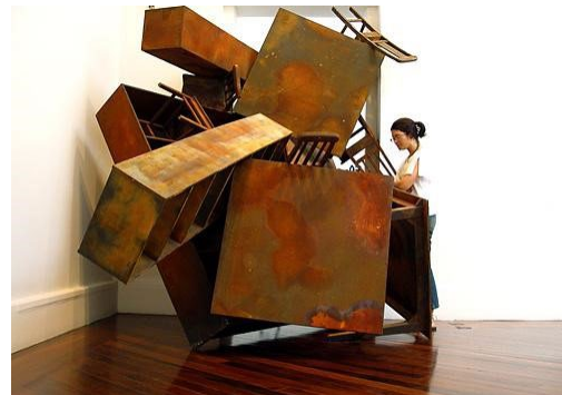
José Bechara, aranha de canto, 2006.