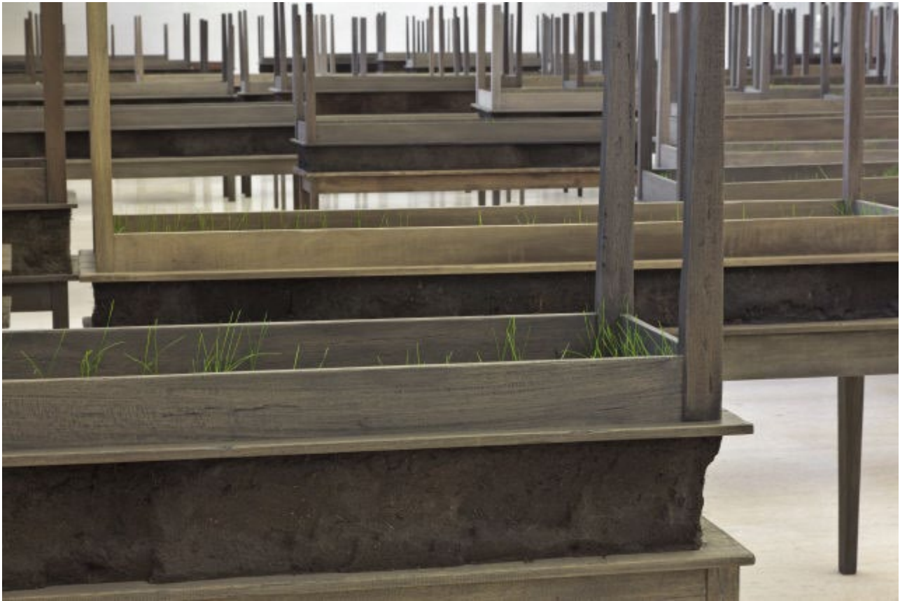
Doris Salcedo "Plegaria Muda" (oração muda), 2011.