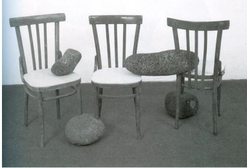
Tony Cragg, sem título, 1983 Fonte: Livro, Cragg, Germano Celant, Charta, 1996