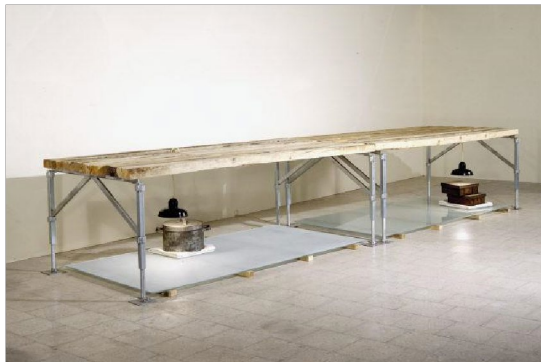
Pedro Cabrita Reis, Meus pais deram-me aquilo que podiam, alma da sua diversa, 1993. Col. Centro de Arte Moderna Fundação Gulbenkian