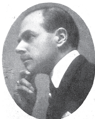
Afonso Lopes Vieira (rev. ABC, 26-01-1922)