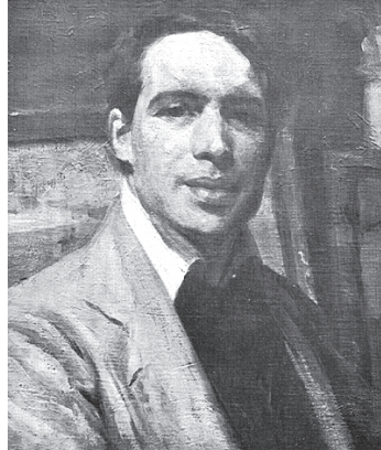
Sousa Lopes, "Auto-retrato" (Museu Nacional de Arte Contemporânea)

(BMLALV, B43, n.º33396, apud Nobre, 2005 II, pp. 469-470)