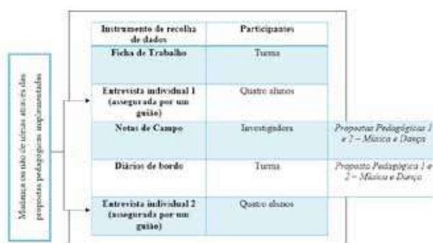
Figura 1: Design do estudo

Tratando-se de um estudo de caso, esta investigação incidiu sobre uma turma de 3.º ano de escolaridade do 1.º ciclo, com 19 alunos. A figura abaixo ilustra o processo de investigação desenvolvido: