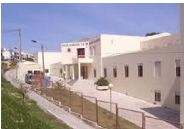
Figura 2 - Escola Sede

secretaria, várias salas de trabalho e outros serviços. Do ponto de vista tecnológico, todas as salas de aula dispõem de computador, projetor ou quadro interativo e internet, sendo que esta última está disponível em todo o edifício. A sala de informática possui treze computadores e um quadro interativo, já a sala de convívio dos alunos, dispõe de alguns jogos didáticos, de uma mesa de ténis de mesa, de matraquilhos e de TV por cabo. A rodear a escola existem alguns espaços com árvores plantadas pelos alunos e, nas traseiras, há um grande espaço para recreio e um campo de jogos, que necessita de uma requalificação.