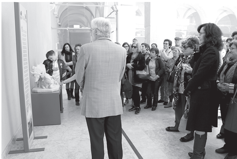
Inauguração da exposição “Animais Nossos Amigos. Dos versos de Afonso Lopes Vieira aos animais de Pedro Anjos Teixeira”, a 16 de abril de 2016, no Museu de Leiria.

As esculturas dos animais, em pedra, ficaram à guarda da edilidade, e integram presentemente o acervo do Museu de Leiria. Foram objeto de intervenção de conservação e restauro, em 2015, e exibidas, em conjunto com a escultura do gato, em bronze, neste espaço museológico, durante a exposição que motivou o estudo apresentado nestas páginas. Esta exposição, intitulada “Animais Nossos Amigos. Dos versos de Afonso Lopes Vieira aos animais de Pedro Anjos Teixeira”, esteve patente, na sala polivalente 2 e claustro do Museu de Leiria, entre 16 de abril e 2 de outubro de 2016 32 , prevendo-se que possa