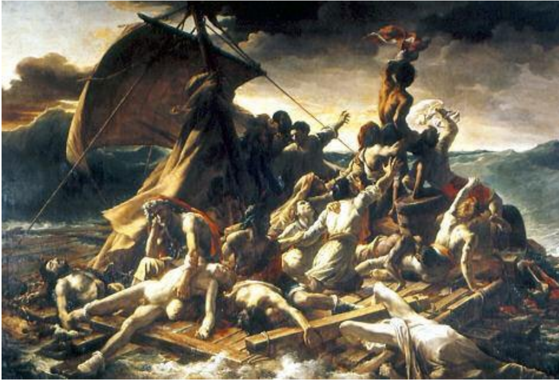
Géricault. "A Jangada da Medusa". 1819, Museu do Louvre.

O quadro "O Três de Maio de 1808" de Goya é inseparável de um outro quadro narrativo intitulado "O Dois de Maio de 1808" e mesmo de toda a série de gravuras intituladas "Os Desastres de Guerra". Tanto na primeira pintura como na segunda são tratados episódios de guerra a propósito das invasões francesas. O quadro "O Três de Maio de 1808" documenta um fuzilamento no seu momento decisivo, ainda nada aconteceu e tudo parece estar prestes a acontecer num momento que é tenso, teatral e mesmo cinematográfico. É o momento mais significativo do acontecimento por isso é cristalizado em pintura.