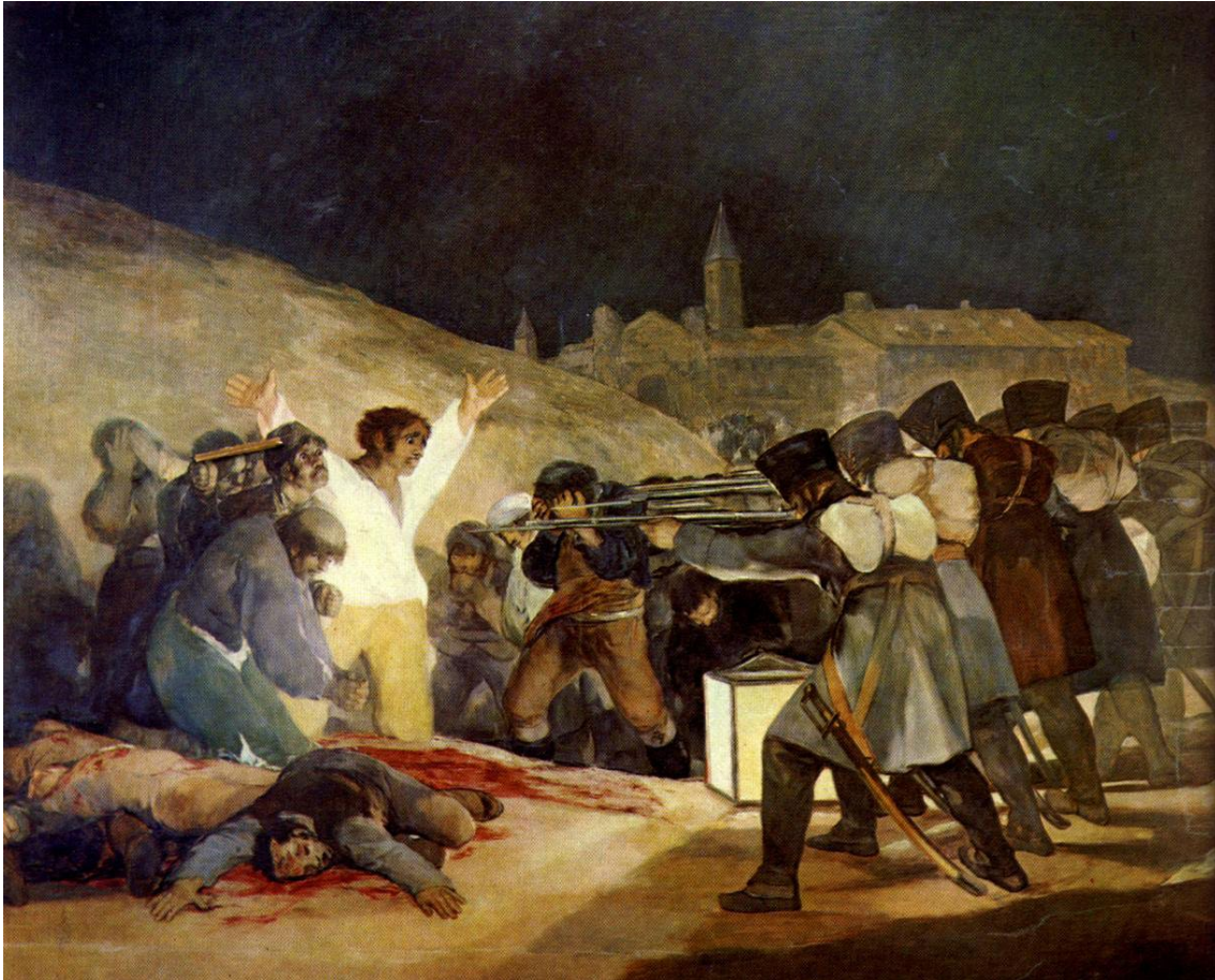
Goya, O Trés de Maio de 1808, 1814 Óleo sobre tela, 266 X 345 cm Madrid, Museo del Prado

“Há uma imensa diferença entre ver uma coisa sem o lápis na mão e vê-la desenhando-a. Ou melhor, são duas coisas muito diferentes que vemos. Até mesmo o objecto mais familiar aos nossos olhos se torna completamente diferente se procurarmos desenhá-lo: percebemos que o ignorávamos, que nunca o tínhamos visto realmente. O olho até então servira apenas de intermediário. Ele fazia falar-nos, pensar; guiava os nossos passos, os nossos movimentos comuns; despertava algumas vezes os nossos sentimentos. Até nos arrebatava, mas sempre por efeitos, consequências ou ressonâncias de sua visão, substituindo-a, e portanto abolindo-a no próprio facto de desfrutar dela.”