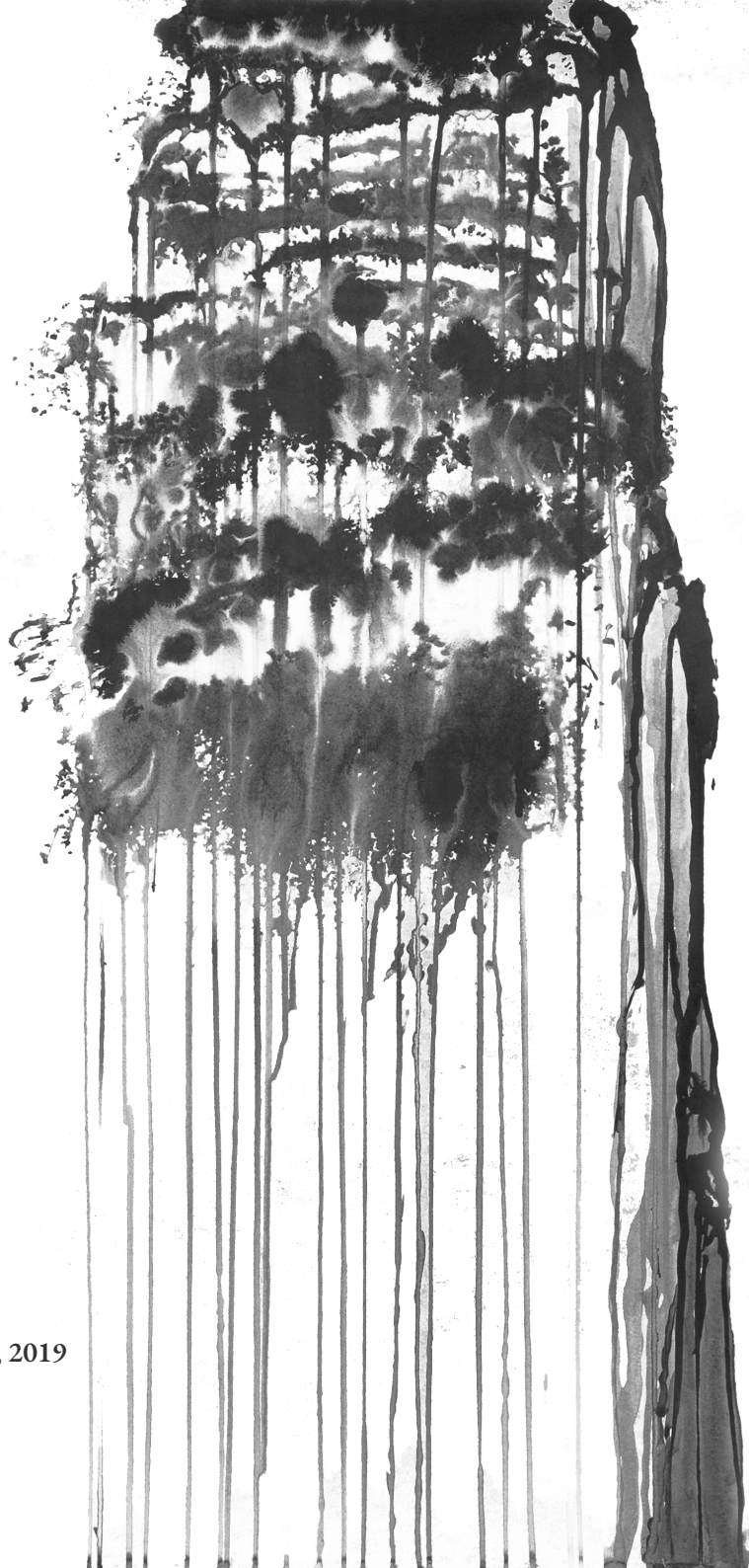
Gonçalo Caetano, 2019