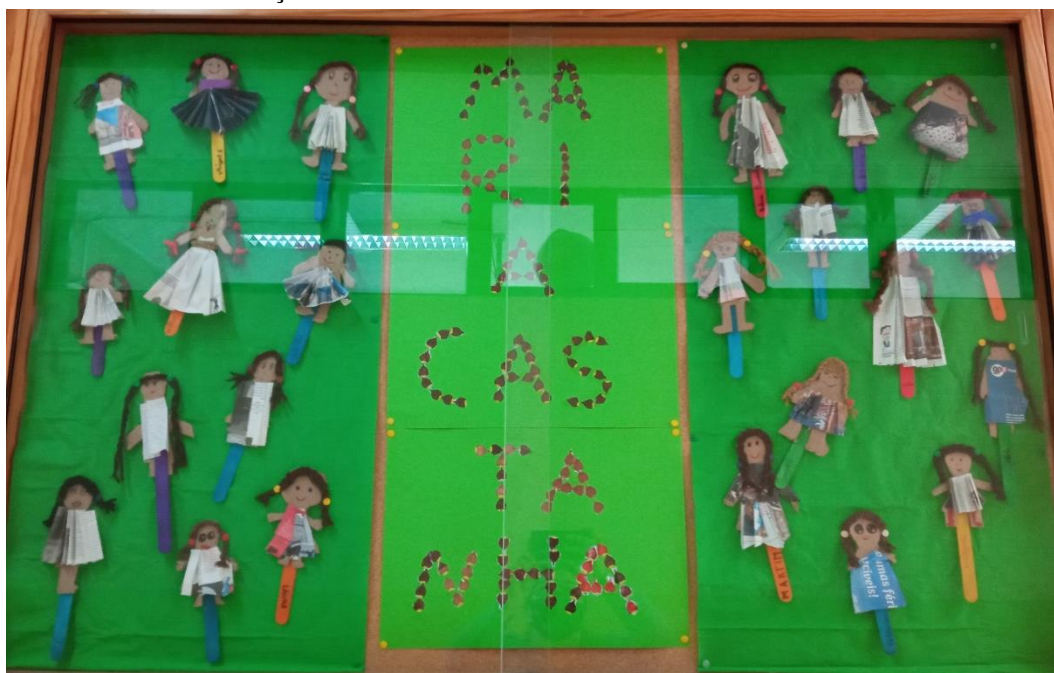
FIGURA I – EXPOSIÇÃO DA ATIVIDADE “MARIA CASTANHA”