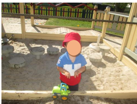
Fotografia 6 - Criança J a brincar com o trator na estrutura do barco

No recreio exterior procuram na maioria das vezes as representações de animais baloiço e as representações de moto 4, bem como as bicicletas de equilíbrio. As observações nesta zona. Tornam-se complexas devido à presença de mais crianças de quatro salas de creche e respetivas auxiliares de sala, com quem é dividido o recreio exterior. Neste recreio realizei uma observação da Criança P que, sentado em cima da moto 4, andava para trás e para a frente enquanto observava os pares a brincar, estava com um bom nível de bem-estar. No entanto, o pai chegou e esta criança automaticamente saiu da moto 4 e foi ter com o pai, todas as interações que a Criança P realizou a partir desse momento foram impostas e conduzidas pelo pai. Em outras situações que observei, percebi que, assim que os pais chegam, esta criança começa a realizar interações, as quais são fomentadas e conduzidas pelo pai/mãe, estas observações não foram registadas nos quadros de registo de observações, pois têm a intervenção do adulto e, no meu ponto de vista, deixa de ser genuinamente uma interação da criança.