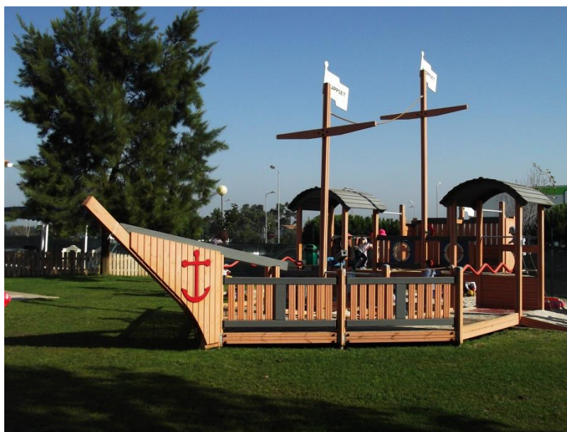
Fotografia 2 – Espaço exterior

O recreio exterior é partilhado com as restantes salas de creche e de transição, zona onde as crianças podem socializar e partilhar momentos. Nos dias de mais sol, são colocados chapéus de sol para, desta forma, proporcionar mais zonas de sombra. Para além dos objetos que podem explorar na areia e das representações de veículos, as crianças, dispõem ainda de bolas e estruturas para baloiçar com formas representativas de corpos de animais.