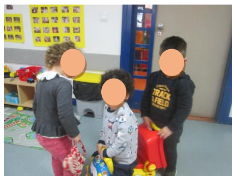
Fotografia 3 Criança I, Criança P, Criança Is