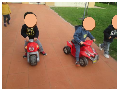
Fotografia 5 - Criança P a brincar andar na moto4

No que concerne à categoria «Interações com os pares», como referido anteriormente, observei poucas interações, as crianças em idade de creche ainda estão a desenvolver a socialização, partilha e interação com o outro, necessitam de tempo para estabelecer relações (Cordeiro, 2010 e Neto & Lopes, 2017). Relembro que, a maioria das crianças deste grupo e tendo em conta que é uma sala de transição, estava a frequentar pela primeira vez a creche e o contacto com crianças era reduzido, visto que estavam em casa com avós ou pais. Ao longo das semanas percebi que, destas quatro crianças, uma