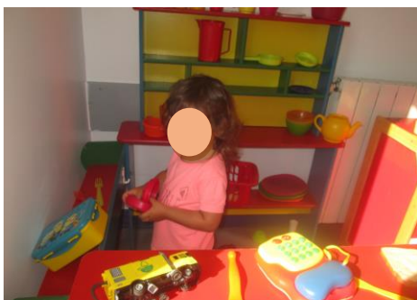
Fotografia 4 Criança IL a brincar na Área da Casinha

Nos momentos de brincadeira livre, as crianças observadas, utilizam a «cozinha» para representar atividades do quotidiano. No caso dos veículos da garagem, representam pequenas corridas, porém, na maioria das vezes, andam em cima do carro dos bombeiros ou do camião basculante pela sala.