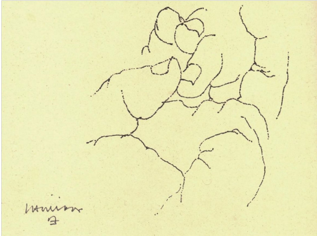
(Fig. 2) Eduardo Chillida, 1974