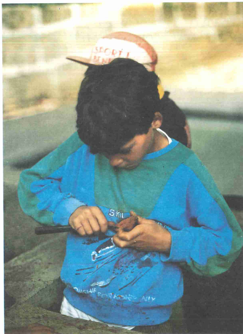
A construção do brinquedo artesanal