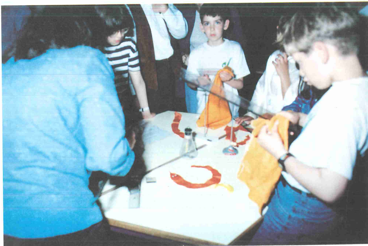
Brincando com a magia das coisas (electricidade estática)

interesse por situações e fenómenos que, estando relacionados com o quotidiano da criança e recorrendo a materiais facilmente acessíveis a todas, poderiam revelar-se inesperadas. Pretendeu-se ainda que as crianças pudessem activamente interagir com os materiais, manipulando-os e propondo formas de os manipular, sob a supervisão de adultos. Foi com este espírito que as crianças tiveram ao seu dispor actividades como «Ácidos ou bases?», «Detectar falsificações», «Como um arco-íris», «Girar as cores até ao branco», «Sons graves e agudos», «A cobra dançarina», Líquidos flutuantes», Movimento por convecção», «O palhaço articulado» ou «Caleidoscópio».