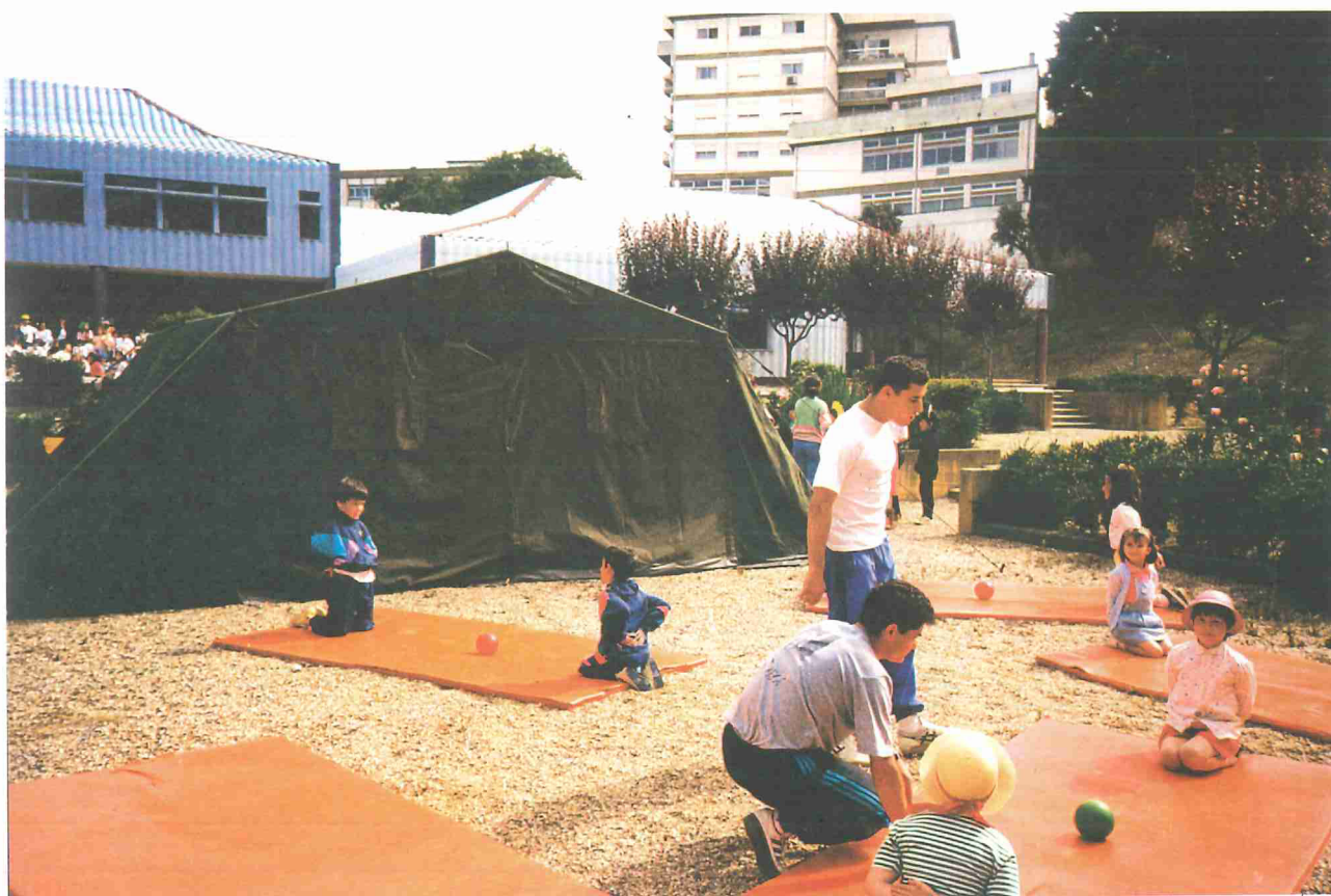
O Popeye e o Brutos disputando uma lata de espinafres (Jogos de Oposição e Luta)

Luta — vivência de formas jogadas próprias das actividades de Oposição e Luta.