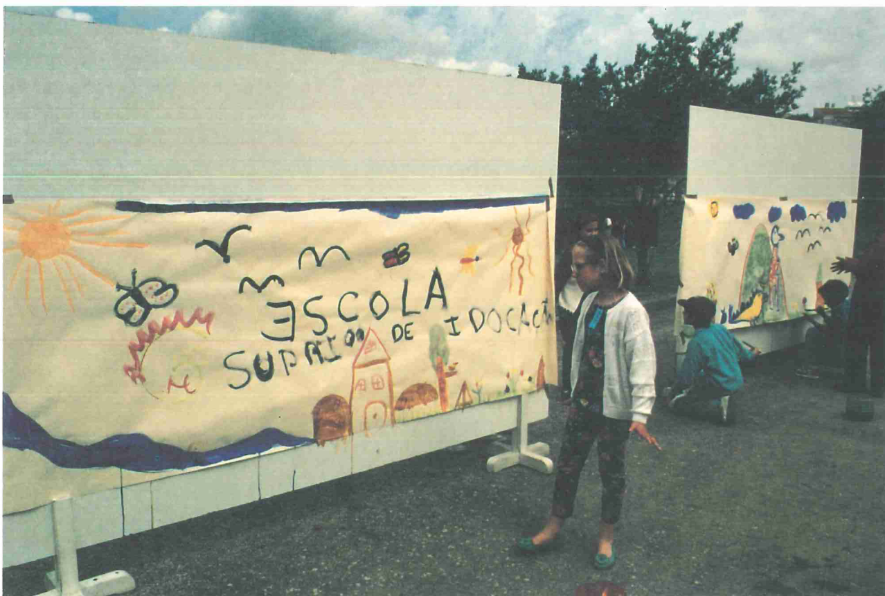
A epistemologia da criança

Verificou-se uma grande adesão entusiasmo por parte das crianças e igual empenhamento dos alunos da área.