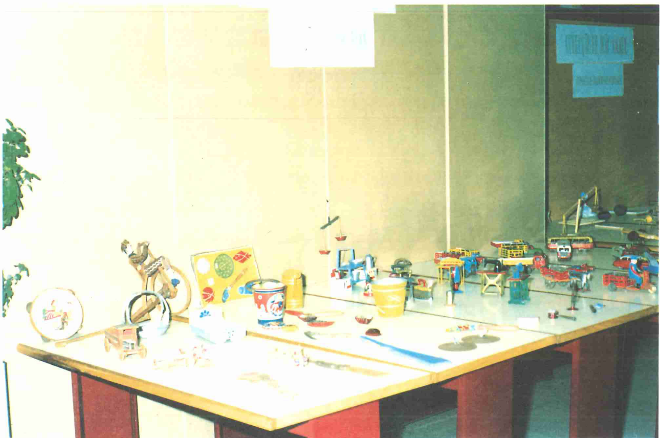
Brinquedos tradicionais populares

(9) ITURRA, Raul (1990). Fugirás à Escola para Trabalhar a Terra . Lisboa: Escher, p. 123.