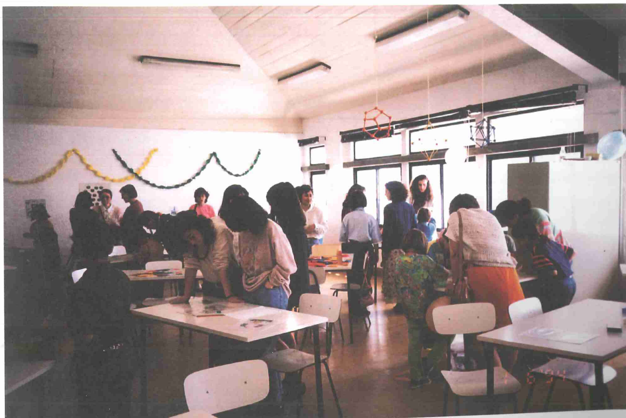
Brincando com poliedros, tangrans, geoplanos, calculadores. ...

Não podemos deixar de agradecer a colaboração prestada pelo Núcleo Regional da A.P.M., bem como pelos alunos finalistas do ano lectivo de 1993/1994 da variante de Matemática e Ciências da Natureza da E.S..E.L.