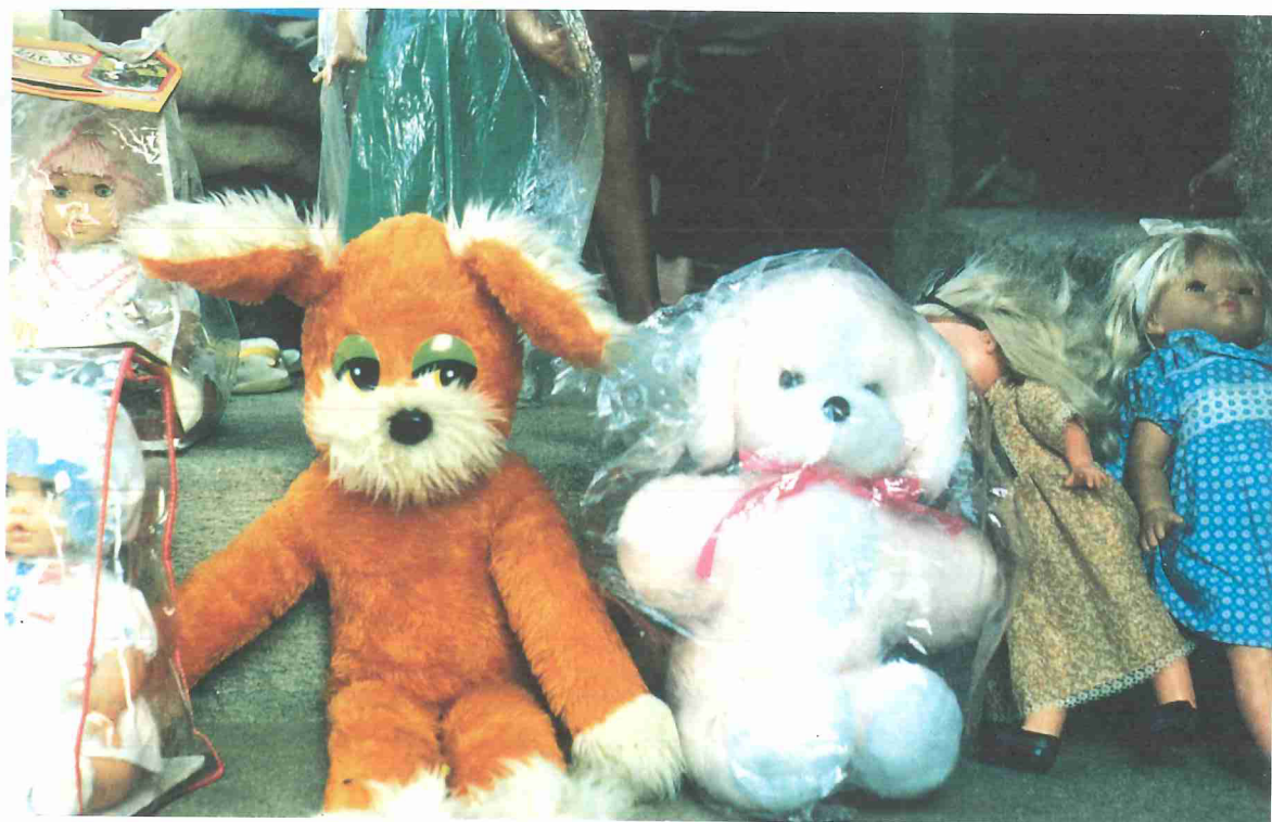
A contemplação do brinquedo industrial