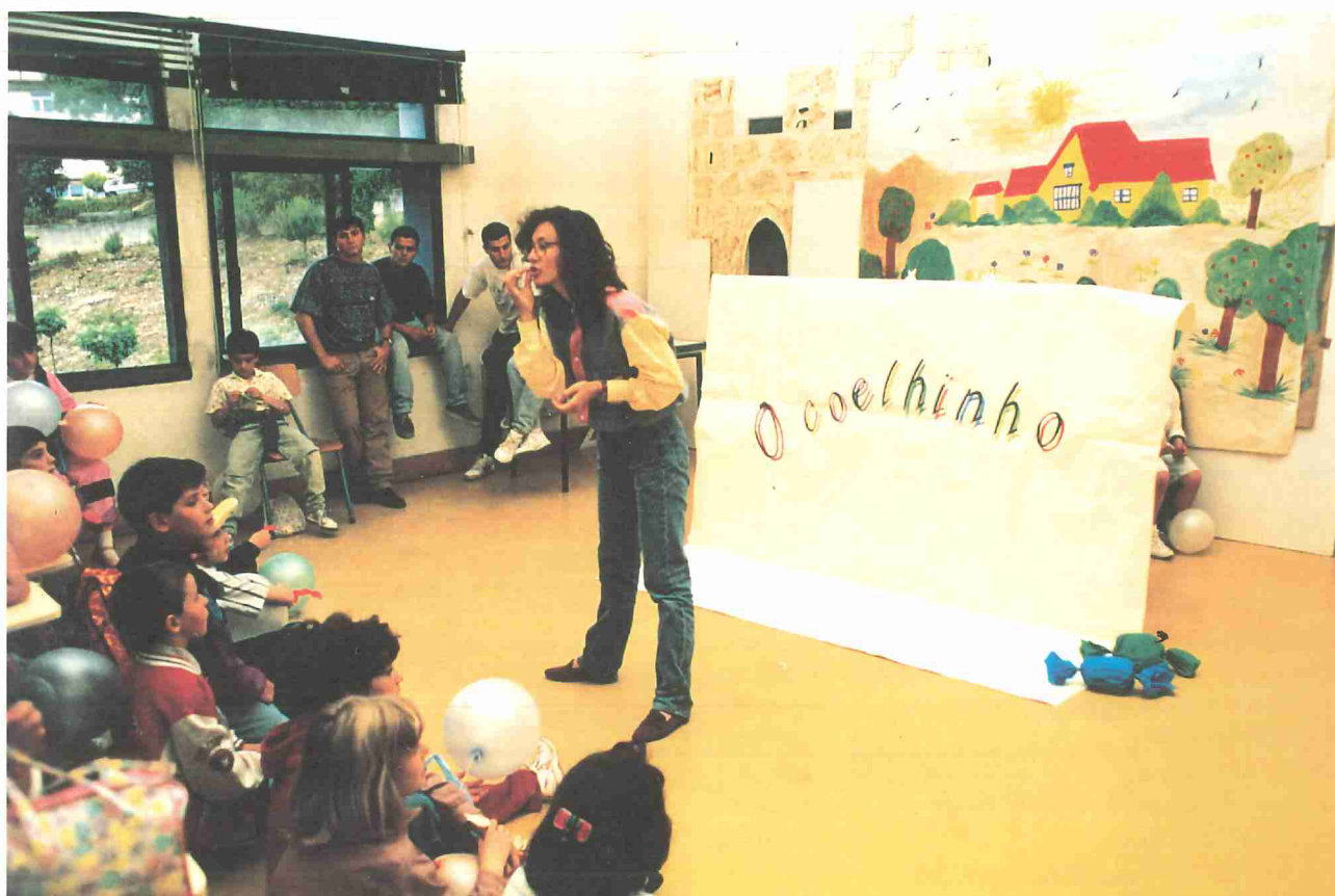
O coelhinho... e muitas outras histórias!