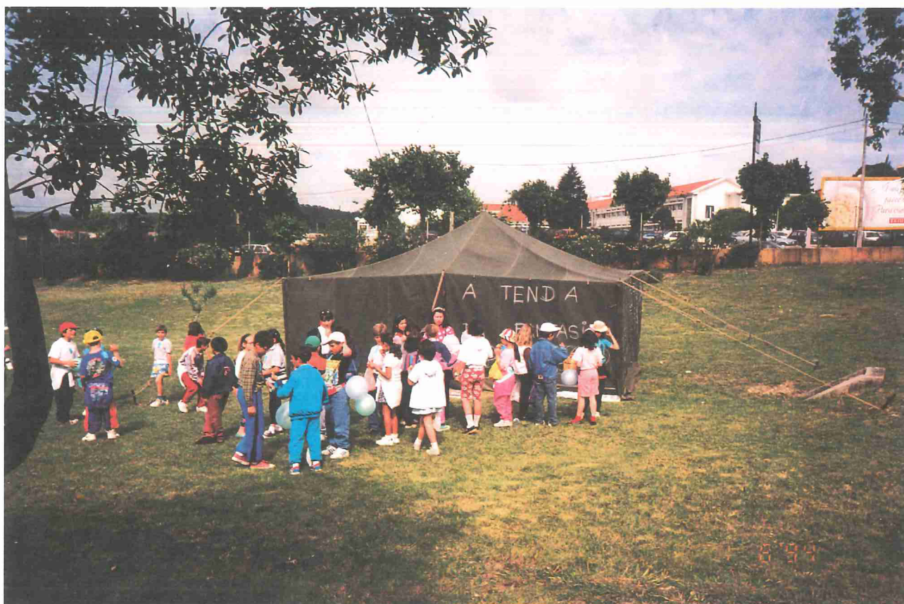
A tenda da fantasia...