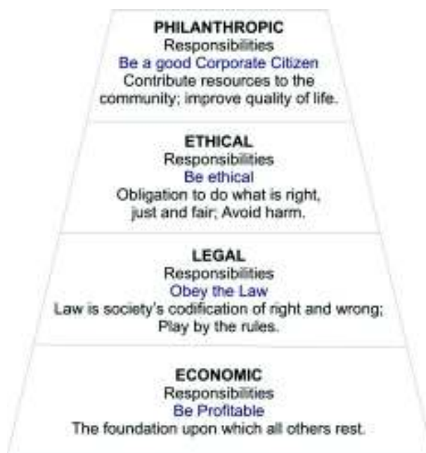
Pirâmide de Carroll (1991)

Para tanto, é possível classificar a RSC a partir da análise da pirâmide de Carroll (1991), que tem sido até hoje o modelo mais aceito pelos estudiosos da matéria. Nela temos quatro princípios básicos e sem os quais não se é factível considerar a atuação de uma organização de acordo com parâmetros relativos à matéria.