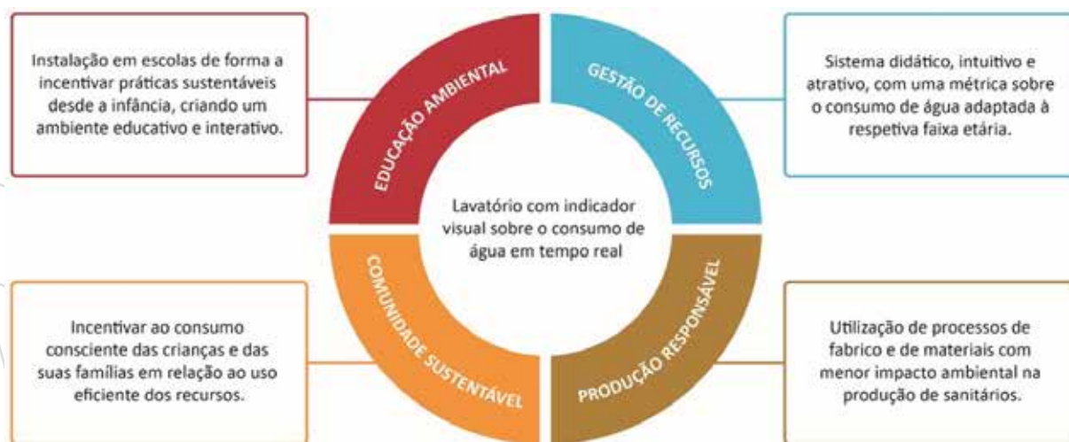
Figura 1 - Objetivos de Desenvolvimento Sustentável (ODS 4, 6, 11 e 12) Associados ao desenvolvimento do projeto.

Os ambientes escolares são espaços estratégicos para a educação ambiental, oferecendo a oportunidade de implementar soluções que promovam práticas sustentáveis de forma educativa, lúdica e intuitiva, em concordância com diretrizes da UNICEF, que destacam a importância de contribuir para a formação de uma geração consciente na adoção de práticas sustentáveis. Uma análise sustentada nos Objetivos de Desenvolvimento Sustentável (ODS) 4, 6, 11 e 12, identificou o consumo de água nestes espaços como uma oportunidade de projeto, em diferentes dimensões.