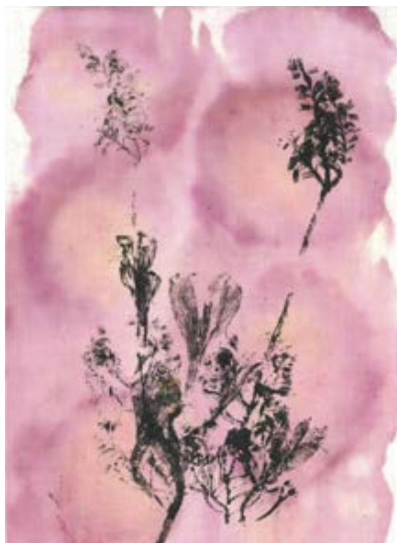
Cruz, Sara, “Livro de Clóris I” (detalhe), 2021, tecido, suco de variadas plantas, tinta acrílica, linho, 21 x 15,5 cm.