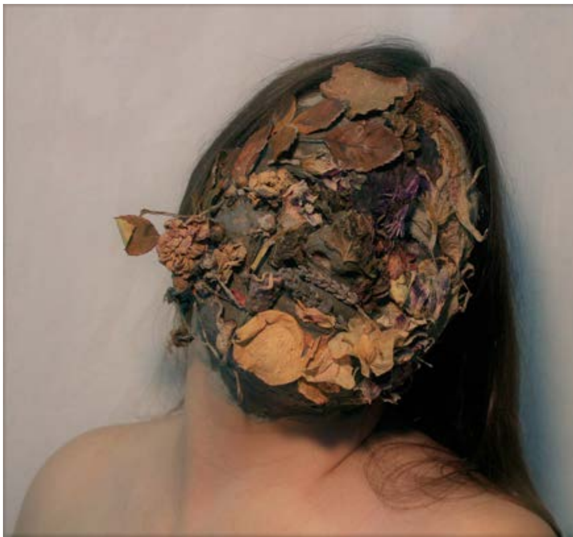
“Flor na Pele IV”, 2019, fotografia digital a cores, 59 x 55 cm

Pretendo representar através da minha perceção poética, a fragilidade do meu corpo e da vida vegetal. Para tal, decidi demonstrar por meio das minhas séries de trabalho em desenho, fotografia digital e gravura (monotipia).