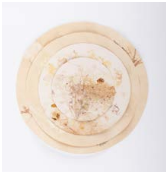
“Livro de Clóris III”, 2021, papel, suco de variadas plantas, 27,5 cm