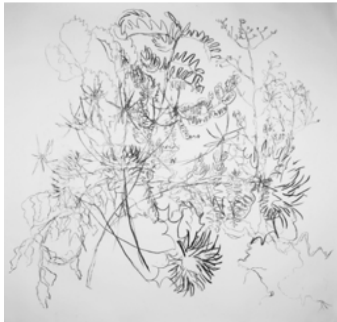
"Harmonia Inquietante I", 2021, carvão sobre papel, 1500 x 1600 cm

Outra condição é evitar a compra de plantas pois pretendo criar uma ligação entre mim e o vegetal: com o desenvolvimento das impressões, comecei a observar as saídas para colher plantas como o meu momento íntimo; inversamente a espaços fechados como a oficina, o atelier e o quarto, os espaços verdes oferecem uma ligação íntima com o redor, que me permitiu ganhar uma visão mais sensível e interesse mais profundo na investigação sobre a vida vegetal.