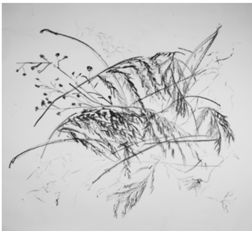
“Harmonia Inquietante II”, 2021, carvão sobre papel, 1500 x 1600 cm

Pode-se dizer que a minha investigação resolve-se no interesse pela alteração da presença e na produção de peças artísticas que nunca se irão “cristalizar”, serão, então, objetos incompletos que se encontram debaixo do processo de constante transformação, quer sejam técnicas ou, como no caso do meu trabalho temporalidade.