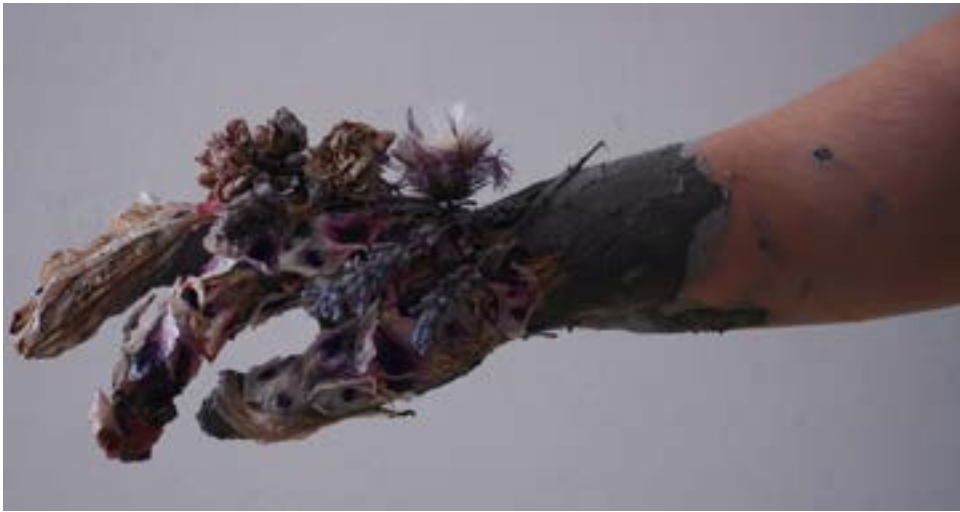
"Flor na Pele V", 2019, fotografia digital a cores, 84 x 49,2 cm

A minha percepção poética emergiu ao longo do segundo ano da licenciatura em Artes Plásticas, no decorrer da produção de desenhos de plantas e em simultâneo com a experimentação fotográfica. Ambos os media tinham um ponto em comum: consolidar o meu corpo com as plantas. Os resultados que obtive, revelaram um interesse de dar continuidade a este conceito e aprofundar a investigação através de referências artísticas e bibliográficas.