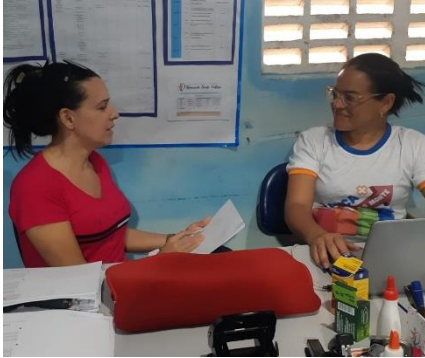
Conversa com a coordenadora da escola antes do início do projeto

Evidências de algumas atividades que foram realizadas pelos alunos do decorrer do projeto