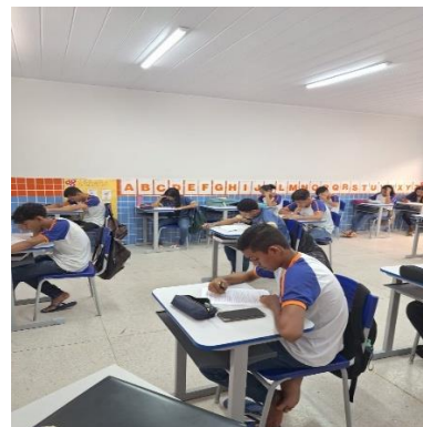
Atividade de compreensão textual