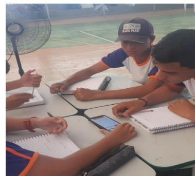
Gravação de podcasts iniciais