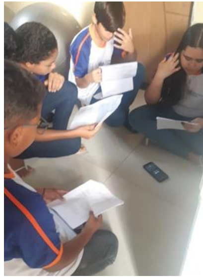
Gravação do podcast final