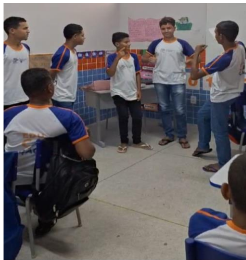
Dramatização de textos lidos