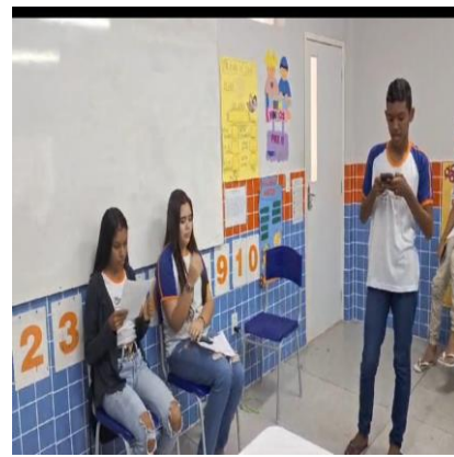
Leitura de textos com formato de podcast