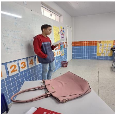
Declamação de poemas narrativos