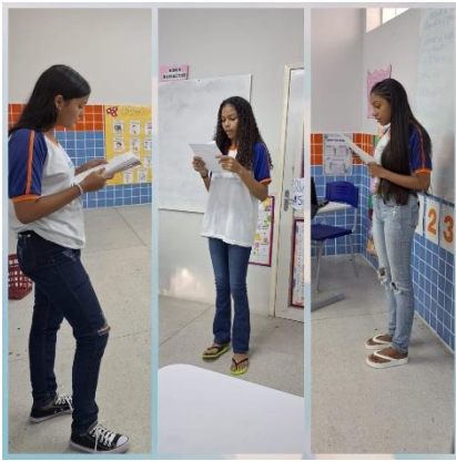
Apresentação de gêneros narrativos