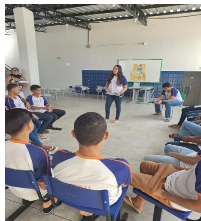
Roda de leitura no pátio da escola