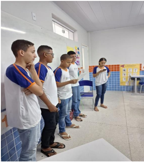
Apresentação sobre o que é podcast