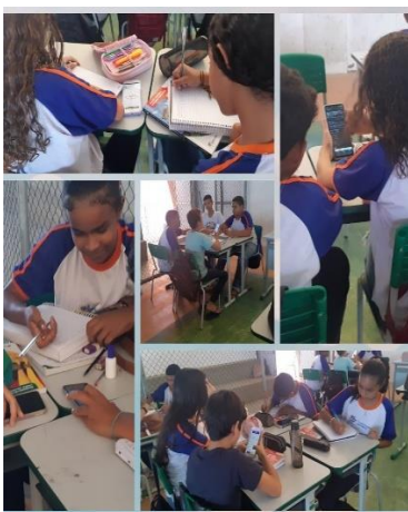
Pesquisa sobre o aplicativo Spotify