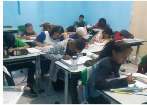
Realização da compreensão textual SAEB 1