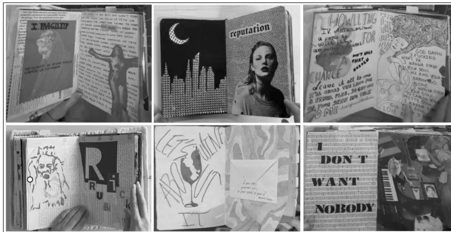
Figura 7 — Páginas de cadernos de artista — elementos relacionados com valores simbólicos

A vasta quantidade de composições, tão diversas, mas também convergentes nos temas e nos elementos representados, revela que se cumpriu os objetivos do projeto. Os cadernos de artista são produtos da expressão e criatividade e pesquisa dos estudantes, aos quais foi dedicado tempo, esforço e dedicação.