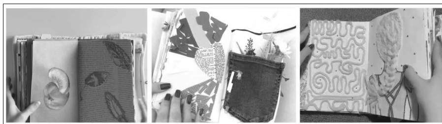
Figura 1 — Cadernos de artista — Páginas representativas da diversidade de técnicas e materiais

As páginas dos «cadernos de artista» resultaram em composições visuais com aplicação de técnicas e combinações de diferentes meios de expressão: desenho, pintura com materiais convencionais e não convencionais; colagem de elementos bidimensionais (fotografias, desenhos, material impresso, selos, rótulos, entre outros), fotomontagem, desenho de letras (criação de letras e arranjos visuais de palavras), estampagem, monotipia, dobragens, formas costuradas/bordadas, colagens polimatéricas em volume (elementos naturais, quilling , fios, elementos indiferenciados), «materiais pré-existentes», conforme designação de Veneroso (2023) para fragmentos de papéis artesanais, desenhos, pinturas, resgatados a composições visuais antigas e já existentes na sala-laboratório de expressão plástica (ver exemplos representados na Figura 1). Em alguns foi explorada a tridimensionalidade, criando soluções pop-up , através da construção de mecanismos e encaixes que se acionam por si quando o livro é folheado. Cada estudante realizou um caderno com cerca de 70 composições visuais — algumas a ocupar uma única página e outras a ocupar duas páginas; algumas composições ocupam várias páginas funcionando com formas vazadas.