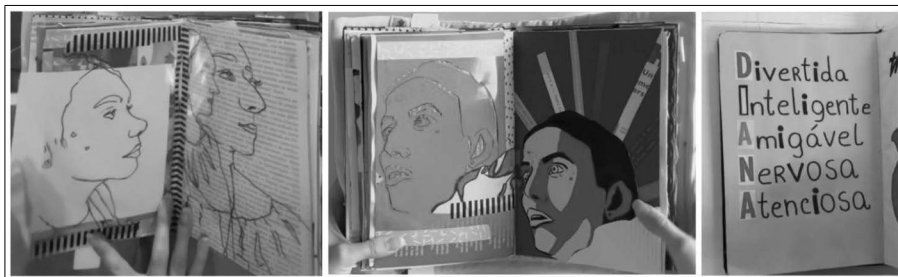
Figura 6 — Páginas de cadernos de artista — elementos relacionados com os consumos visuais

Globalmente, os cadernos apresentam repertórios visuais que representam os seus autores e a sua cultura, a sua «tribo», isto é, a sua identidade enquanto membros de um grupo que partilha determinados hábitos, valores, preferências musicais, pensamentos, vocabulário, redes de sociabilidade, entre outros aspetos. Ao folhear alguns cadernos, é imediata a interpretação de que representam uma «cápsula do tempo», na medida em que se constituem de narrativas pessoais e visuais em que fica evidente o significado que atribuem ao momento de ser estudante em Leiria, à família, aos amigos, aos símbolos, aos lugares, sendo estes elementos portadores de sentidos, histórias, afetos, valores simbólicos. São diversos os elementos que denunciam o consumo de imagens e uma relação com as redes sociais: símbolos de marcas, a escrita em inglês, frases que expressam rebeldia e crítica a acontecimentos do atual contexto social e cultural, composições visuais que reproduzem soluções visuais que são conhecidas das «redes» – ver exemplos representados na Figura 7.