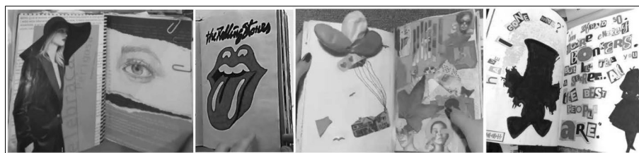
Figura 5 — Páginas de cadernos de artista — elementos relacionados com os consumos visuais

Disney, The Powerpuff Girls , filme Up , Alice no País das Maravilhas , entre outros); imagens de atores/atrizes, jogadores de futebol, recortes de revistas de moda (ver exemplos representados na Figura 5). São muitas as representações de elementos infantis estereotipados — casa, sol, estrela, animais (como o cão, gato, caracol ou borboleta) ou «bonecos» que representam elementos imaginários do universo infantil (como a fada, o dinossauro ou flores e objetos antropomorfizados). As páginas com este tipo de elementos parecem ter menor carga expressiva, pois assentam muito na reprodução de elementos já existentes e não criados pelos autores do caderno, mostrando como o estereótipo pode ser um elemento redutor da expressão pessoal e da capacidade de comunicar através da linguagem plástica. Em muitos casos, nos cadernos predominam este tipo de elementos, conjugados com páginas de experiências de «técnica pela técnica» em que, pela escolha de cores se denota alguma expressividade e busca pela composição, lembrando Gil (2005, p. 22), que questiona «Uma reta, uma cor, uma curva, seja qual for o seu grau de abstração, não exprime algo?», referindo-se aos elementos visuais como linhas, cores e formas, que independentemente de sua abstração, têm a capacidade de expressar emoções e significados profundos.