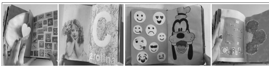
Figura 3 — Páginas de cadernos de artista — exemplos de elementos abstratos