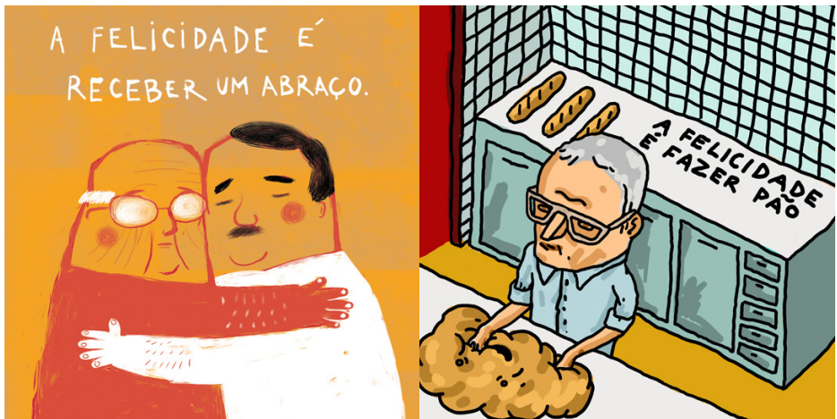
Imagem 4 - Felicidadário, 2013