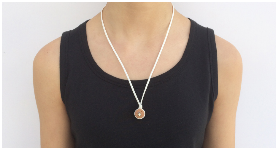
Imagem 34 - Jóia de Família - com peça de brinco danificado