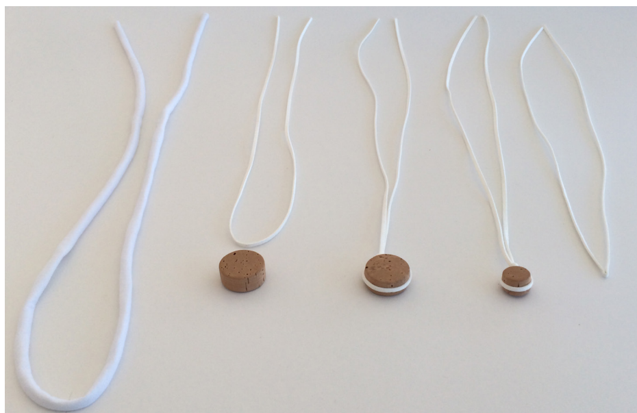
Imagem 19 - Jóias de Família

A relevância dada à capacidade de fazer a pessoa sentir que carrega algo de valor para outra pessoa, foi o princípio orientador das soluções desenvolvidas. Acabando por influenciar a escolha de algumas matérias-primas utilizadas.