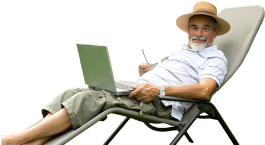
Imagem 1 - Projecto TIO , 1999

O Projecto TIO foi criado pela empresa BYWEB em 1999, no âmbito do Ano Internacional das Pessoas Idosas. Esta empresa também desenvolveu os Projectos Net@vó e VIVER que exploram a intergeracionalidade como forma de desenvolver a aprendizagem e a solidariedade entre gerações.