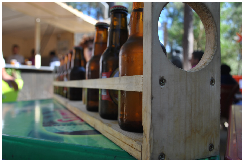
Imagem 10 - Metro de cerveja que consiste num conjunto de 10 cervejas, habitualmente vendido durante as festas, com o objectivo de ser partilhado