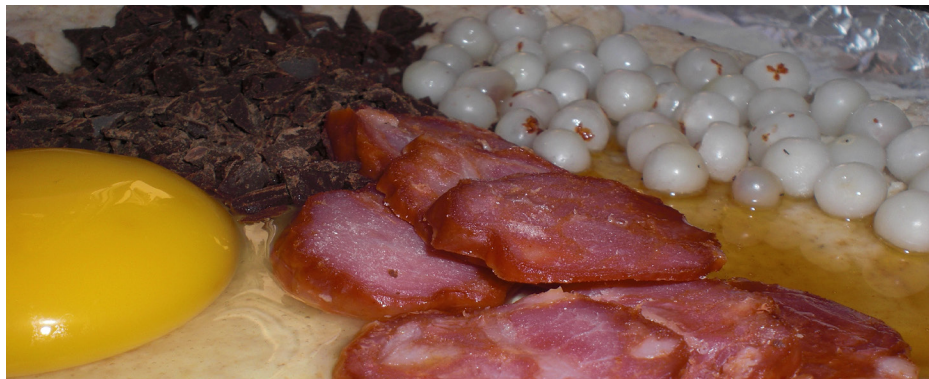
Imagem 15 - Ingredientes utilizados com base nos gostos familiares: chouriço, ovo, chocolate, mel e camarinhas

Na última fase da experimentação optou-se por fazer pequenas bolas de massa a partir da grande bola de massa inicial. Antes de levar as pequenas bolas de massa a cozer, cada pessoa colocava dentro de algumas delas o seu alimento não processado preferido. Deste modo, afastou-se por completo o ruído que camuflava os diversos sabores, na primeira experiência, criando um conjunto de pequenas broas com sabores variados, escolhidos a partir das preferências pessoais de cada uma das pessoas envolvidas.