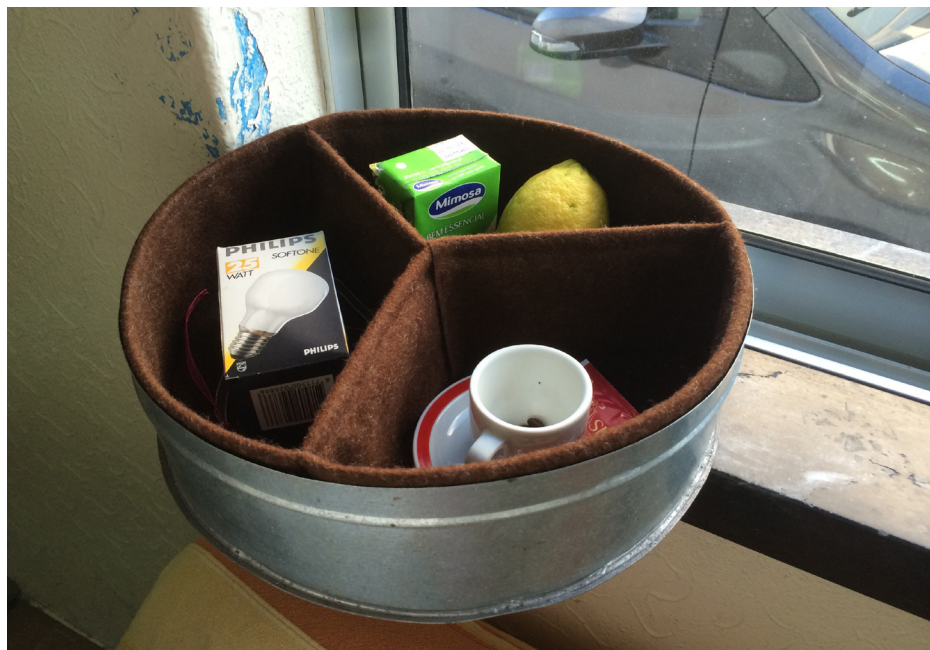
Imagem 26 - Caixa de Roda (Ana para Dina)