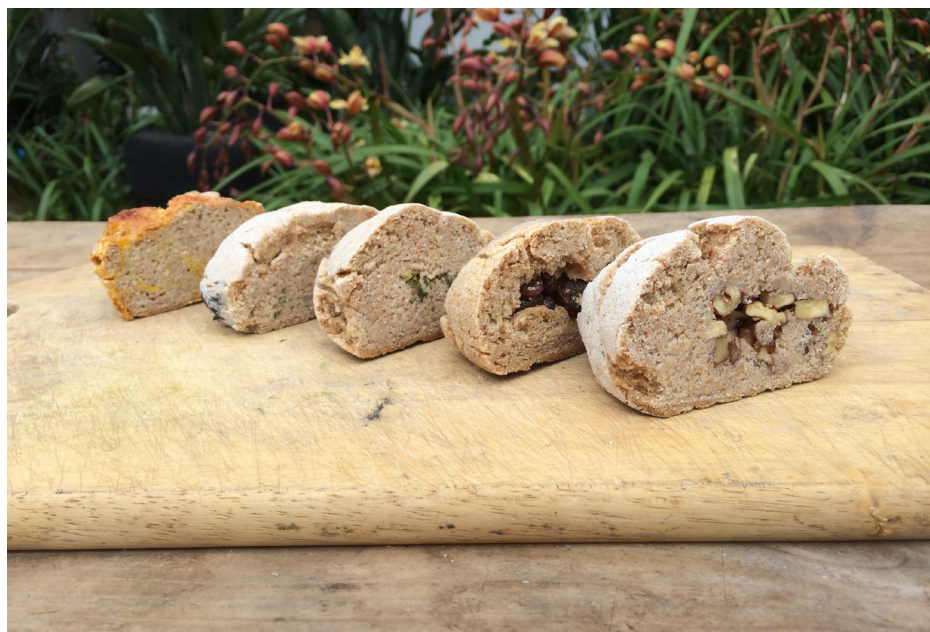
Imagem 29 - Broa recheada com: ovo, rúcula, agrião, passas de uva e noz