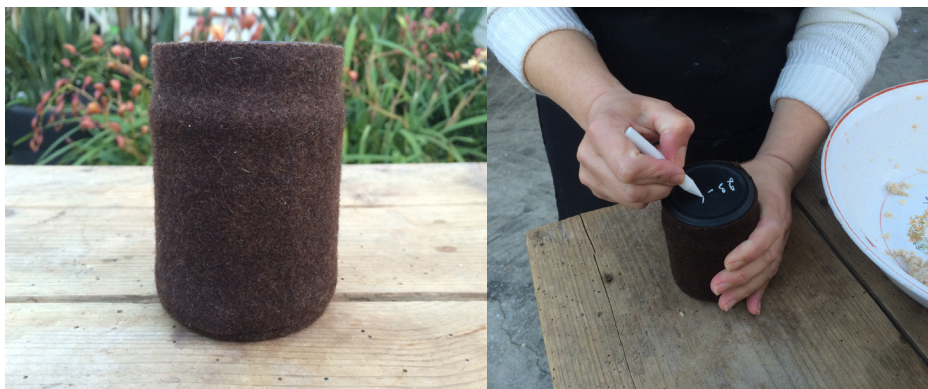
Imagem 17 - Frasco de fermento vivo

As tampas dos frascos foram pintadas com tinta com efeito de ardósia para que a pessoa possa escrever com giz a data da última vez que o fermento foi renovado. A escolha destes materiais foi feita com o intuito de utilizar materiais sugestivos, simples e genuínos.