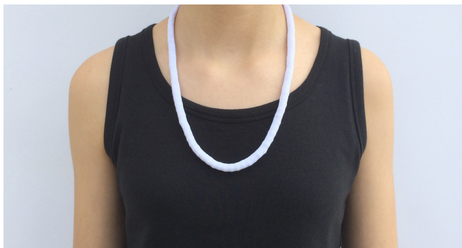
Imagem 37 - Jóia de Família - com colar de pérolas