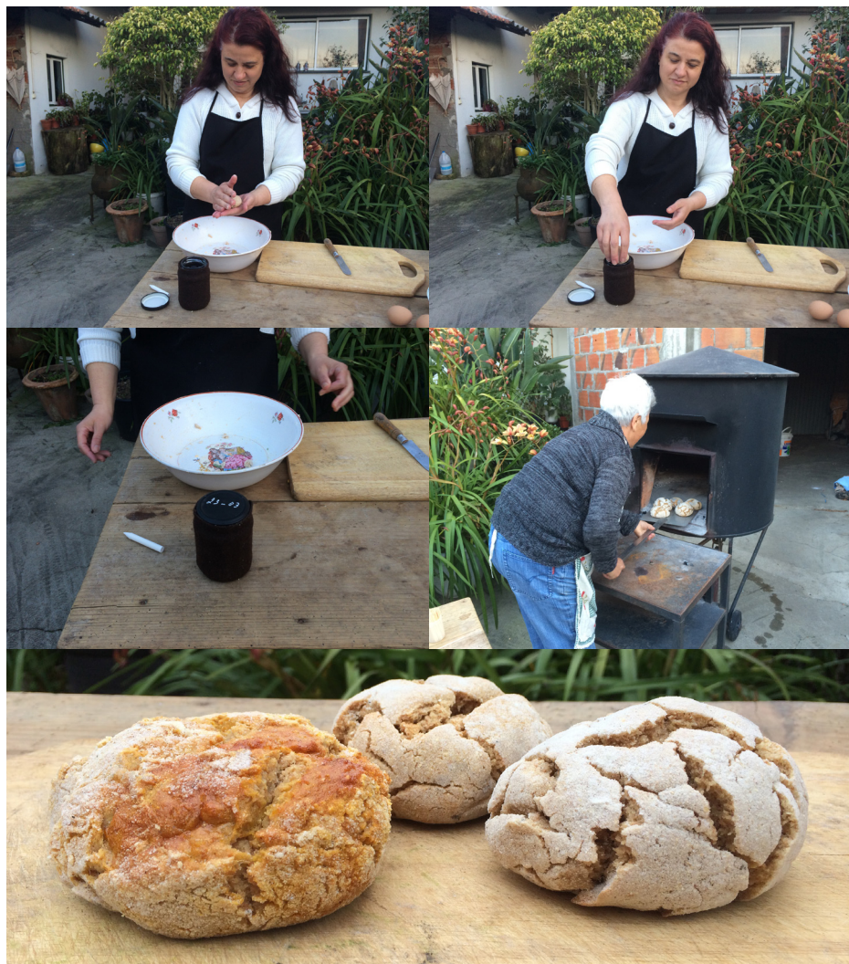
Imagem 28 - Preparação do Bolo da Amizade