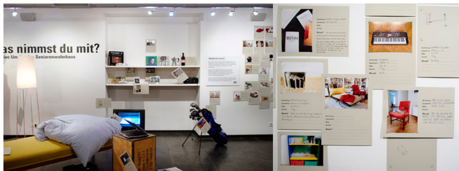
Imagem 2 - DANKLHAMPEL, How much less is more? , 2009

Em 2010 surge o projecto DANKLHAMPELs Sundaycake com a cooperação do MAK de Viena e de Metallwerkstatt Seidl. É um projecto que visa respeitar e conciliar as diferentes preferências das pessoas em dias festivos, através de bolos caseiros que respondam a diferentes preferências de sabores ou texturas.