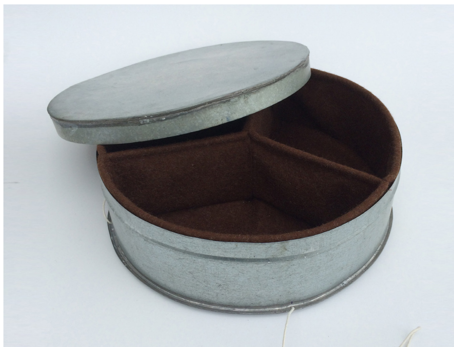
Imagem 39 - Caixa de Roda com forro de burel