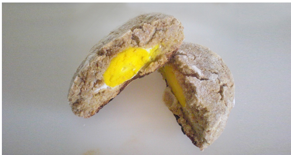
Imagem 16 - Broa recheada com ovo

Na última fase da experimentação optou-se por fazer pequenas bolas de massa a partir da grande bola de massa inicial. Antes de levar as pequenas bolas de massa a cozer, cada pessoa colocava dentro de algumas delas o seu alimento não processado preferido. Deste modo, afastou-se por completo o ruído que camuflava os diversos sabores, na primeira experiência, criando um conjunto de pequenas broas com sabores variados, escolhidos a partir das preferências pessoais de cada uma das pessoas envolvidas.