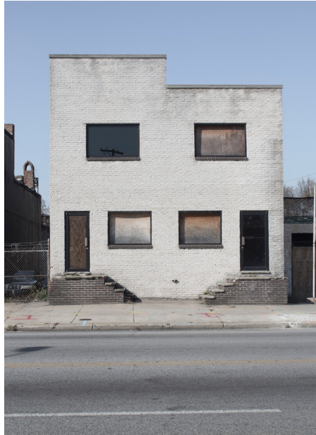
Imagem 5 - Neighbors: A Blessed Burden , 2013