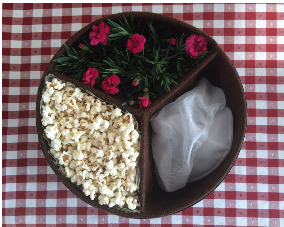
Imagem 41 - Caixa de Roda