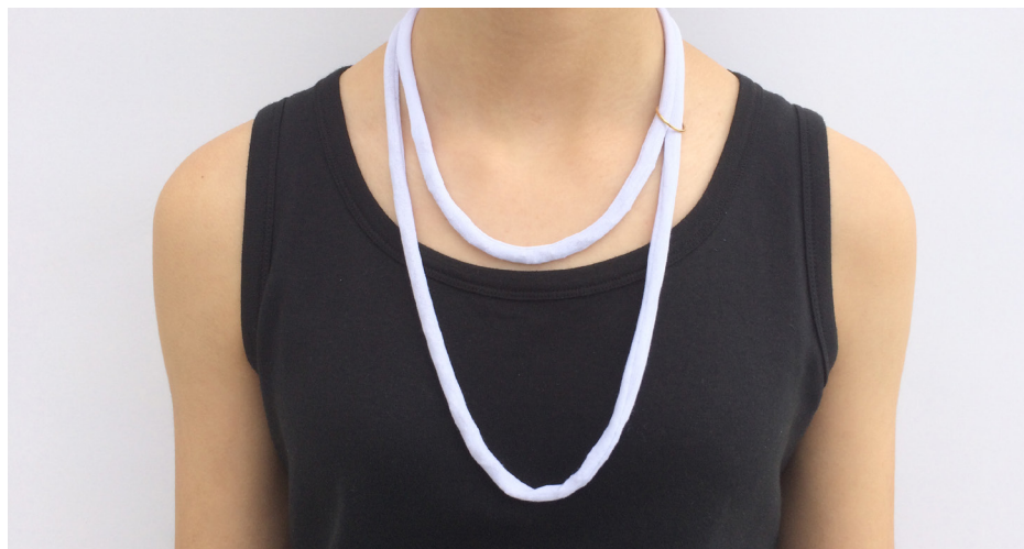
Imagem 36 - Jóia de Família - com cordão de ouro