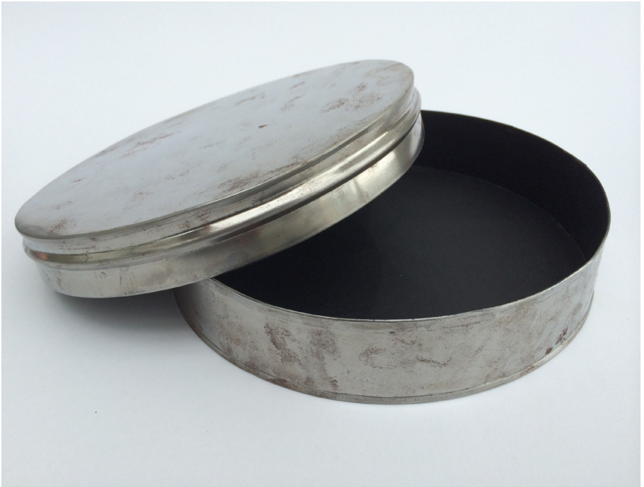
Imagem 38 - Caixa de Roda pintada com tinta de efeito de ardósia