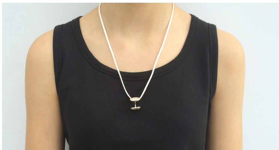
Imagem 35 - Jóia de Família - com botão de punho