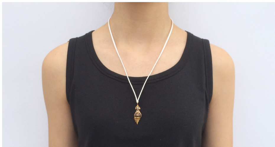
Imagem 32 - Jóia de Família - com brinco de ouro