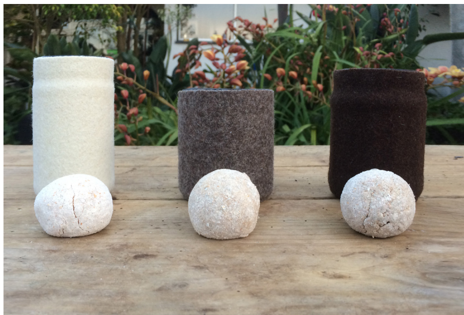
Imagem 30 - Frascos dos diferentes fermentos vivos (cada fermento tem como base um tipo diferente de farinha: trigo, milho e centeio)