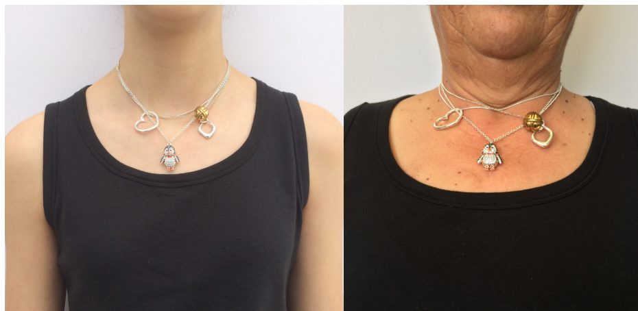
Imagem 18 - Composições

A relevância dada à capacidade de fazer a pessoa sentir que carrega algo de valor para outra pessoa, foi o princípio orientador das soluções desenvolvidas. Acabando por influenciar a escolha de algumas matérias-primas utilizadas.