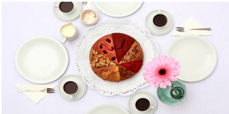
Imagem 3 - DANKLHAMPELs Sundaycake , 2009

O projecto é construído a partir de uma forma para bolo dividida em várias zonas de diferentes dimensões. Cada zona é preenchida com massa e ingredientes da preferência de cada pessoa. No final, cada um poderá desfrutar do seu pedaço de bolo favorito.