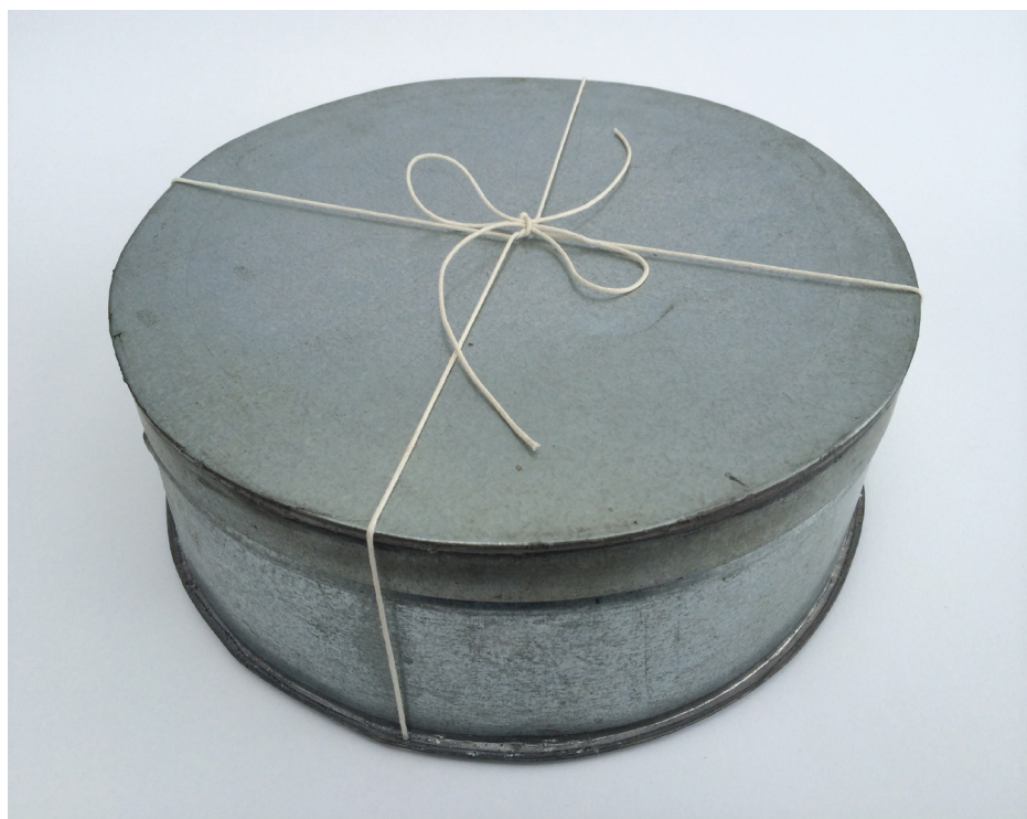
Imagem 40 - Caixa de Roda