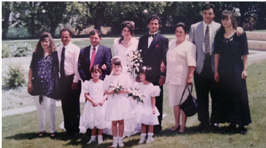
Imagem 7 - Família materna (1995). Nasceram mais 5 crianças após o casamento do meu tio.