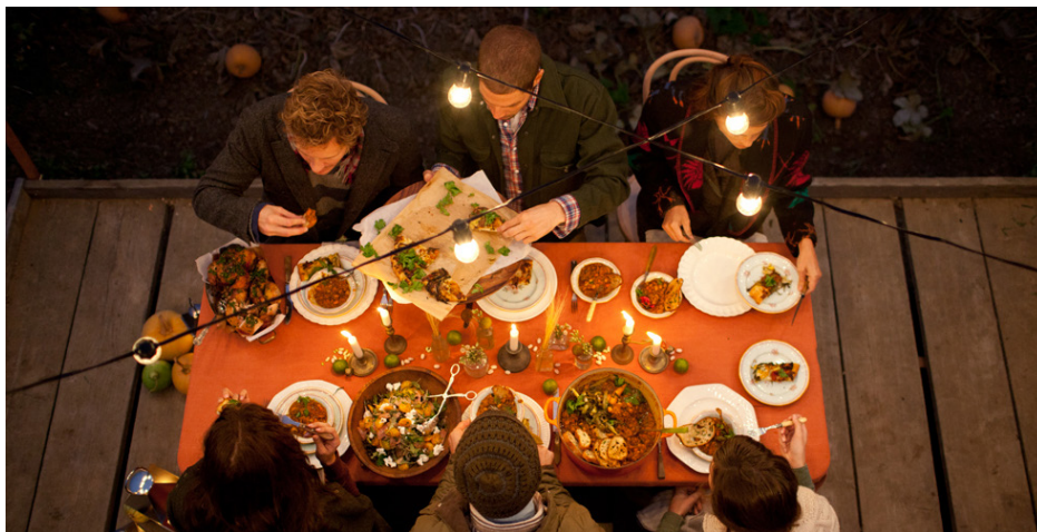
Imagem 6 - Issue 2, 2013

No fundo, Kinfolk trata-se de um possível modelo para um estilo de vida casual, equilibrado, aventureiro e intencional. A Kinfolk propõe momentos de partilha e relacionamentos a partir de ambientes simples.