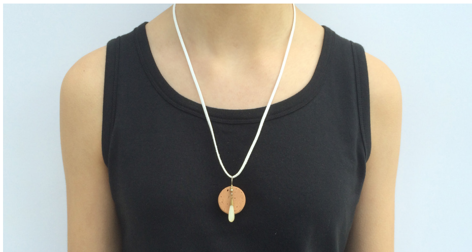
Imagem 31 - Jóia de Família - com brinco