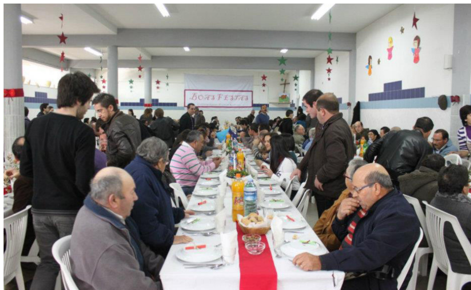
Imagem 11 - Almoço convívio de Natal , 2011