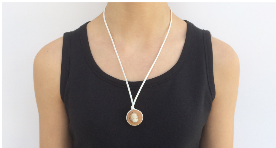
Imagem 33 - Jóia de Família - com brinco