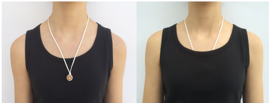
Imagem 21 - Jóis de Família - com peça de um brinco danificado

para a evolução da linha de Jóis de Família, a introdução de pequenas peças de todo o tipo de objectos que pertençam, ou tenham pertencido, a alguém de quem se gosta.