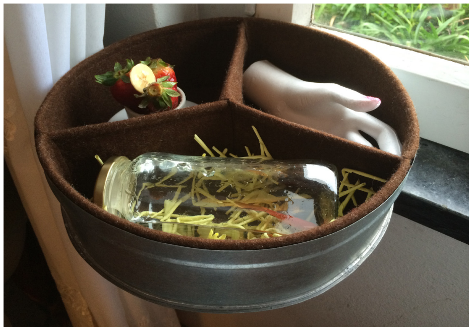
Imagem 25 - Caixa de Roda (Luciana para Ana)