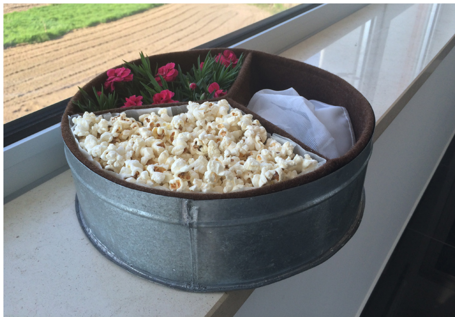
Imagem 24 - Caixa de Roda (Cristiana para Luciana)