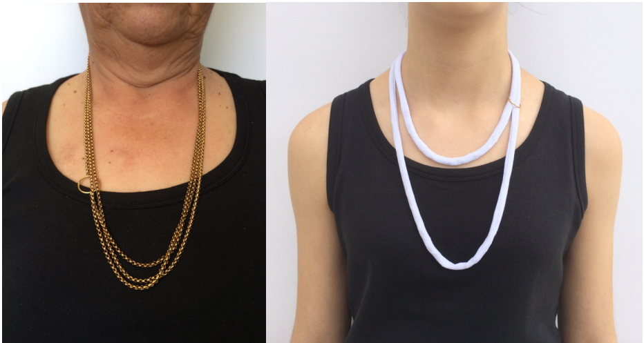
Imagem 20 - Jóia de Família - com cordão de ouro

Em simultâneo, surgiu a ideia de criar um suporte que agarrasse vários fios de várias pessoas ao mesmo tempo. Contudo, pareceu ser uma hipótese frágil de progredir porque não acrescentava nada às composições anteriormente mencionadas, passando-se a desenvolver um suporte em tecido que permitisse colocar no seu interior um fio de valor sentimental, como sendo uma relíquia. Permitindo que a pessoa possa sentir o peso do fio e os seus contornos.