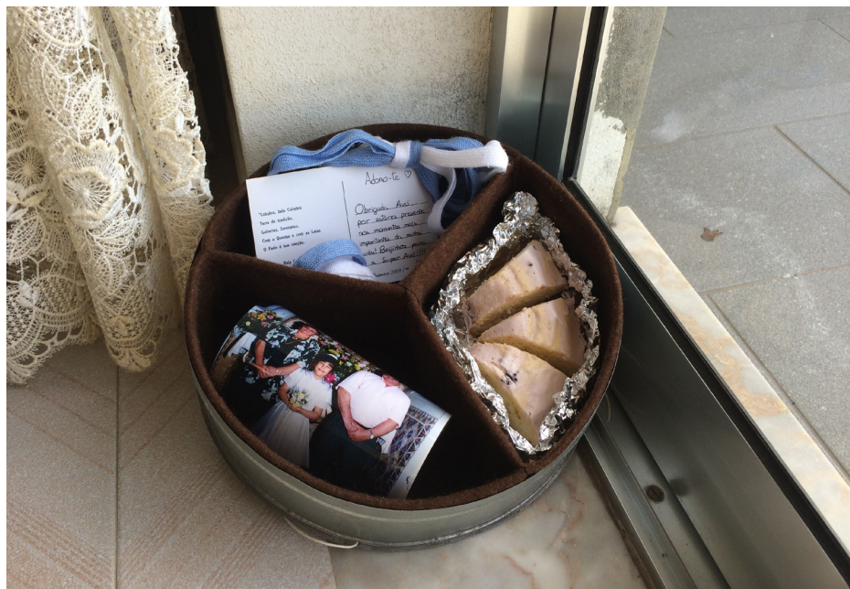
Imagem 27 - Caixa de Roda (Dina para Avó Maria)