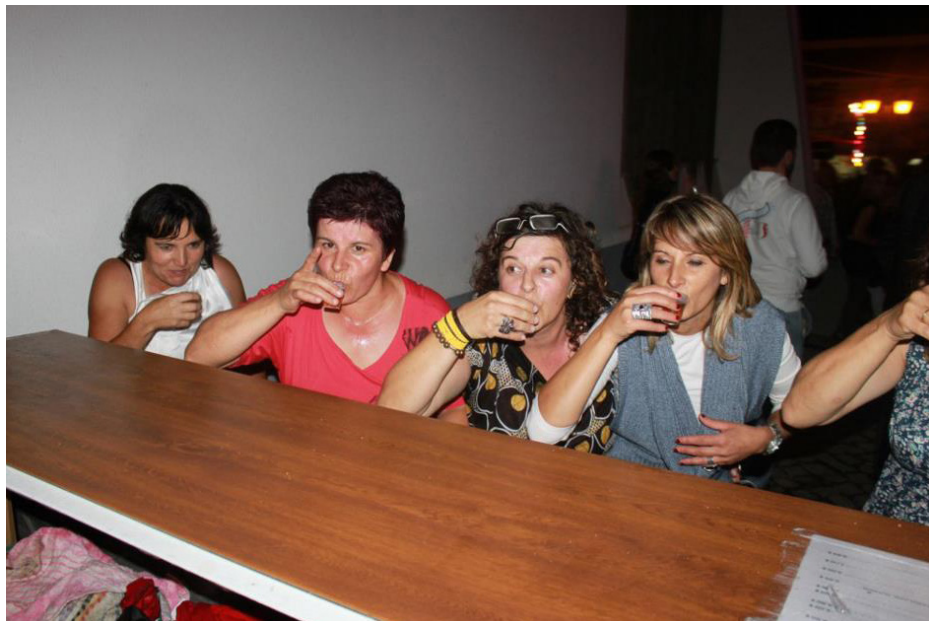
Imagem 13 - Festas Moita da Roda, 2011

Estes momentos são propostos por grupos de pessoas que se disponibilizam voluntariamente, durante um período de tempo, para assumir determinados papéis na comunidade. Dado ao espírito de entreaajuda vivido, estes grupos por norma podem contar com o voluntariado espontâneo, principalmente em dias festivos que são mais exigentes. No entanto, dada à emigração, às dificuldades financeiras que as famílias atravessam e à falta de esperança por um futuro melhor, as pessoas têm vindo a perder aos poucos o interesse em trabalhar pela comunidade.