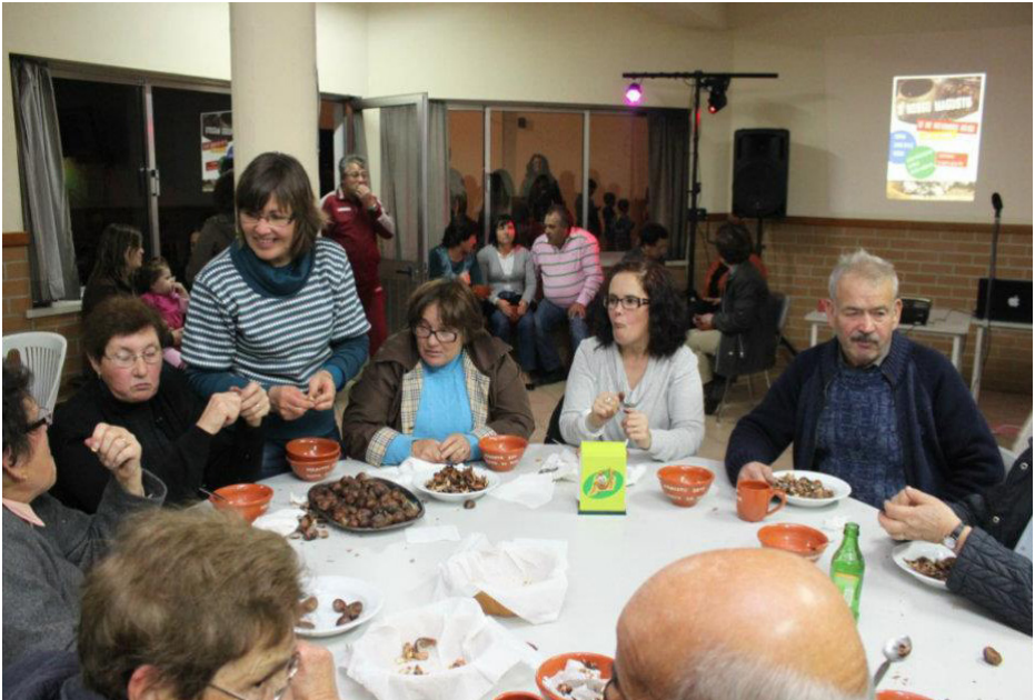
Imagem 12 - Magusto, 2012

De forma a manter o convívio entre pessoas de diferentes idades, a população, que faz parte da organização dos eventos, demonstra normalmente ter preocupação em moldar esses momentos para que se tornem atractivos para todos. Por exemplo: aquilo a que chamamos de castanhada, conhecido por magusto, tem vindo a adaptar-se às novas exigências. Actualmente durante a realização deste momento tradicional, para além de castanhas e água-pé, marcam igualmente presença, as sopas, o café, os doces, os jogos tradicionais, o karaoke e o Dj.