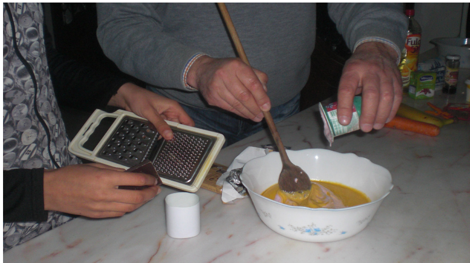
Imagem 14 - Experiências com vários tipos de massa

Começou-se por fazer misturas dos pedaços de massa de broa e de pão (fermento biológico) com uma base de bolo. Em que posteriormente foi adicionado, por cada membro da minha família nuclear, ingredientes do seu agrado. É de salientar que tanto nesta primeira fase como nas fases seguintes, antes de adicionar os ingredientes do agrado das pessoas é retirado sempre um pedaço de massa já levedada. Este processo chama-se “renovar o fermento” e permite que seja utilizado o pedaço de massa numa próxima fornada como fermento vivo.