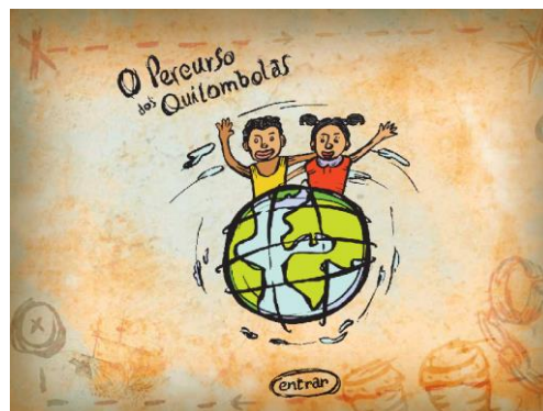
Figura 1: Ecrã de Entrada do Tutorial Multimédia desenvolvido.

As secções seguintes procuram descrever a fase de desenho (planeamento) dos materiais pedagógicos, procurando-se ilustrar o resultado obtido com imagens retiradas dos materiais pedagógicos desenvolvidos posteriormente (fig. 1).