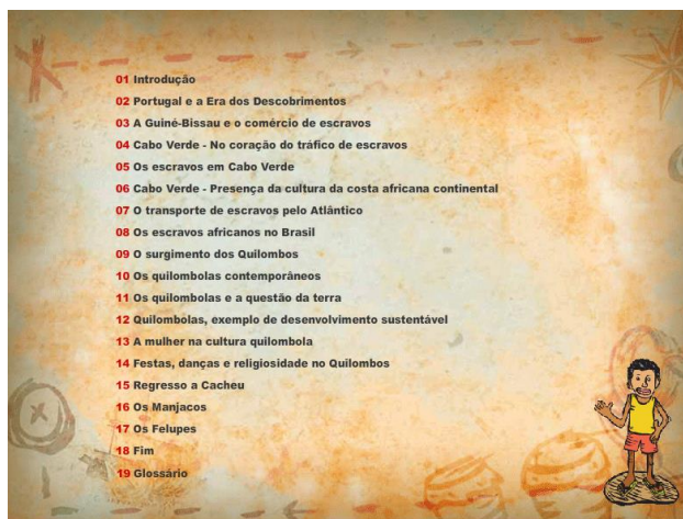
Figura 2: Índice do Tutorial Multimédia

Os tutoriais procuram orientar o aluno no uso inicial da informação, apresentando-a de forma fragmentada, em parcelas relacionadas, oferecendo geralmente uma estrutura linear para percorrer estes fragmentos (Alessi & Trollip, 2001).