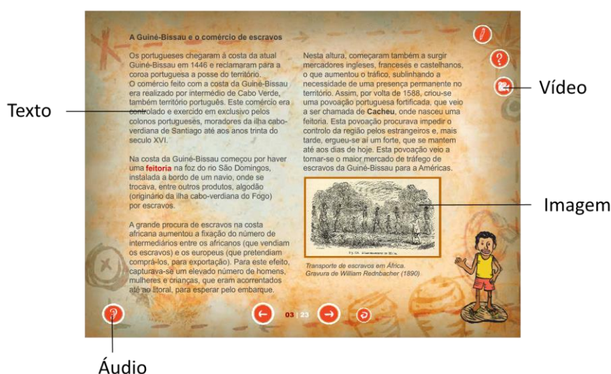
Figura 3: Layout típico de um capítulo.

A figura 3 mostra o layout típico de um capítulo. O elemento-base da informação era o texto, adaptado de um documento produzido pelo projeto, “ Diálogos Interculturais ” (IMVF, 2011). O aluno tem a possibilidade de ouvir o texto, clicando no ícone “Áudio” onde uma voz brasileira narra o texto do capítulo. A acompanhar o texto estão as imagens (geralmente ilustrações de livros, pinturas artísticas e fotos de quilombolas contemporâneos) e vídeos. Os vídeos incluídos nos capítulos são excertos de documentários produzidos pelas ONG brasileiras e guineenses no âmbito deste projeto e são geralmente entrevistas feitas a quilombolas brasileiros e a algumas etnias guineenses das quais esses quilombolas são descendentes (Felupes e Manjacos) existindo também excertos de manifestações culturais (danças, instrumentos musicais, etc.).