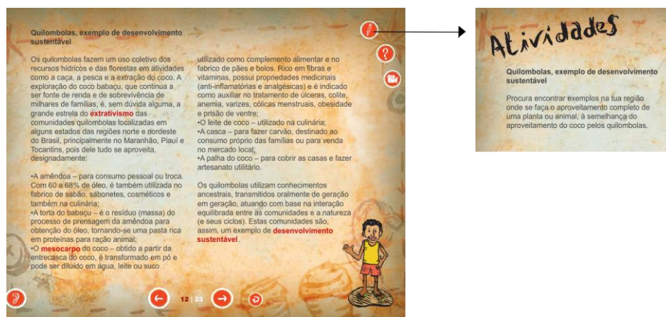
Figura 4: Acesso às Atividades de um Capítulo.

dia propor ao aluno que executasse antes de se passar ao capítulo seguinte. A figura 4 mostra a atividade ligada ao capítulo de desenvolvimento sustentável que propõe que o aluno procure no seu país/região um exemplo de aproveitamento completo de uma planta ou animal, à semelhança do aproveitamento do coco pelos quilombolas (onde é aproveitada a amêndoa, o mesocarpo, o leite, a casca e a palha).