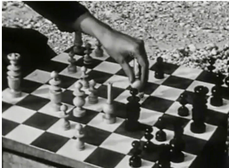
Fotograma de At Land , Maya Deren (1944)

condutor desta sequência é o movimento da personagem, mas, no caso da sequência de sonho, quero que os planos sejam mais abstratos, e incluam menos a minha personagem principal, muitos deles sendo mesmo planos estáticos de objetos imóveis, o que pode não resultar como pretendido. O plano em que as duas mulheres jogam xadrez (um dos símbolos da lista acima) na praia também foi uma grande referência para esse uso simbólico em questão. Para além de resultar num dos meus planos favoritos do filme, misturando várias simbologias, fez simplesmente sentido para mim assim que o vi: quis de alguma forma apropriar-me dele, criar a minha própria versão dele, na esperança de que surtisse este efeito nos meus próprios espectadores.