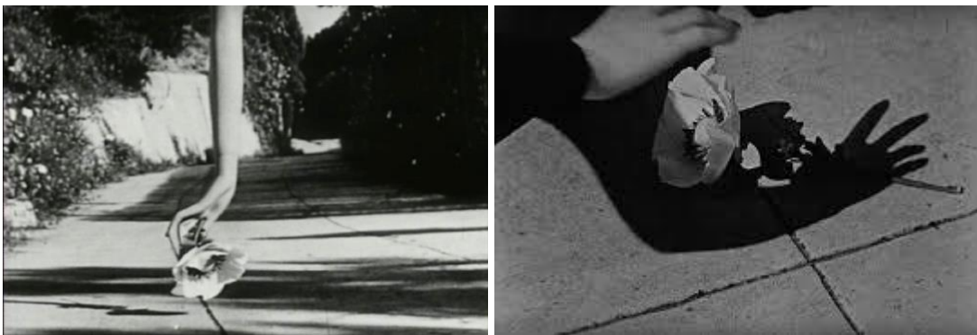
Fotogramas de Meshes of the Afternoon , Maya Deren (1943)

Outra grande inspiração para o uso da simbologia da sombra foi o trabalho das sombras feito em Meshes of the Afternoon de Maya Deren. E, comparando ambos os filmes, um que remarca um objeto, e outro, uma ação/narrativa, a força que a repetição tem, com perspectivas diferentes a cada vez que se repete (em ambos os exemplos), também é um fator marcante a ser levado para o meu próprio filme.