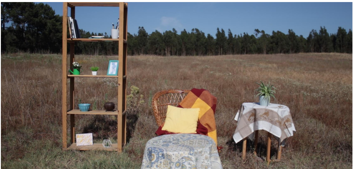
Versão final do cenário da secção Café, de Tempestade Criativa