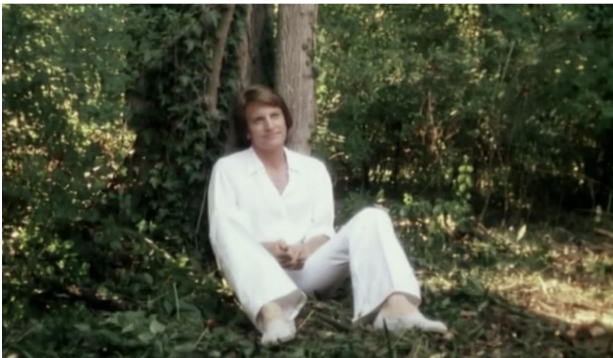
Fotograma de Alice Ou La Dernière Fugue , de Claude Chabrol (1977)

forma de interagir, e como a sua figura se recorta evidentemente da floresta foram claras influências para o meu filme.