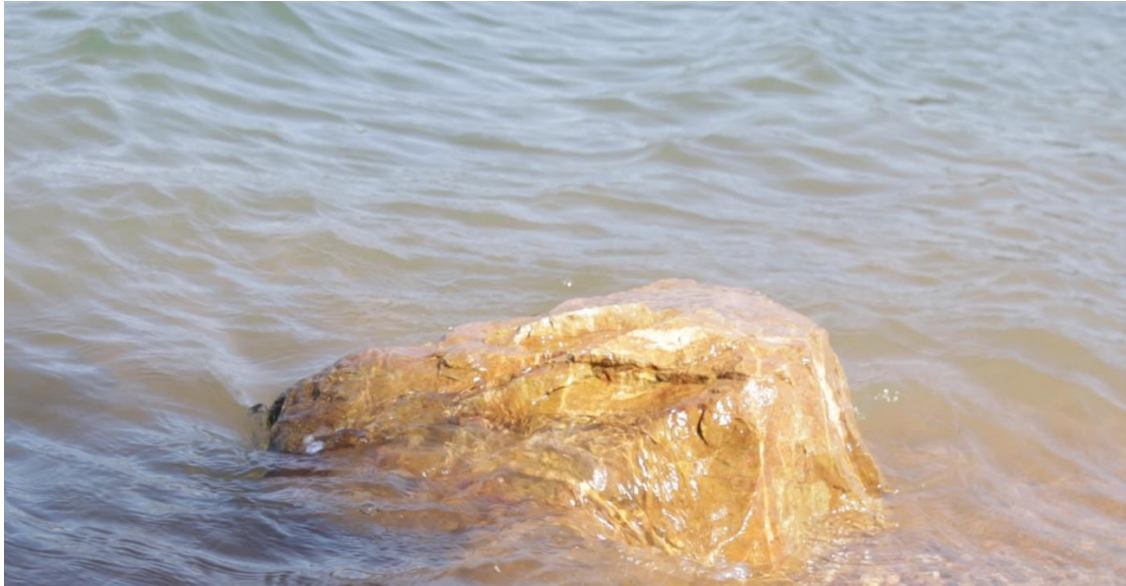
Stillframe de Tempestade Criativa, ilustrativo do plano que se repete, juntando os símbolos água e pedra