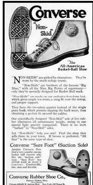
Imagem 5 | Converse All stars