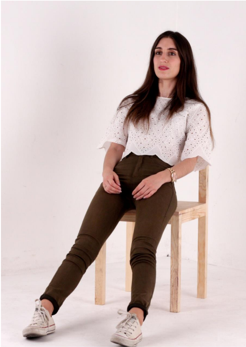
Imagem 23 | Cadeira Longa | Foto de ensaio