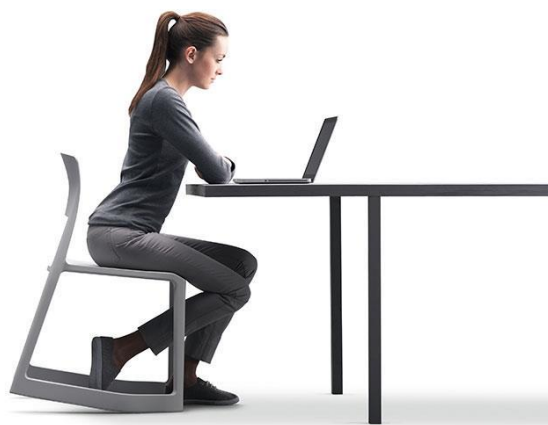
Imagem 47 | Tip Ton - Edward Barber & Jay Osgerby, 2011