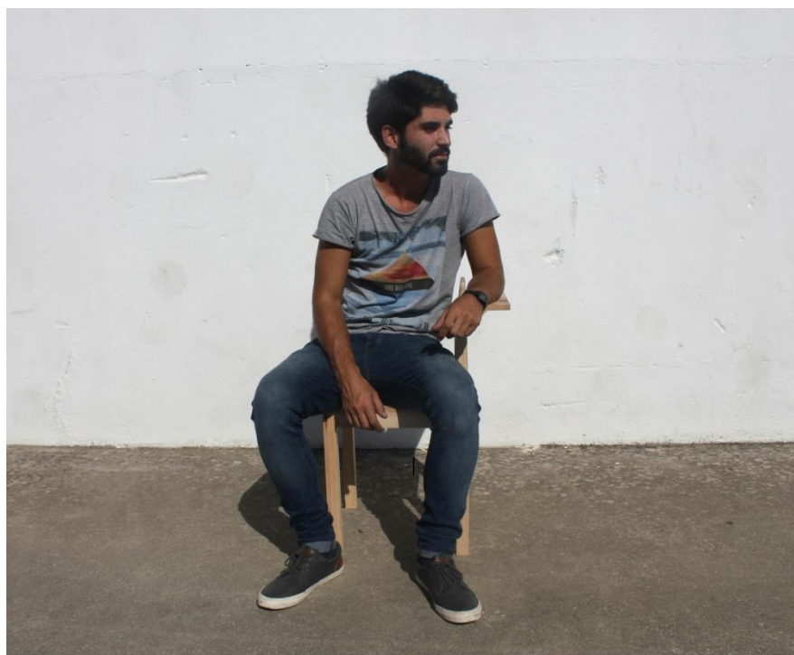
Imagem 16 | Cadeira Apoio |