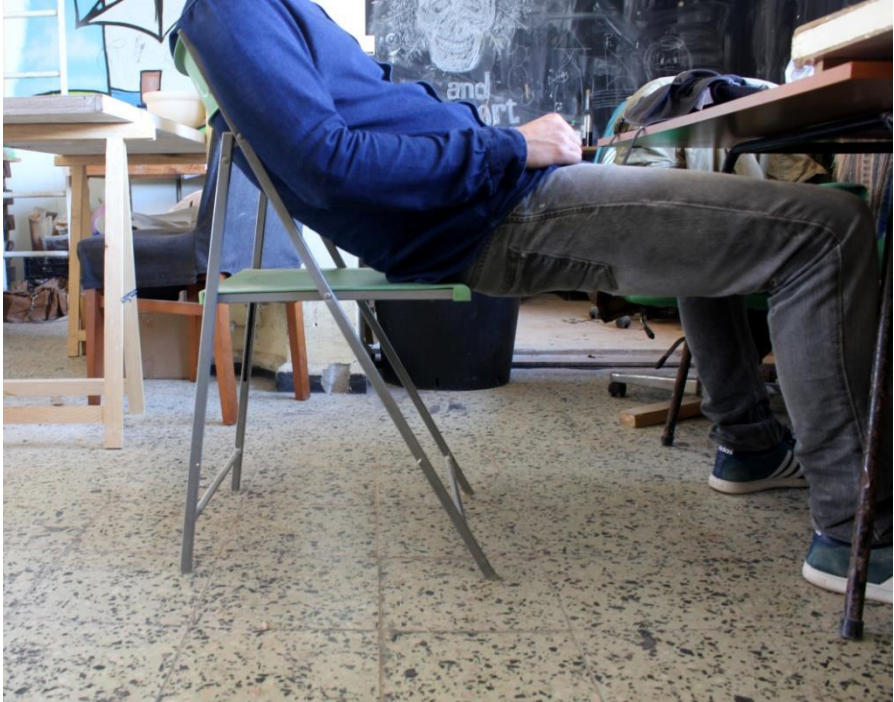
Imagem 25 | Cadeira Longa | Foto de apropriação de uma cadeira