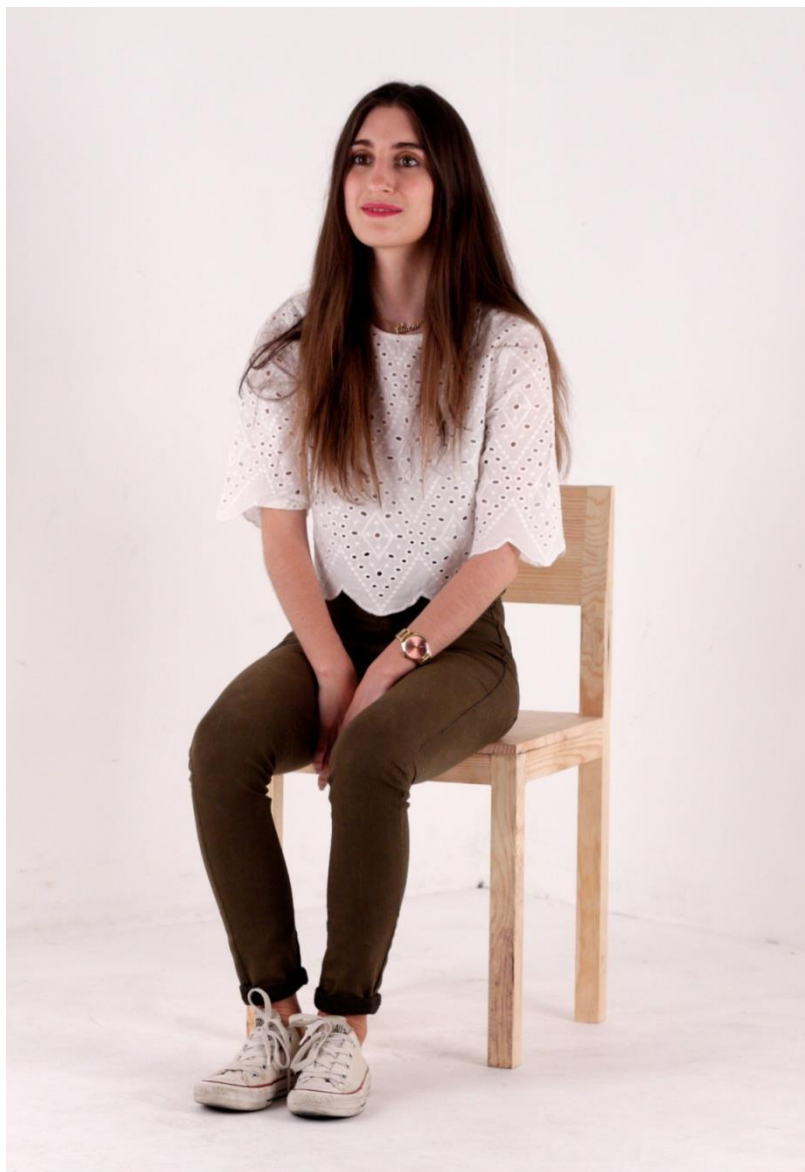
Imagem 40 | Cadeira Curta | Foto de ensaio