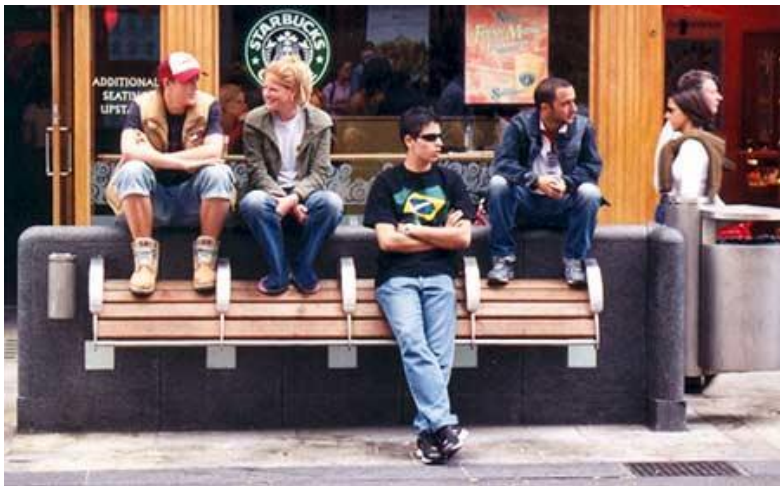
Imagem 64 | People sitting on top of bench, London

Este sentar nas costas da cadeira é mais notória em espaços públicos com um grande número de pessoas, onde o utilizador para estar ao nível das pessoas que estão em pé sobe mais um patamar na cadeira.