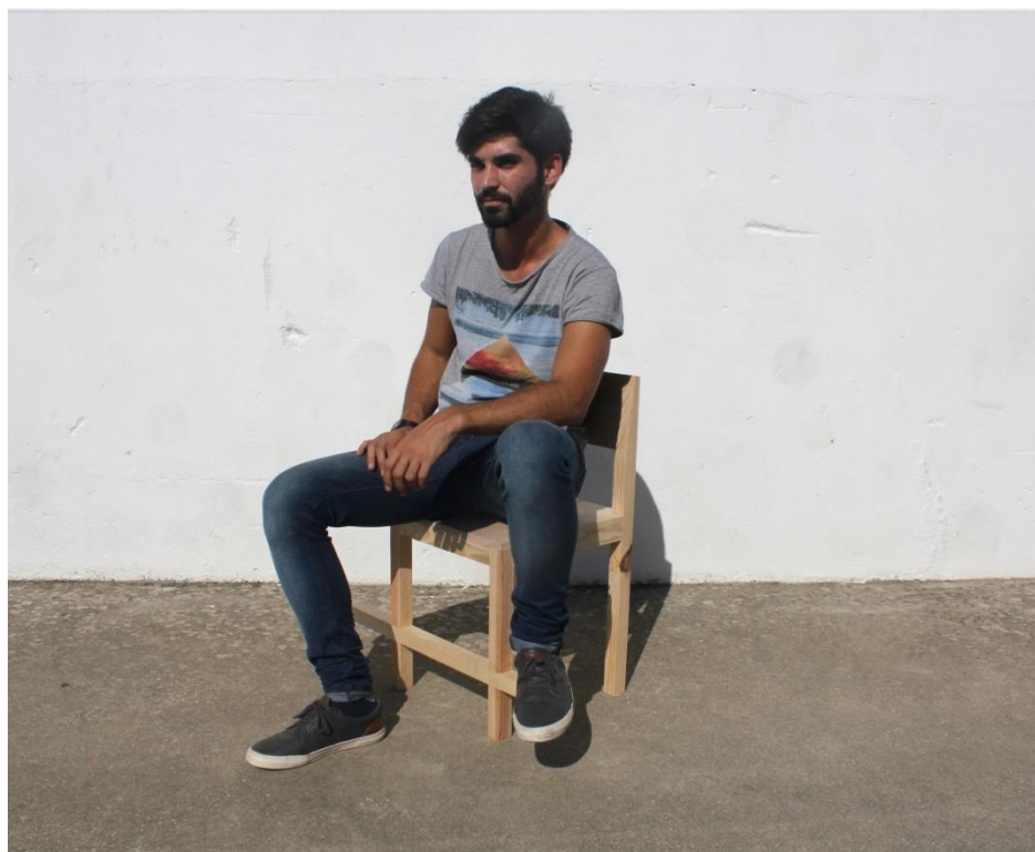
Imagem 10 | Cadeira Estribo em contexto de uso