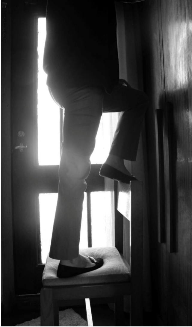
Imagem 41 | Foto de apropriação de uma cadeira | Porto, 2017