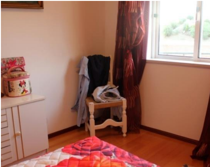
Imagem 36 | Quarto dos meus pais, 2017

Como a Valet Chair , cadeira dos anos 50 com os seus elementos que permitiam pendurar cada peça de um fato de homem, esta “suposta cadeira” não tinha como função primária o sentar, mas para servir como um segundo armário mais pequeno e prático para colocar roupa.