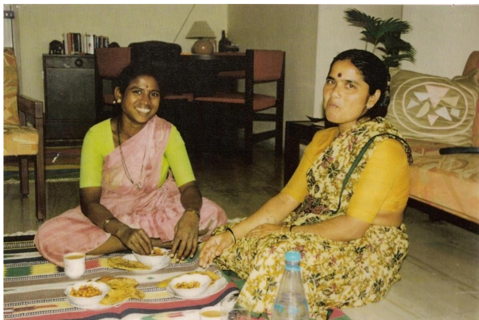
Imagem 3 | Introdução | Indian women eating on the floor

Recorre-se frequentemente a este objeto utilitário para resolver diversas necessidades, como chegar às altas prateleiras da cozinha, pendurar roupa, ou mudar uma lâmpada.