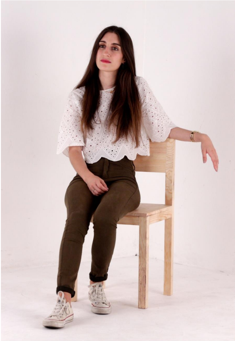
Imagem 17 | Cadeira Apoio | Foto de Ensaio