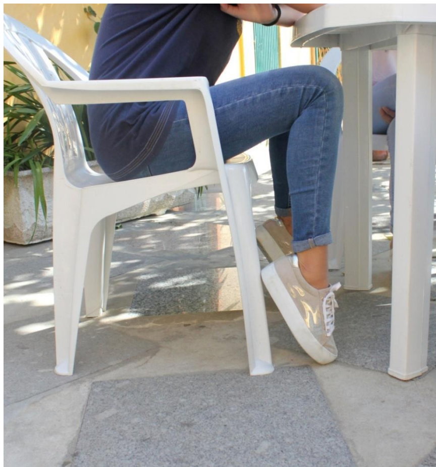
Imagem 14 | Cadeira Estribo | Foto de uma apropriação da cadeira | Porto, 2017