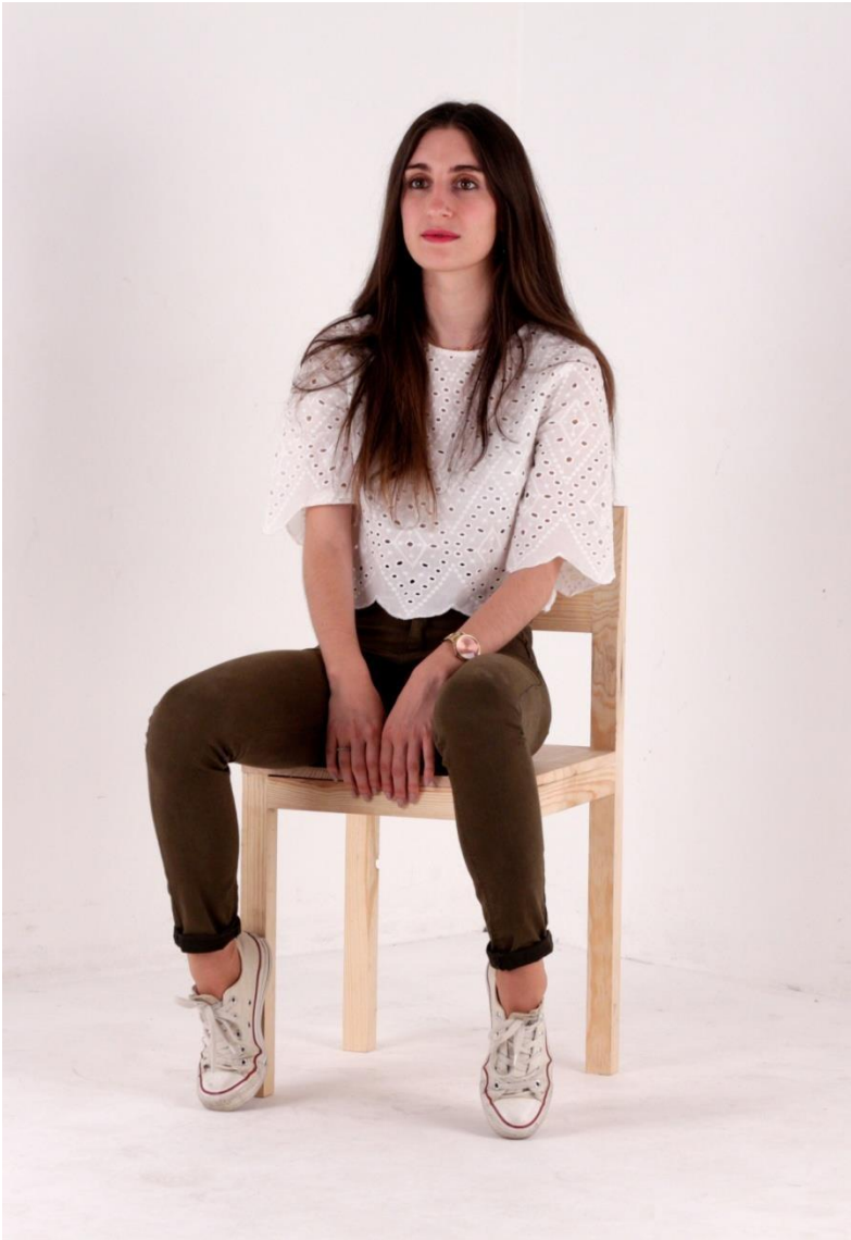
Imagem 11 | Cadeira Estribo | Foto de Ensaio