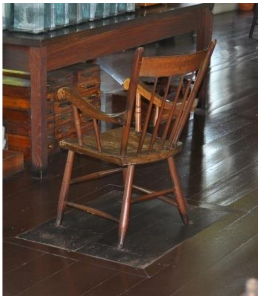
Imagem 31 | Thomas Edison Chair, nailed to the ground

Este é o ponto de partida para a definição desta cadeira. Com o acrescento de um apoio nas pernas de trás, o utilizador passa assim a experienciar uma segunda forma de uso do objeto pois esta permite ficar inclinado para trás, sem cair, numa posição mais cómoda e refletiva, imitando uma postura própria de cadeiras longas.