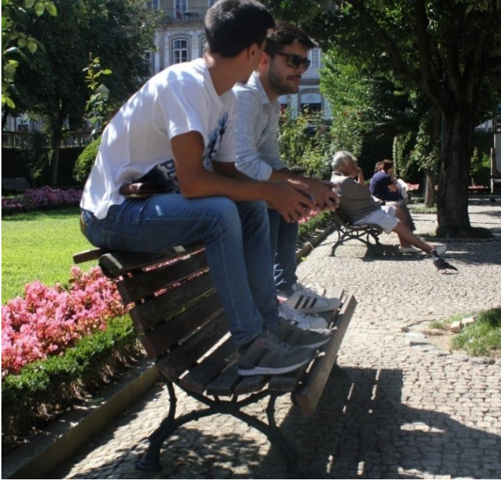
Imagem 65 | Foto de apropriação de uma cadeira Felgueiras, 2017