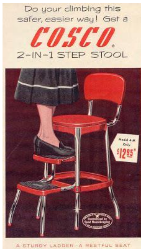
Imagem 61 | Cosco Step Stool, 1951

Com a revolução industrial e a massificação de produtos, o Step Stool da Cosco, serviu esta necessidade comum de chegar facilmente a locais inacessíveis, em qualquer lar americano. Com a sua altura e degraus retráteis.