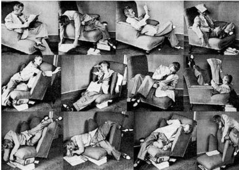
Imagem 6 | Bruno Munari, seeking comfort in an uncomfortable chair.

Podemos tomar como exemplo de descontentamento perante os objetos a experiência de Bruno Munari , ao chegar a casa se depara com a sua incômoda poltrona.