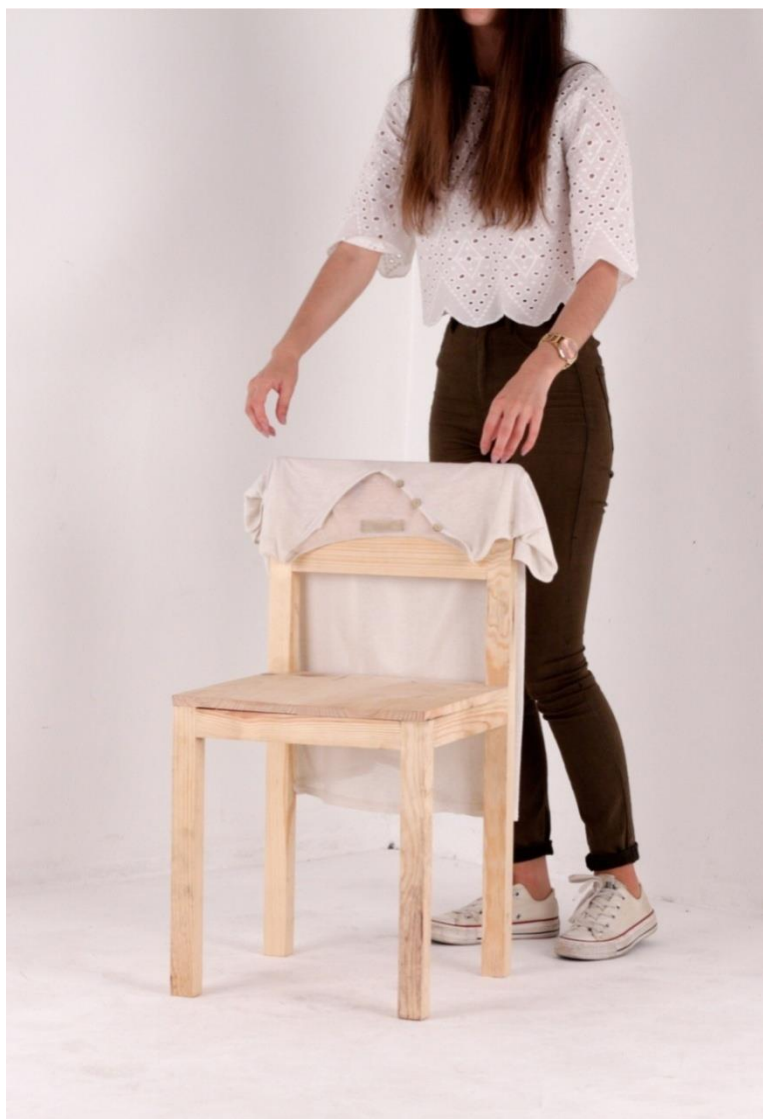
Imagem 35 | Cadeira Cabide, foto de ensaio