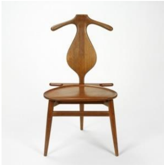
Imagem 37 | Valet Chair - 1953 Hans J. Wegner

Neste desenho podemos refletir sobre os diferentes usos do objeto, em que estes representam uma memória, mas que ganharam outra funcionalidade.