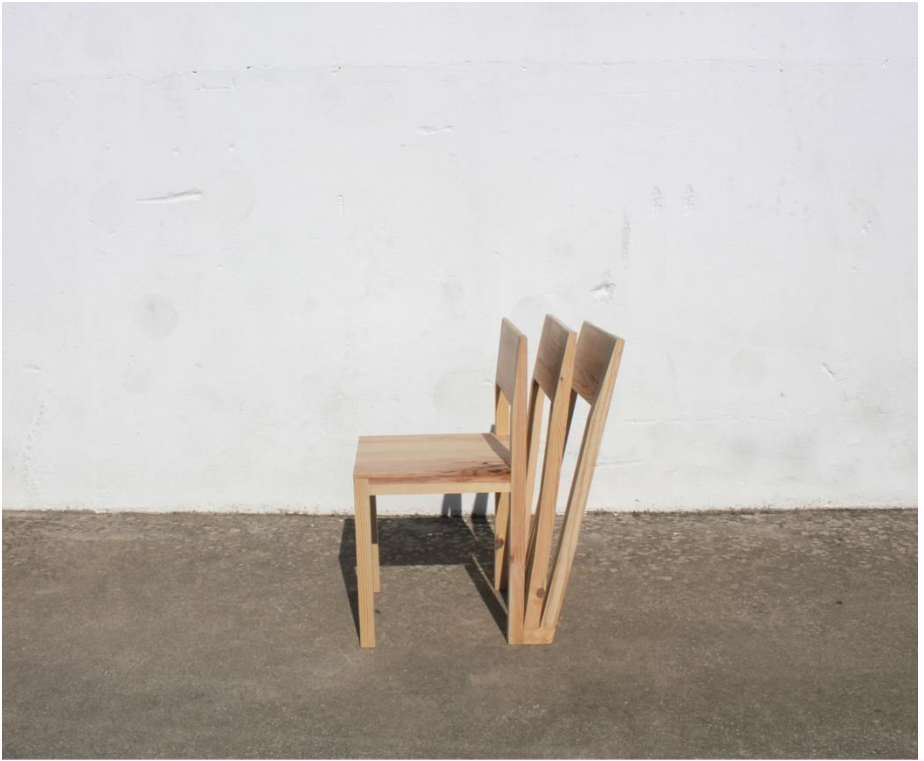
Imagem 33 | Cadeira Cabide |