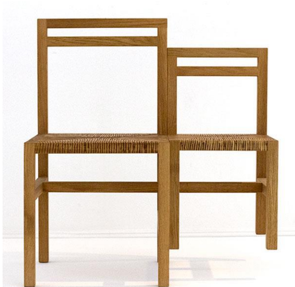
Imagem 52 | Father & Son by Rasmus Baekkel Fex

A cadeira a dois baseia-se na observação da partilha da cadeira, que serve apenas para uma pessoa, mas que é por vezes apropriada por duas em simultâneo.