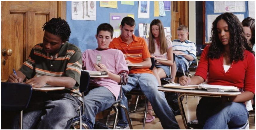
Imagem 25 | Sala de aula, USA