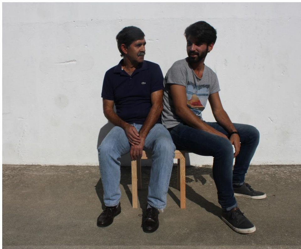
Imagem 50 | Cadeira a Dois em contexto de uso