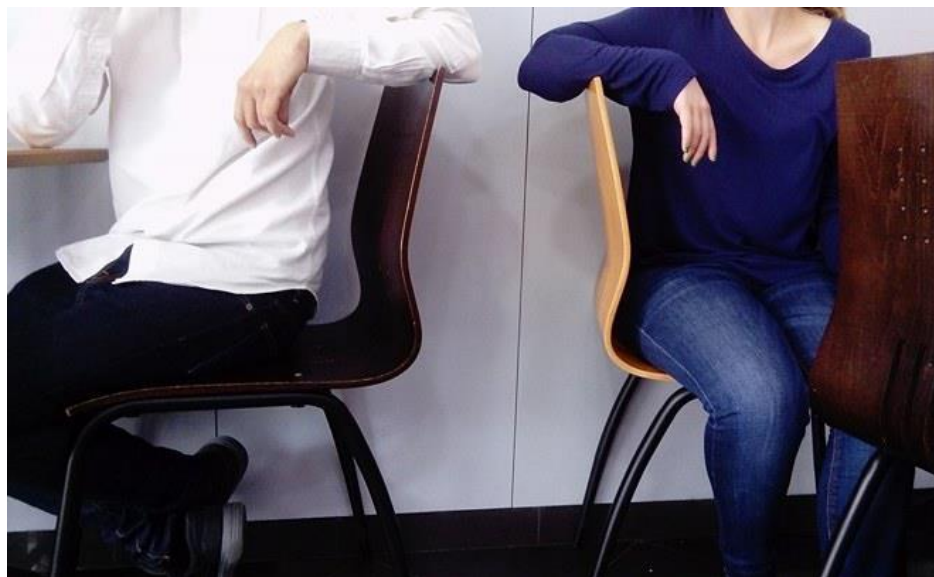
Imagem 20 | Cadeira Apoio | Foto de uma apropriação da cadeira | Porto, 2017