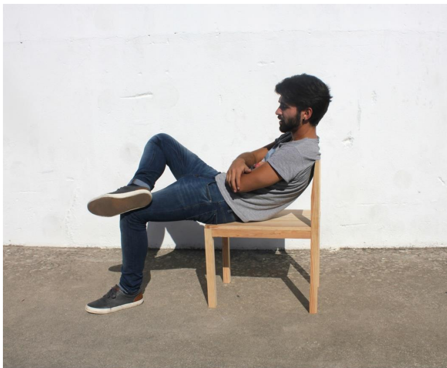
Imagem 22 | Cadeira Longa | Cadeira Longa em contexto de uso