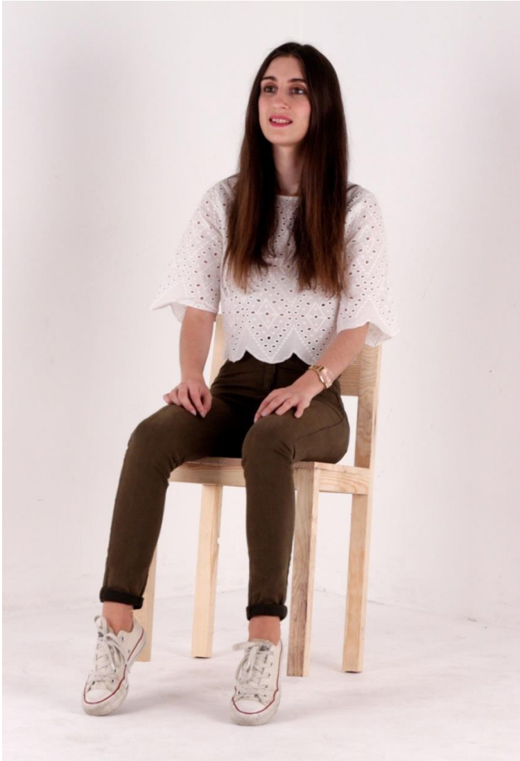
Imagem 28 | Cadeira Inclínada | Foto de ensaio