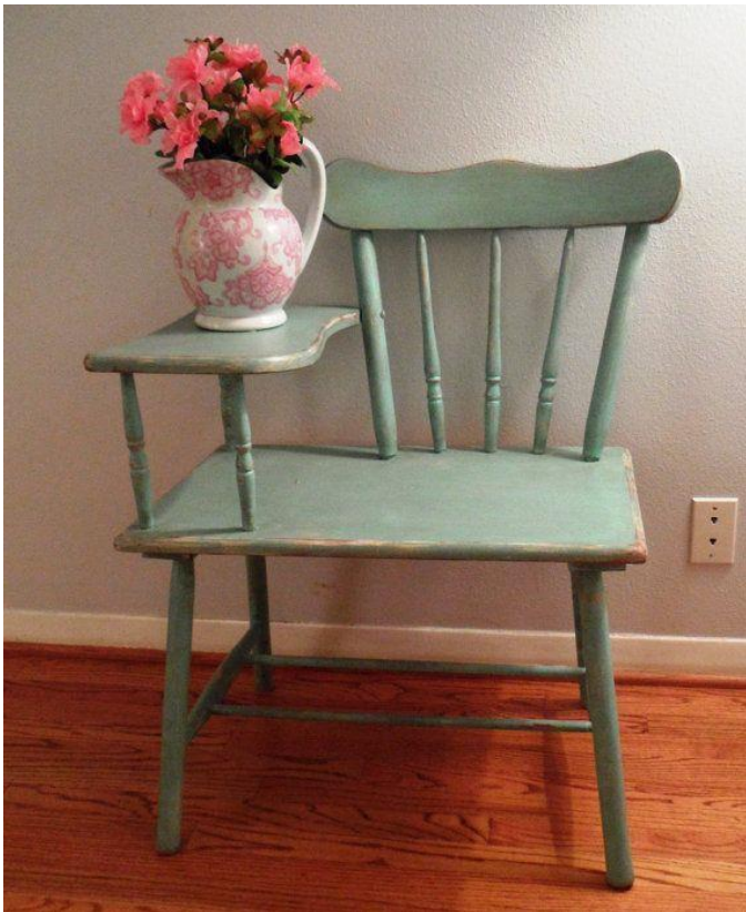
Imagem 19 | Chair with flower Vase

Esta posição de sentar de lado, leva o utilizador a mudar o ponto de vista com que percebe o objeto, alterando a sua forma de uso, tanto no espaço em que se encontram, como em relação aos objetos que o rodeiam, como por exemplo uma mesa.