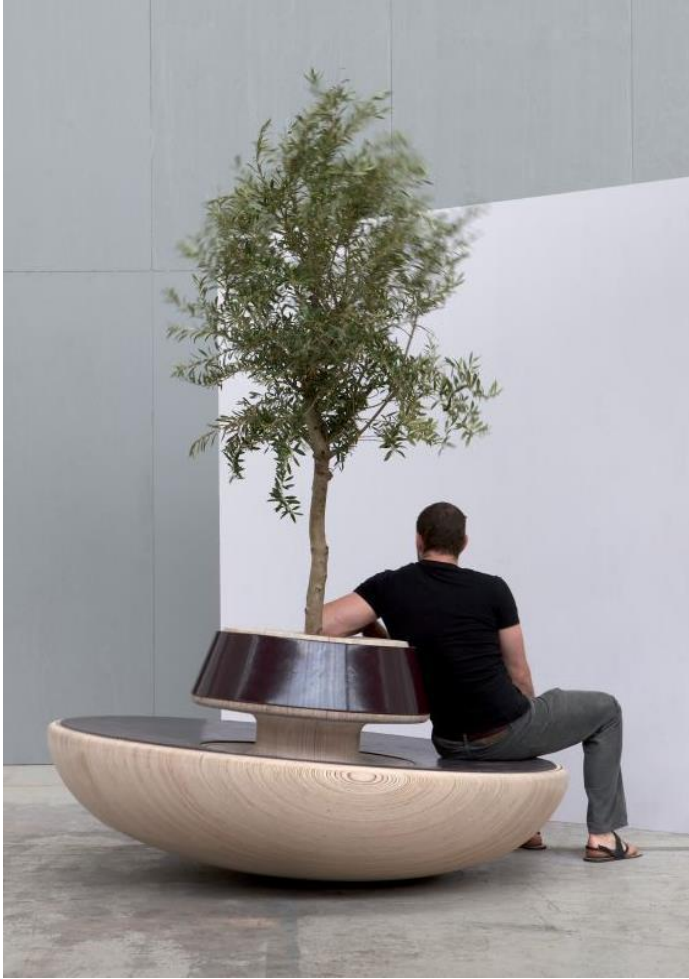
Imagem 54 | Chit-Chat, public bench