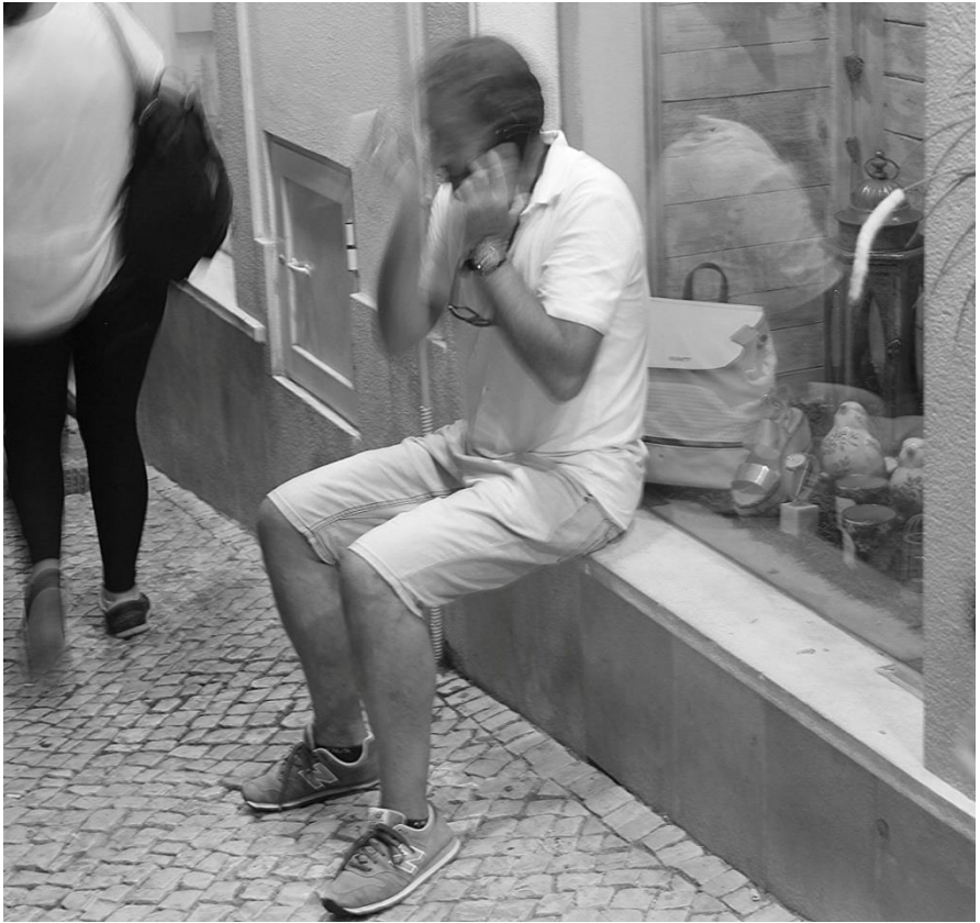
Imagem 41 | Foto de apropriação de uma cadeira | Lagos, 2017