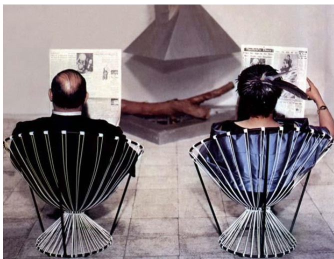
Imagem 7 | Mon Oncle, Jacques Tati, 1958 Scoubidou Chair

Os filmes de Jacques Tati como o “ Mon oncle ” ou “ Playtime ” parodiam também esta problemática.