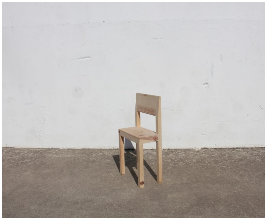
Imagem 38 | Cadeira Curta