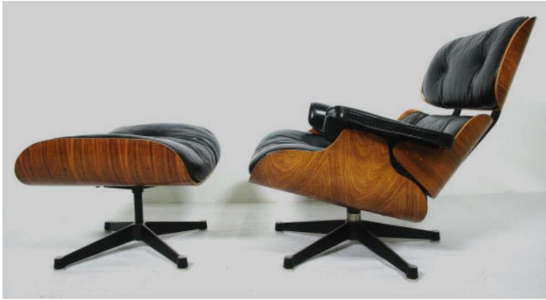
Imagem 24 | Charles & Ray Eames, Lounge Chair 1956