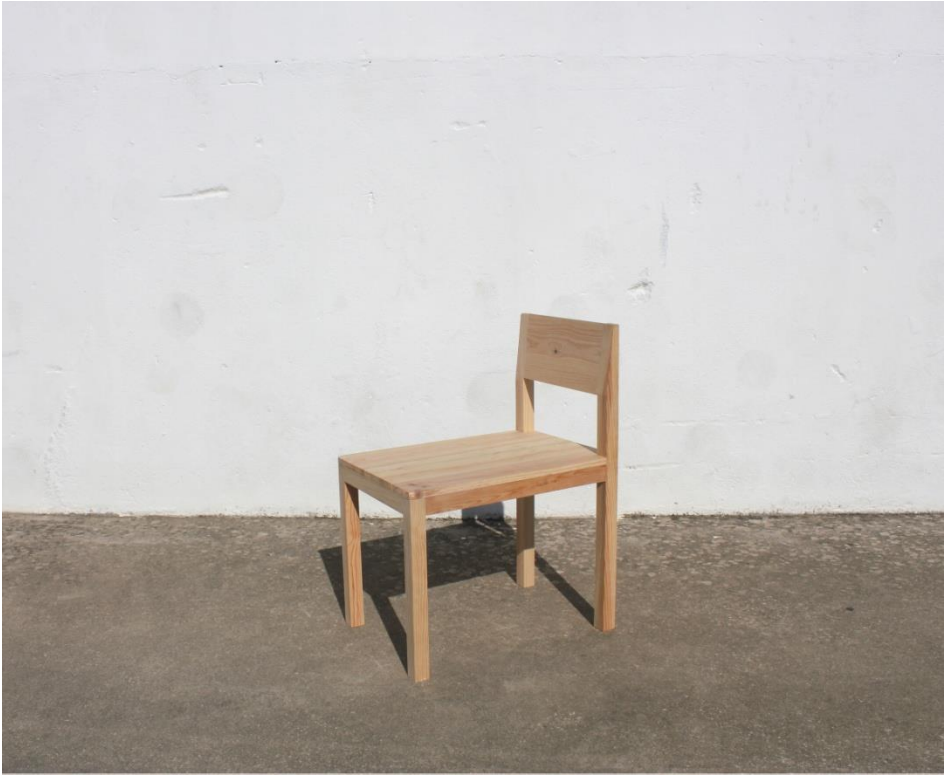
Imagem 21 | Cadeira Longa