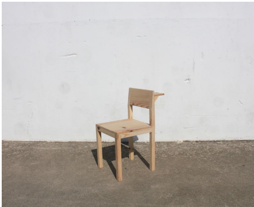
Imagem 15 | Cadeira Apoio |