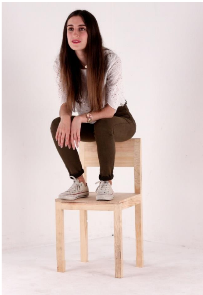
Imagem 58 | Cadeira Escadote | Foto de Ensaio