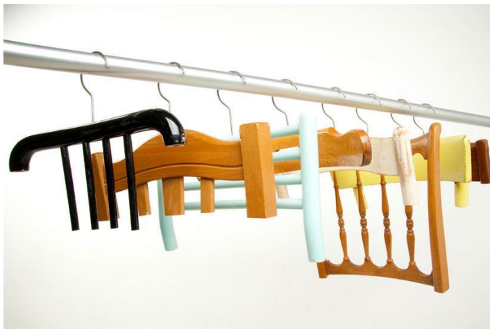
Imagem 38 | Antonello Fusè: abitudini coat hangers for Resign

Nesta observação de um uso comum da cadeira enquanto cabide, imaginou-se um objeto que permitisse então dispor várias peças de roupa em simultâneo, ao longo dos seus três encostos.