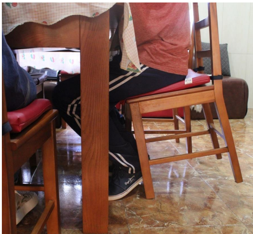
Imagem 48 | Foto de apropriação de uma cadeira Porto, 2017