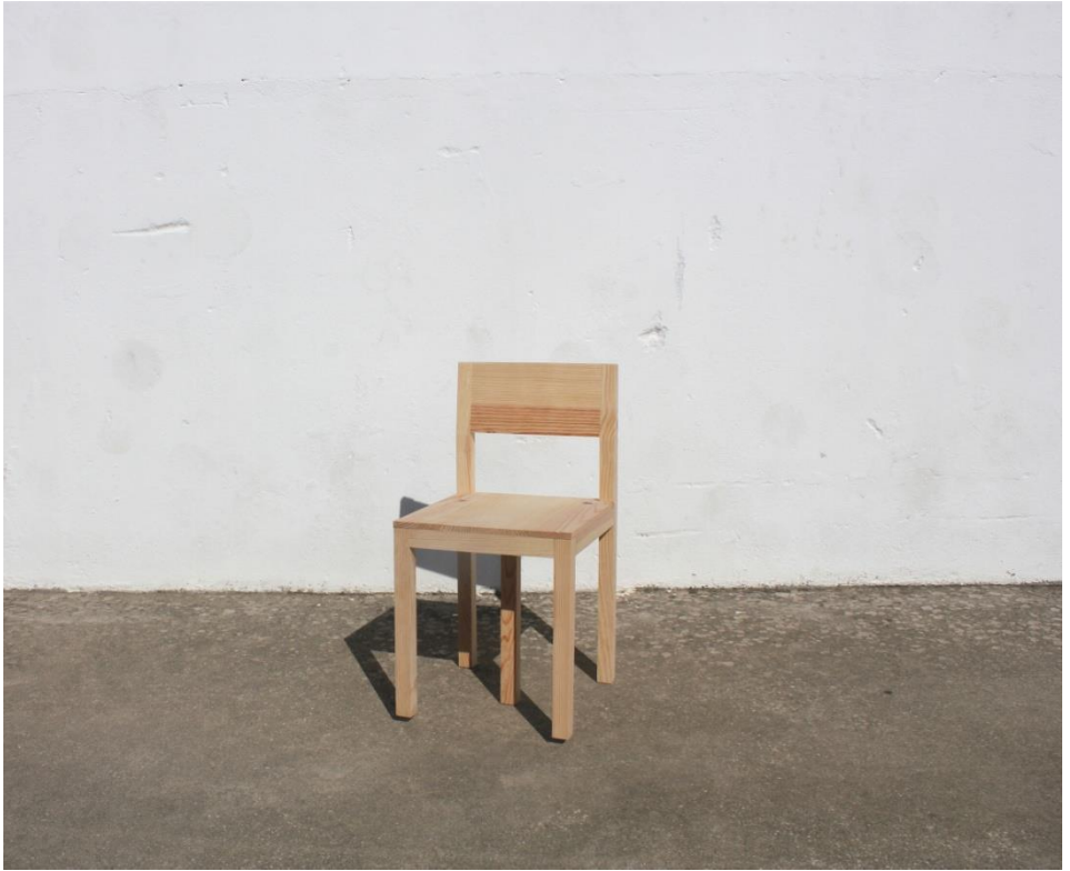
Imagem 43 | Cadeira Inquieta |