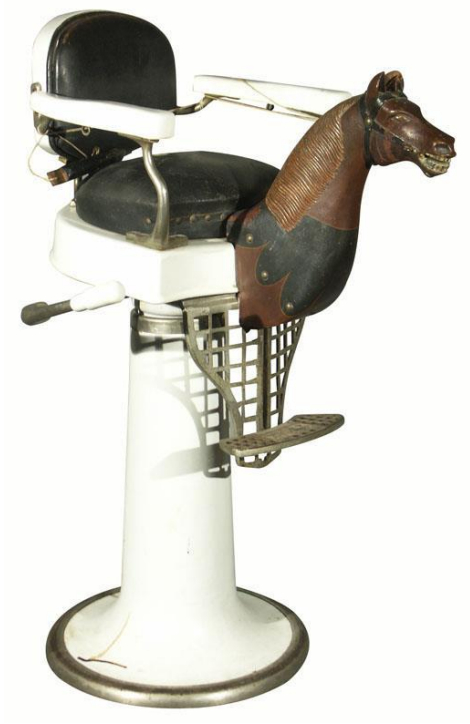
Imagem 12 | Koken Childs Barber Chair,