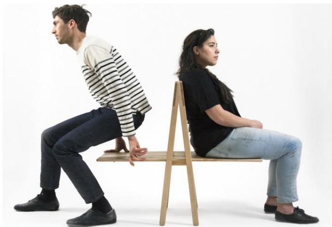
Imagem 53 | RISD – Face to face exhibition

Foi assim desenhada uma cadeira em que o assento foi estendido o suficiente para possibilitar o seu uso por parte de duas pessoas.