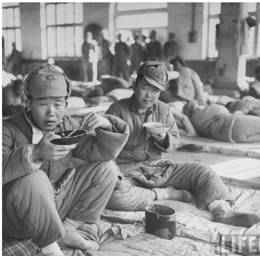
Imagem 2 | Soldados de Yan Xishan's, Guerra Civil, novembro 1948