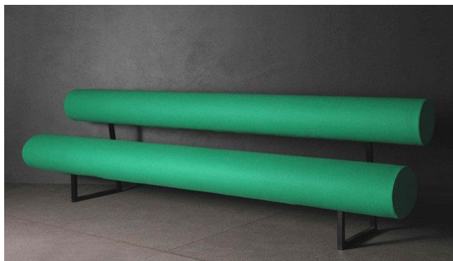
Imagem 8 | Jacques Tati + Jacques Lagrange - Canapé vert de Madame Arpel

Com esta produção de cadeiras para as massas, somos englobados numa generalidade de proporções ditas “normais”, e com esta informação um designer sente-se capaz de projetar uma cadeira.