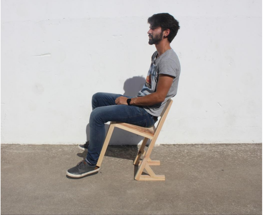
Imagem 27 | Cadeira Inclinada em contexto de uso