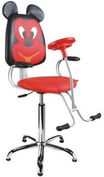
Imagem 13 | Mickey Mouse Barber Chair