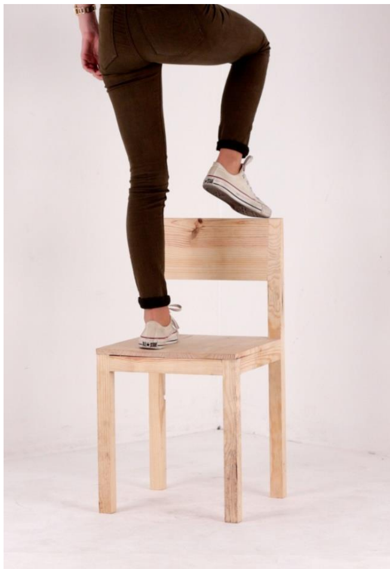
Imagem 57 | Cadeira Escadote | Foto de ensaio