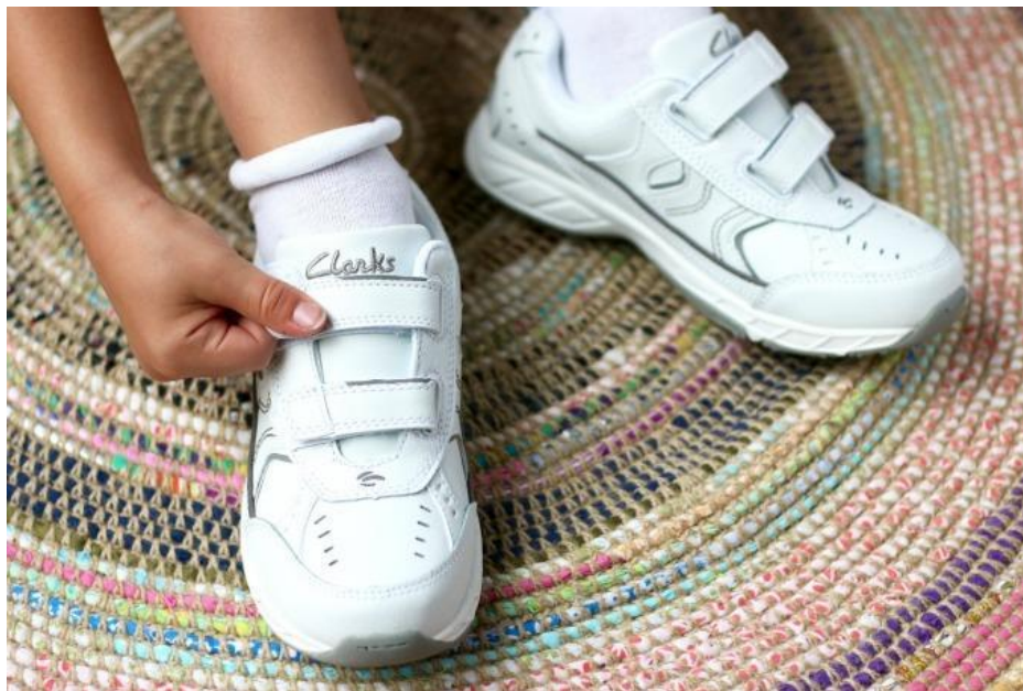
Imagem 1 | Sapatos de Velcro, Clarks

Todos estes objetos realizam a tarefa para a qual foram criados, definindo espaços e hábitos de utilização, que por vezes não se adaptam às necessidades ou dinâmicas específicas de cada utilizador no seu contexto de vida.