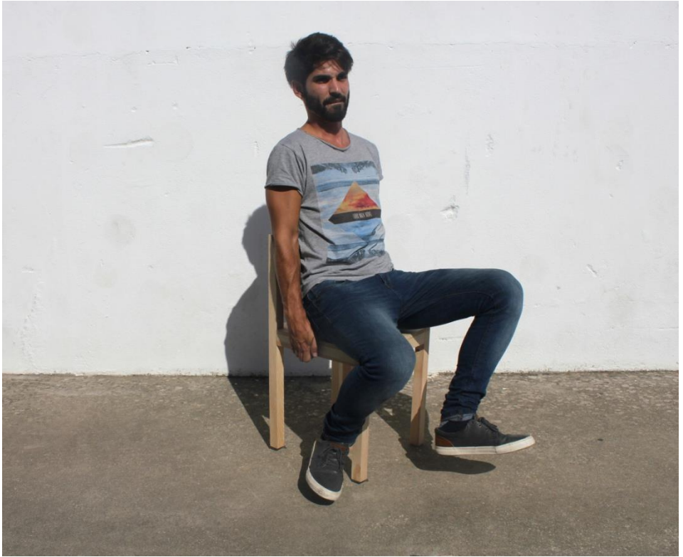
Imagem 44 | Cadeira Inquieta em contexto de uso