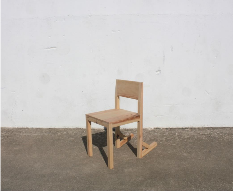
Imagem 26 | Cadeira Inclinada |