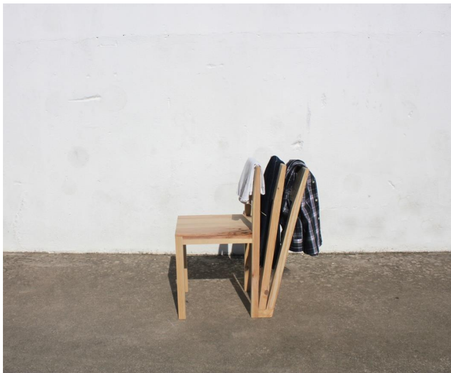
Imagem 34 | Cadeira Cabide em contexto de uso