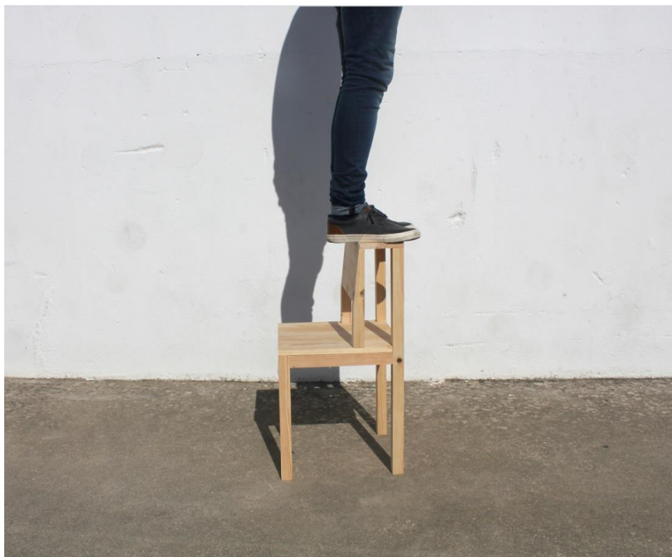
Imagem 56 | Cadeira Escada em contexto de uso