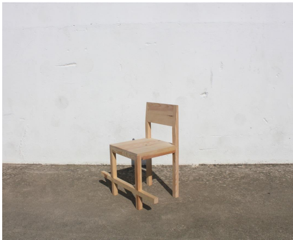
Imagem 9 | Cadeira Estribo