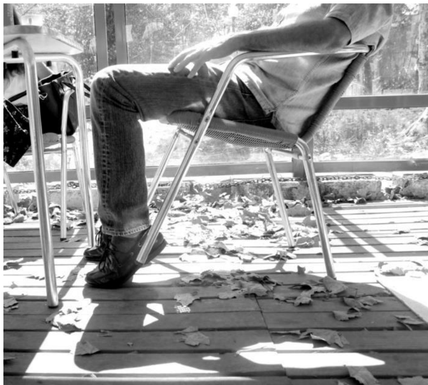
Imagem 32 | Foto de apropriação de uma cadeira, Porto 2017