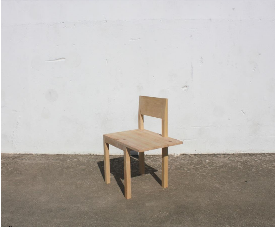
Imagem 49 | Cadeira a Dois |