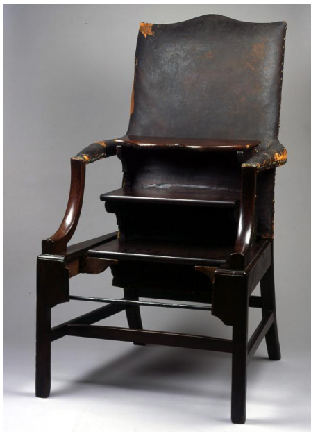
Imagem 59 | Library chair with steps Benjamin Franklyn