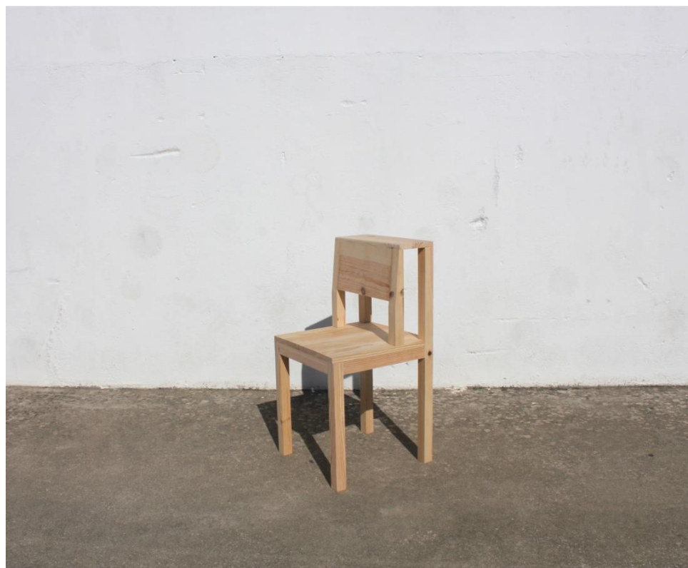
Imagem 55 | Cadeira Escada |