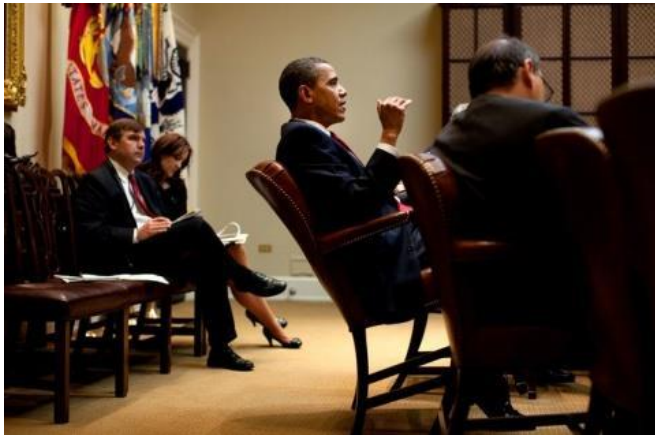
Imagem 30 | The Lean-Back President , Vanity fair Hive , abril 2013

Ao adaptar o objeto à sua vontade, como podemos ver nas imagens, o utilizador procura uma dimensão de uso que ultrapassa o campo de ação para o qual este foi concebido.