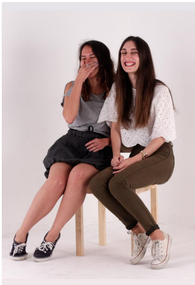
Imagem 51 | Cadeira a Dois | Foto de ensaio