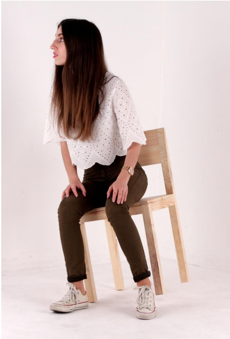
Imagem 45 | Cadeira Inquieta | Foto de ensaio