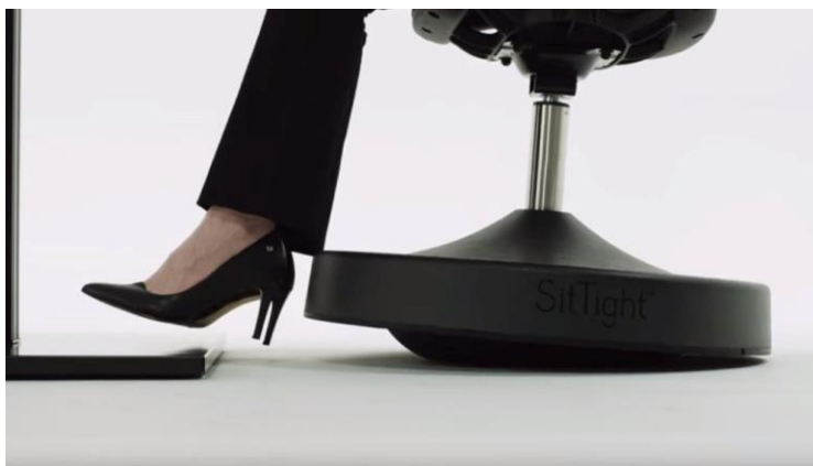
Imagem 46 | SitTightchair, cadeira de escritório que permite o movimento