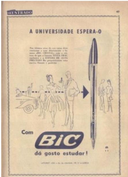
Imagem 4 | Ilustração publicitária da caneta BIC

basquetebol e ao longo dos anos foram apropriadas por grande parte do mundo.