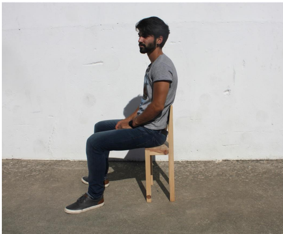
Imagem 39 | Cadeira Curta em contexto de uso