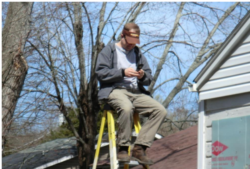
Imagem 62 | Man sitting on top of ladder

Ao observar esta duplicidade de uso, em que a cadeira serve de escada, podemos relatar o uso oposto, em que um escadote é usado também para sentar.