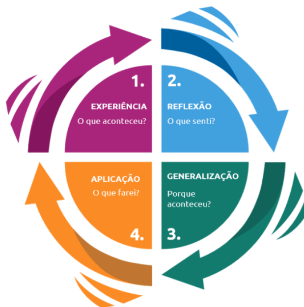
Figura 2 – Representação do Ciclo de Aprendizagem de Kolb (1984)

Nota. Imagem retirada do documento Estratégias pedagógicas do método Ubuntu (ALU, 2022c, p. 13)