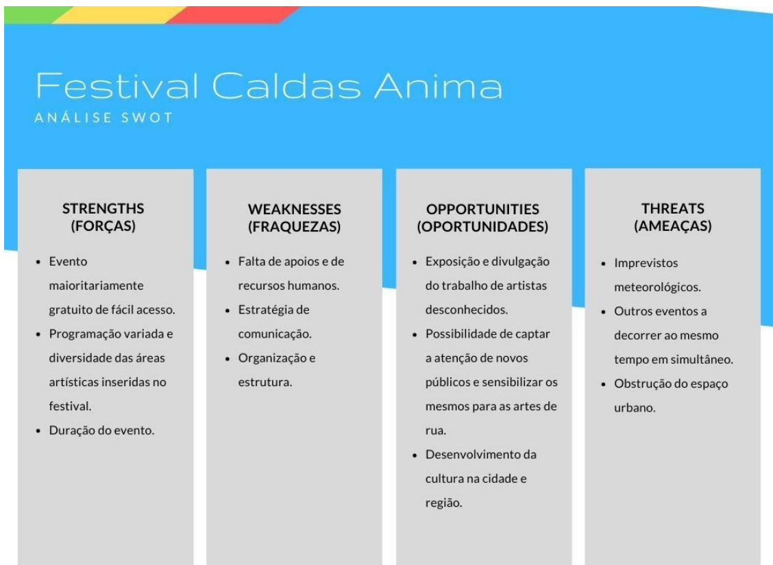
Figura 3: Análise SWOT