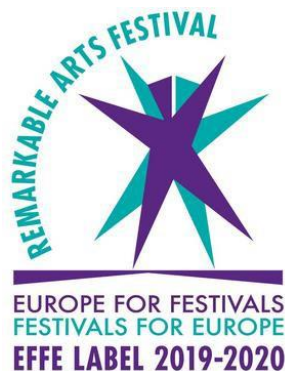
Figura 2: Selo de qualidade EFFE Label

Analisando os padrões de qualidade em relação ao Caldas Anima, pode-se afirmar que a programação do festival é coerente, de acordo com a análise do conjunto das edições. Para além de programador, o diretor do CCC também assume as funções de curador sendo ele o responsável pela seleção dos espetáculos apresentados durante o festival com o auxílio da restante equipa de produção. Os critérios de seleção passam por uma prévia pesquisa e estudo de mercado dos demais festivais análogos internacionais. Adaptados às características, estes espetáculos são avaliados segundo os parâmetros e objetivos do festival Caldas Anima, procurando espetáculos originais e diversificados indo de encontro aos gostos do público. Restantes critérios passam por questões orçamentais (Mota, 2021).