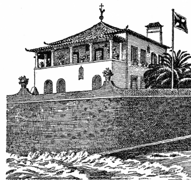
CASA DE S. PEDRO