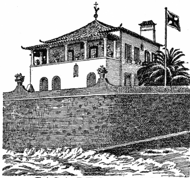
CASA DE S. PEDRO