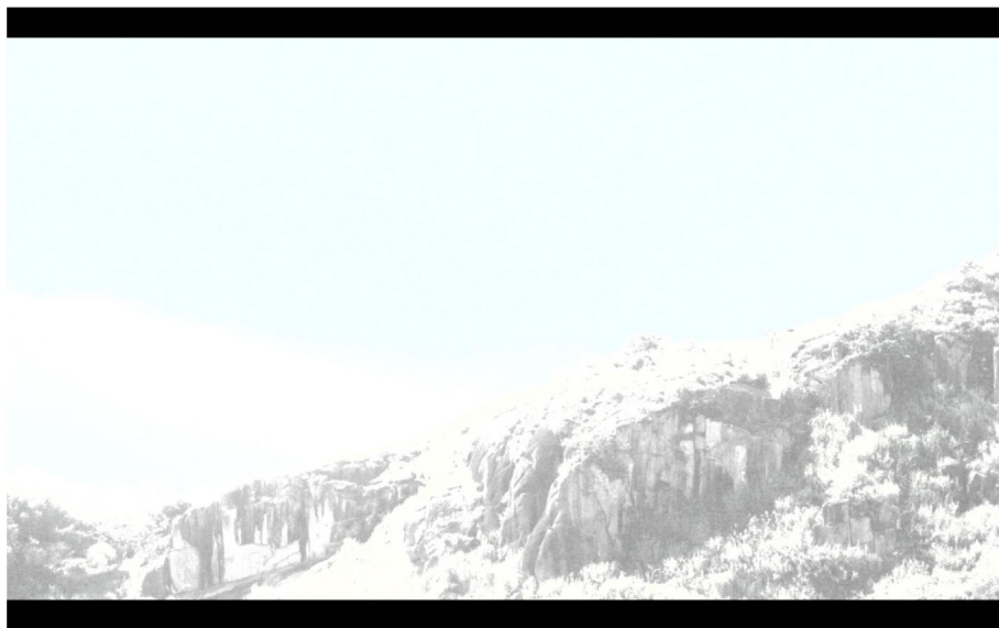
Terra sem sombra, 2012 (still do vídeo) – Fotografias sequenciadas em vídeo e narrativa ficcional. 3'03"

O filme Stalker , de Andrei Tarkovsky (1979), tornou-se uma referência importante no decorrer do desenvolvimento deste trabalho. Certas características físicas da fábrica e seu entorno fizeram-me recordar algumas cenas do filme russo, incitando-me a explorar algumas potencialidades da Zona – local enigmático no qual transcorre a trama dos personagens de Stalker . Tal referência orientou-me na elaboração da abordagem ficcional da fábrica-catedral como ponto de convergência improvável entre esperança e desesperança.