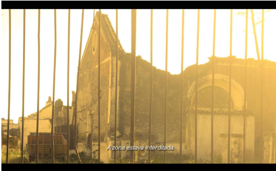
Pulso , 2012 – Projeção de vídeo. Duração 20'

parecia lentamente, dando lugar ao branco quase total. Essa espécie de morte que acontecia diante da minha retina acabou por revelar o que agora entendo como a potência do trabalho. Mais adiante, percebi também que esse apagamento da paisagem poderia ser lido como um processo que introduz uma componente ficcional à medida que as colinas e o céu desaparecem na imagem: o que era “tropical” e colorido na imagem foi se tornando frio, pois o branco que passa a revestir as montanhas alude a uma situação de neve.