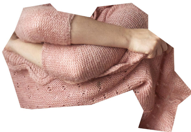
(des)encontro entre um corpo e um vestido, 2012

Os objetos que escolhi para trabalhar com a hipótese de os perder são objetos que potenciam um conjunto de possibilidades porque ambos são da esfera do privado. Talvez fosse necessário a ideia de possuir realmente os objetos para os eventualmente poder perder. A primeira perda resulta na performance-ação para a câmara fotográfica, intitulada (des)encontro entre um corpo e um vestido . Na ação, visto um vestido da minha infância motivada pelo desejo de voltar a sentir o corpo-criança. E foi o que fiz. Mas o desejo deu origem a uma urgente vontade de o despir, pois o vestido já não serve o corpo que o veste, o que só faz recordar a impossibilidade do corpo crescido hoje dentro do vestido. De não poder ser o corpo que se deseja. O que resulta da performance são os registos do desconforto que me desafiavam a dar existência a uma outra consciência de sentir corpo. Num total de cerca de oito registos, até despir integralmente o vestido.