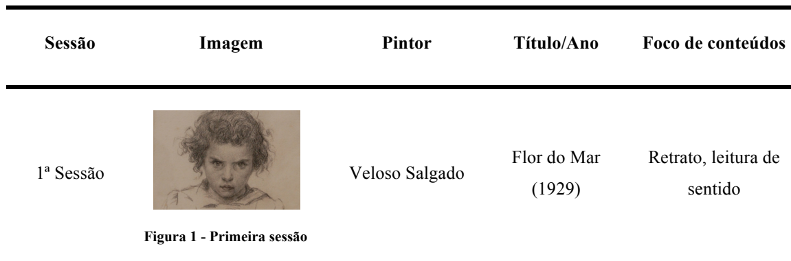
Tabela 4: Planificação da primeira sessão