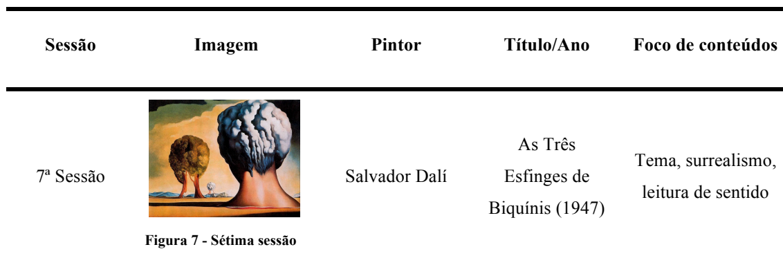
Figura 7 - Sétima sessão