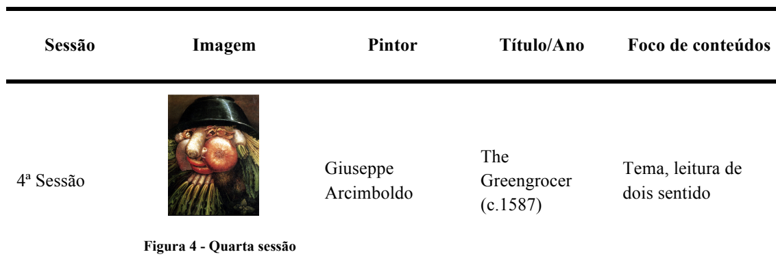
Tabela 10: Planificação da quarta sessão