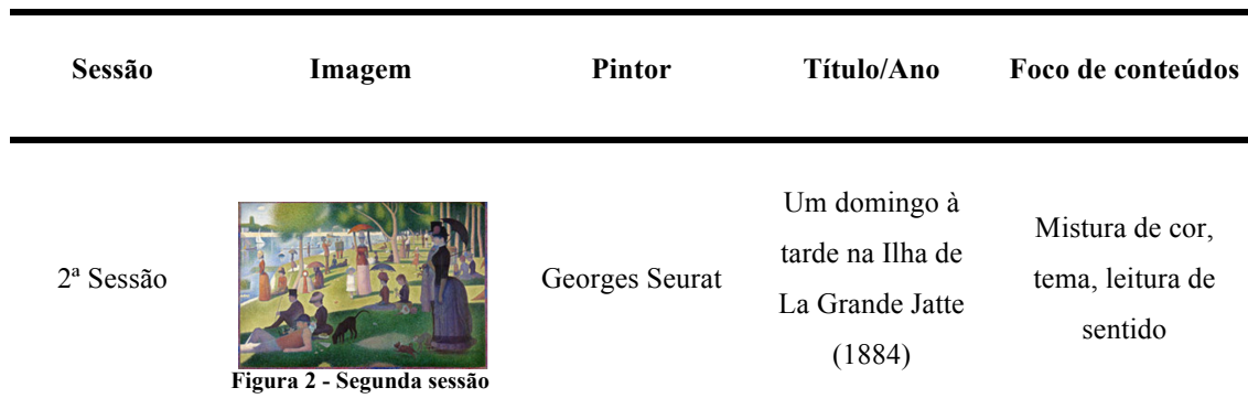
Tabela 6: Planificação da segunda sessão