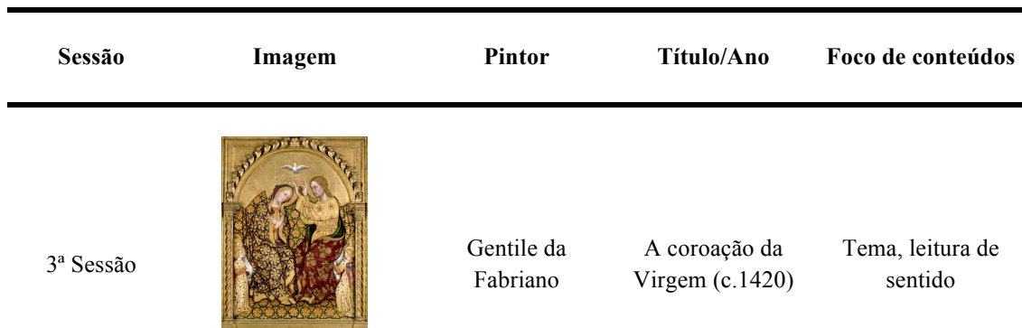
Figura 3 - Terceira sessão