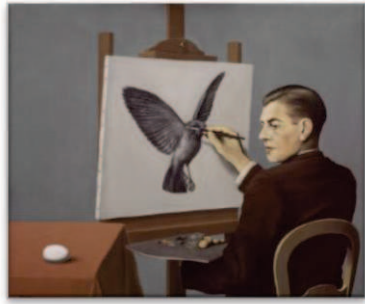
III – René Magritte, La Clairvoyance (Clairvoyance) , 1936.