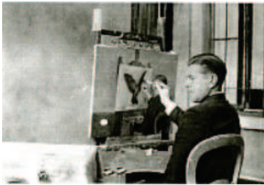
IV – René Magritte, René Magritte and La Clairvoyance (Clairvoyance) , 1936.

A partir do século XX é que a Fotografia e o Cinema surgem como uma invenção que não só acaba por modificar a relação que o homem tem com o real, como estimula a maneira como as artes são realizadas. Estes avanços do século XIX permitem assim novos meios de produção e a criação de novas maneiras de ver e entender a pintura. Ao revolucionar a representação do real, cada vez mais os artistas queriam ir mais além, numa constante procura da captação do real, onde já não bastava a simples captação da imagem.