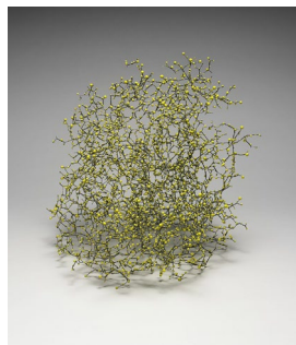
Tom Friedman, 2001, Guggenheim Museums