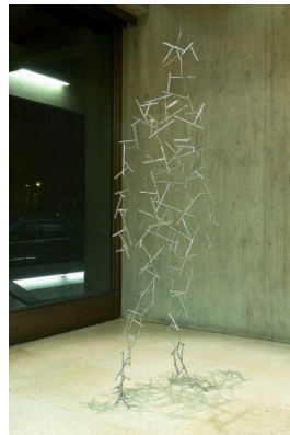
Antony Gormley 2004, Domain, F.C.G Lx