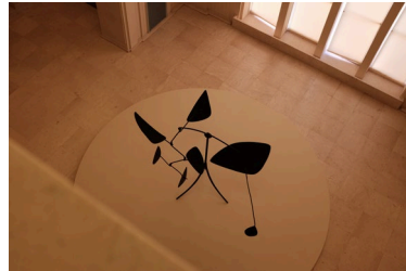
Alexander Calder, Mobile. Fonte: Wikimedia Commons