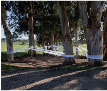
Fernanda Fragateiro, Desenho suspenso no tempo, 2011. Land Art Cascais.