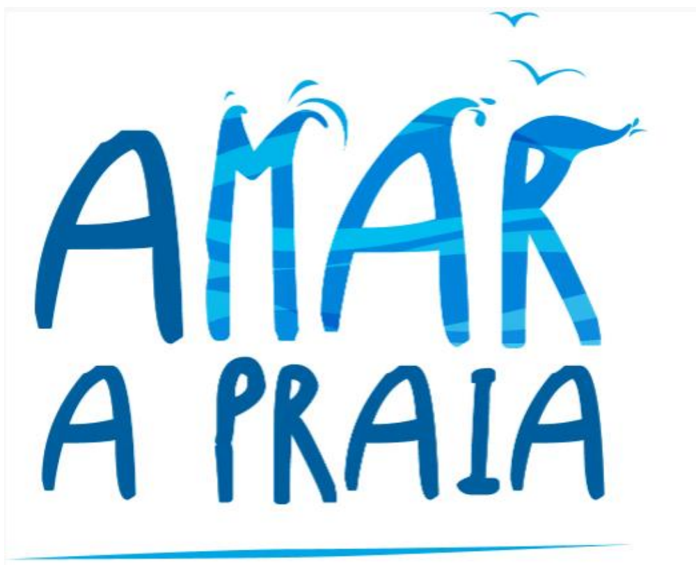
FIGURA 8 - AMAR A PRAIA - CONCURSO DE PRÁTICAS SUSTENTÁVEIS.

As boas práticas incluem áreas como a água, energia, educação e sensibilização ambiental, entre outras.