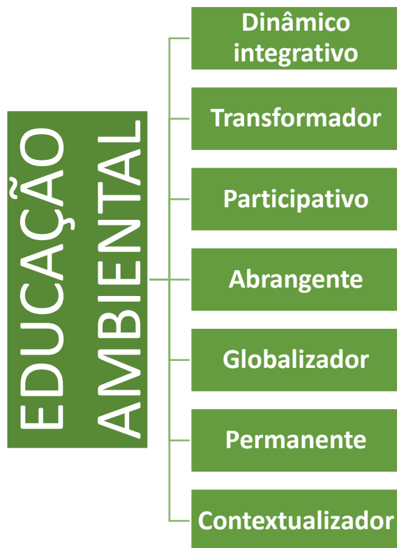
FIGURA 4 - CARACTERÍSTICAS DA EDUCAÇÃO AMBIENTAL.

De acordo com a Conferência de Tbilisi, ocorrida em 1977, na ex-União Soviética, Educação Ambiental tem como principais características ser: