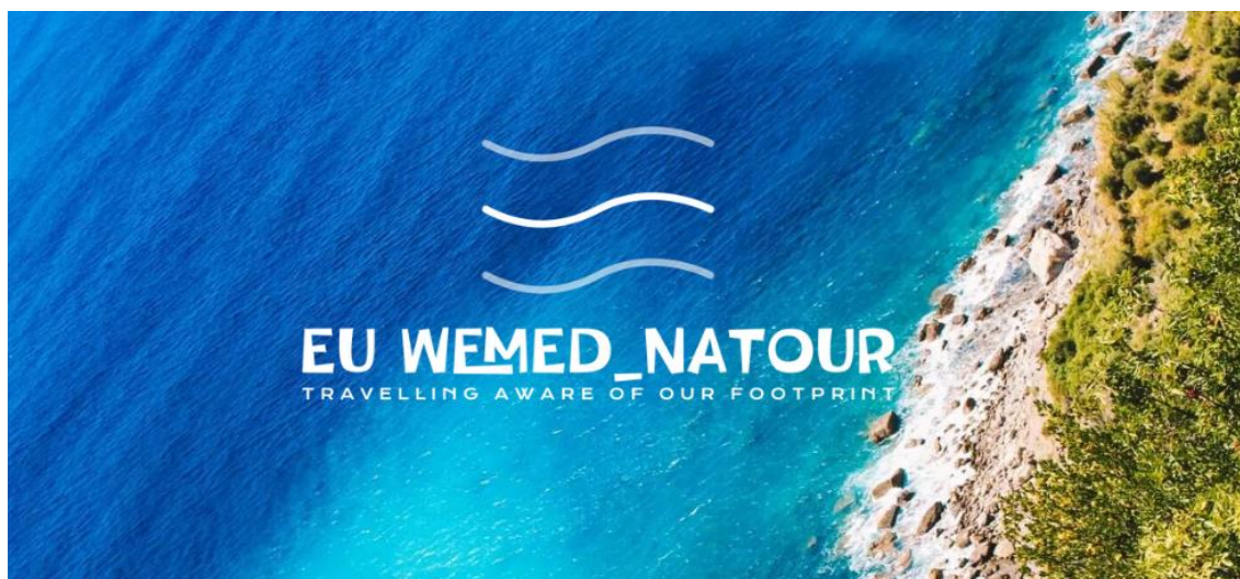
FIGURA 12 - PROJETO EUROPEU EU WEMED NATOUR.

Neste projeto a minha contribuição envolveu a presença em reuniões de coordenação do projeto com os parceiros internacionais, assim como na elaboração de pesquisas e sistematização de informação no âmbito das tarefas cometidas pelo projeto ao Turismo de Portugal, nomeadamente, o questionário criado e a análise do mesmo aos parceiros das entidades.