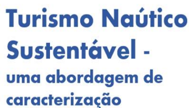
FIGURA 9 - TURISMO NÁUTICO SUSTENTÁVEL. FONTE DO AUTOR

Em seguida, foi elaborada uma breve descrição do Programa Praia Acessível, e a análise dos resultados dos anos de 2018, 2019, 2022 e do Total, destacando as praias costeiras e interiores, e os valores pelas regiões de Portugal. Também consta uma breve descrição da Bandeira Azul e assim como anteriormente foi feita uma análise dos resultados dos anos de 2018, 2019, 2022 e do Total de acordo com as diferentes regiões. Assim como foi igualmente elaborada uma breve descrição do N o de Agentes de Animação Turística: Atividades Marítimo-Turísticas e a análise dos mesmos nos anos de 2018, 2019, 2022 e do Total, assim como foram feitas considerações sobre os resultados obtidos.