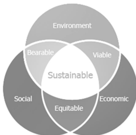
FIGURA 1 - DIMENSÕES DA SUSTENTABILIDADE E SUAS INTERSECÇÕES. ADAPTADO DE LOZANO (2008).

A relação entre sustentabilidade e turismo é particularmente interessante devido ao papel considerável do turismo na economia mundial.