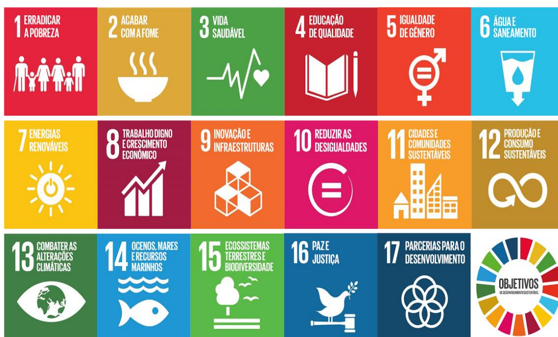
FIGURA 3 - 17 OBJETIVOS DE DESENVOLVIMENTO SUSTENTÁVEL (ODS).

O Turismo tem contribuído direta e indiretamente para todos os ODS, tendo sido incluído sobretudo nos Objetivos 8 (crescimento económico sustentável), 12 (consumo e produção sustentáveis) e 14 (uso sustentável dos oceanos e recursos marinhos) (BCSD Portugal 2023).