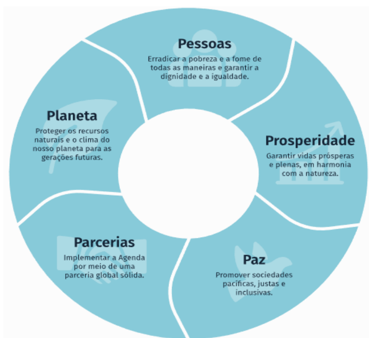
FIGURA 2 - ADAPTADO DO RELATÓRIO “ABC DOS OBJETIVOS DE DESENVOLVIMENTO SUSTENTÁVEL”.

“A Agenda 2030 para o Desenvolvimento Sustentável, adotada por todos os Estados-Membros das Nações Unidas em 2015, e que entrou oficialmente em vigor em 2016, define as prioridades e aspirações do desenvolvimento sustentável global para 2030 e procura mobilizar esforços globais à volta de um conjunto de objetivos e metas comuns” (17 Objetivos • ODS - BCSD Portugal, n.d.).