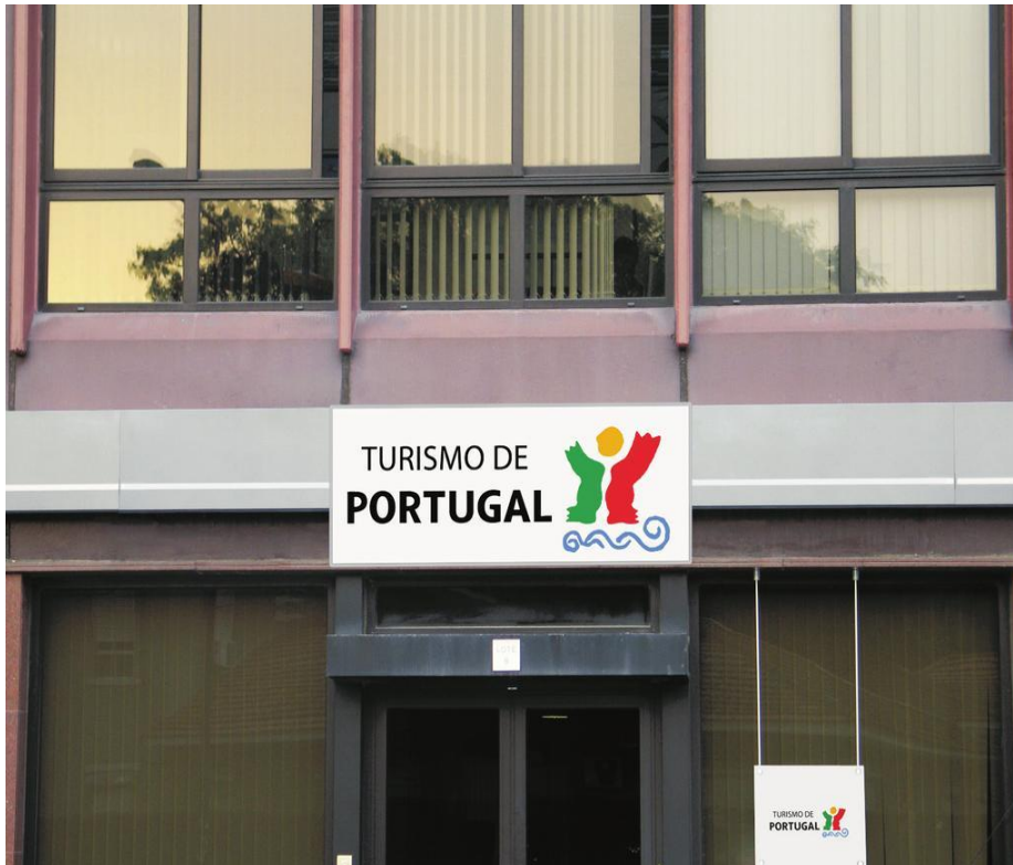
FIGURA 5 - SEDE DO TURISMO DE PORTUGAL.