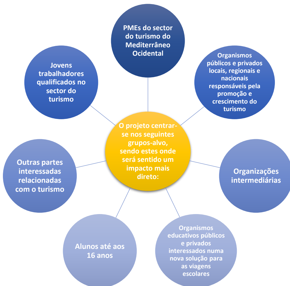
FIGURA 13 - GRUPOS-ALVO DO PROJETO EUROPEU EU WEDMED NATOUR. FIGURA ADAPTADA PELO AUTOR.

O projeto centrar-se nos seguintes grupos-alvo, sendo estes onde será sentido um impacto mais direto: