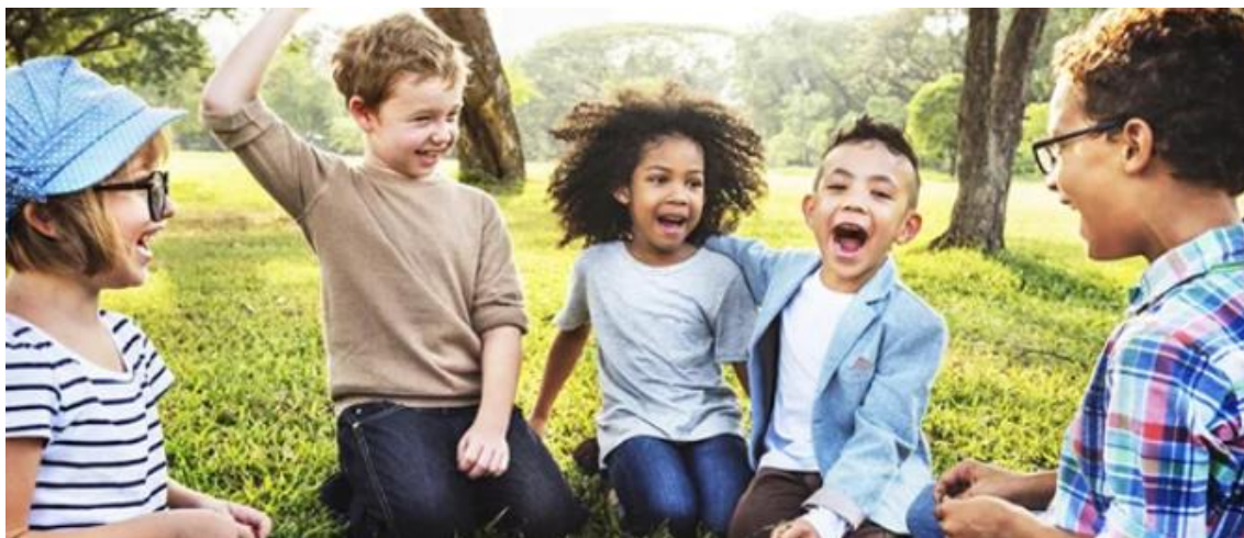
FIGURA 14 - EDUCAÇÃO AMBIENTAL PARA AS GERAÇÕES MAIS NOVAS.

Ou seja, o projeto tem o potencial para criar um impacto positivo significativo não apenas na região a que se destina, mas também de se tornar um projeto inspirador no que diz respeito à conservação e gestão sustentável em ecossistemas marinhos e costeiros no mundo.