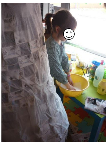
Fotografia 7 – Construção do Farol (forragem dos pacotes de leite com papel de cozinha)

Tínhamos de pensar qual dos dois tipos de papel era indicado para colocar na lanterna, papel celofane amarelo ou uma folha de cartolina amarela. Inicialmente as crianças mostraram-se indecisas, mas assim que a aluna estagiária colocou a lanterna ligada por trás de cada folha, elas depressa chegaram à conclusão de que tinha de ser o papel celofane porque deixava ver a luz da lanterna. Após este momento, atámos alguns fios à lanterna, de forma a prendê-la aos pacotes de leite da parte superior do farol de a manter segura dentro do farol. O passo seguinte foi a conclusão do farol, com a pintura das riscas vermelhas e brancas e a pintura da porta e das janelas castanhas (fotografia 8). Faltava ainda o telhado do Farol que foi representado com um cone em cartolina vermelha e que foi colocado no Farol.