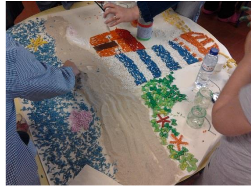
Fotografia 6 – Construção do painel