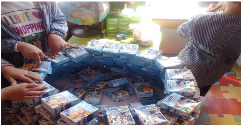
Fotografia 9 – Crianças a fazer a contagem dos pacotes de leite

Em relação ao domínio da Expressão Plástica, as crianças tiveram oportunidade de expressar as suas ideias sobre Faróis através de registos pictográficos (desenho e posterior registo do que a criança relatou), bem como manipular diferentes materiais (tintas guache, lápis de cor, lápis de cera, colas), essenciais para a construção de alguns trabalhos no âmbito deste projeto (painel com as massas alimentares, construção do Farol, cenários e adereços para a dramatização, entre outros) (ver anexo 5 – registo semanal da 5 a , 7 a , 9 a semana).