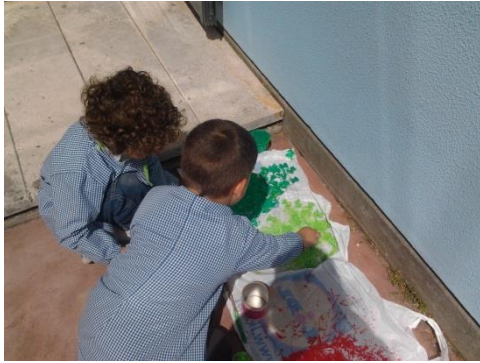
Fotografia 5 - Crianças a tratarem da secagem das massas alimentares