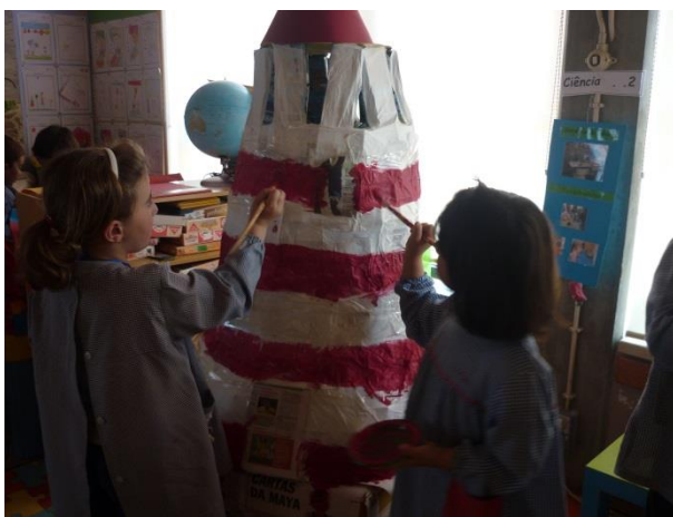
Fotografia 8 – Pintura do Farol