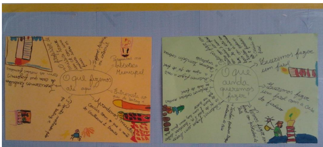
Fotografia 2 – Registos em cartolinas sobre “O que fizemos até aqui?” e “O que ainda queremos fazer?”

Ao realizar o registo com as crianças sobre “Que atividades ainda podemos fazer mais?” (Fotografia 2), as crianças manifestaram desejo em realizar uma dramatização, construir um Farol e a realizar um painel decorativo.