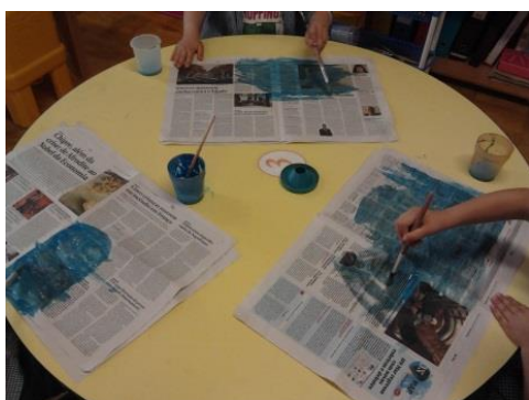
Fotografia 3 – Preparação dos chapéus de marinheiros com folhas de papel de jornal

No dia seguinte, logo após o acolhimento, escolhemos aleatoriamente um grupo de crianças, para realizar a dramatização. Enquanto o restante grupo, participava na aula de Expressão Musical, as crianças que iriam fazer a dramatização, preparavam-se com as alunas estagiárias, no espaço polivalente. Foi decidido pelo grupo que como nem todas as crianças tiveram oportunidade de participar na dramatização, as restantes ficariam com o papel de espetadores.