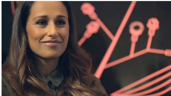
Figura 2 - Entrevista da Capazes com a atriz Rita Pereira 17

A terceira narrativa apresenta uma entrevista realizada pela Capazes com a atriz Rita Pereira, muito popular e polêmica, e também influencer com mais de 1 milhão de fãs no Facebook e Instagram. A entrevista consistiu em falar sobre a visão que a atriz tem sobre o feminismo.