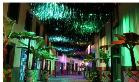
Maré Negra – Instalação Artística de sensibilização e consciencialização ambiental