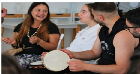
Oficinas de Música Terapia