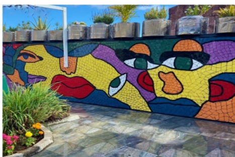
Mural da Liberdade - Comemoração dos 50 anos do 25 de Abril de 1974