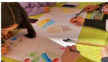
Oficinas de Arte Terapia