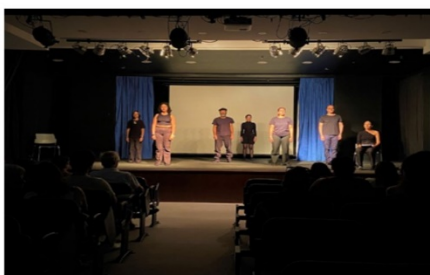
NOS, FRAGMENTOS DE UMA ILHA – Teatro