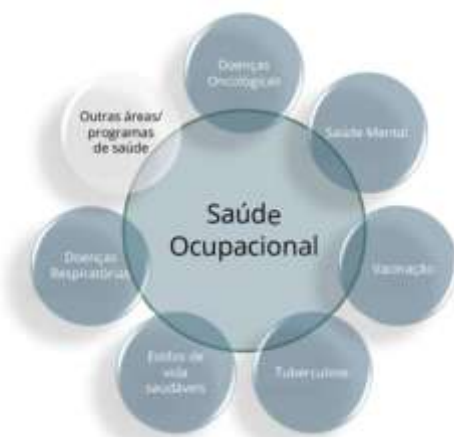
Figura 3. Intersecção da Saúde Ocupacional com diferentes áreas e programas de saúde