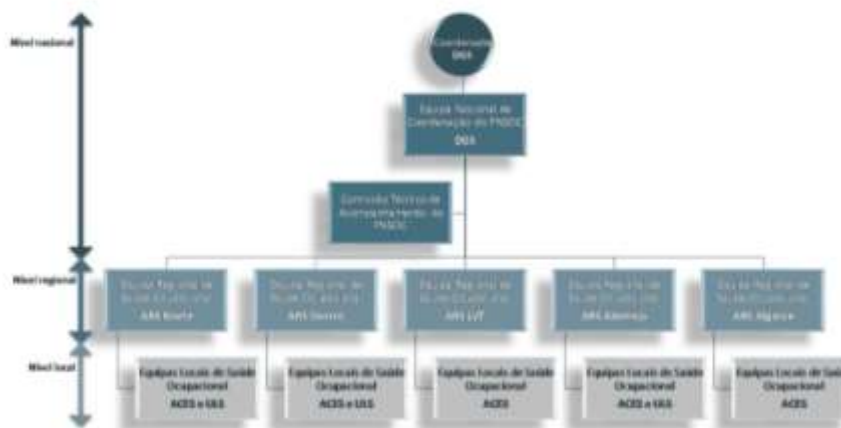
Figura 10. Organização conceptual a nível nacional, regional e local das Equipas e Comissão do PNSOC