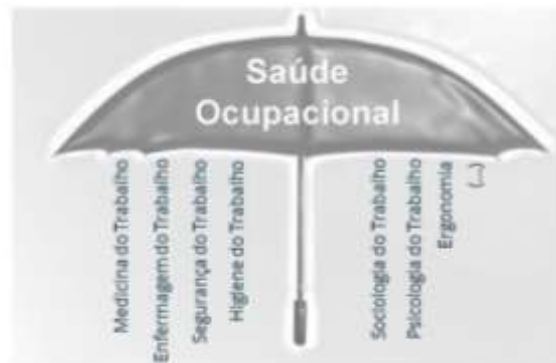
Figura 1. Multidisciplinaridade em Saúde Ocupacional

https://www.dgs.pt/pns-e-programas/programas-de-saude/saude-ocupacional.aspx