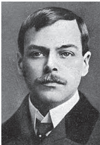
Afonso Lopes Vieira

Independentemente das ressonâncias atuais da temática tratada (o celibato e a constituição da família), o mais surpreendente parece ser a auto-consciência do monge, que procura um equilíbrio balanceado entre os seus desejos íntimos e o raciocínio pragmático ('vestir' e 'cuidar'), a que no soneto se alia o frio da natureza, como fator acutilante a fazer pender o braço da justiça para a aceitação da renúncia à vida familiar. Ou então o poder do lado espiritual e religioso, que faz parte integral da identidade de S. Francisco e que transforma estas 'lembranças' em não mais do que uma 'florinha', como o título colocou em destaque. Pelo menos momentaneamente, o cosmo vence as tensões do caos.