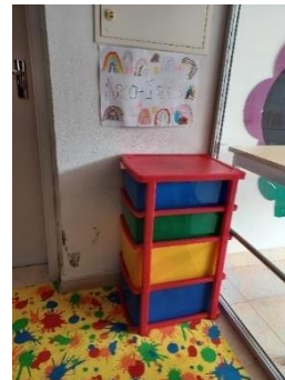
Figura 5- Área do Arco-iris

As quatro gavetas estavam organizadas, a primeira com tecidos (figura 6), a segunda com materiais naturais (figura 7), a terceira com plásticos (figura 8) e a última com papelão e madeiras (figura 9). Cada uma das gavetas tinha uma imagem do seu conteúdo, de modo a facilitar e auxiliar nos momentos de arrumação ou separação dos materiais.