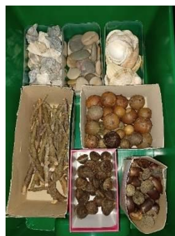
Figura 7- materiais naturais