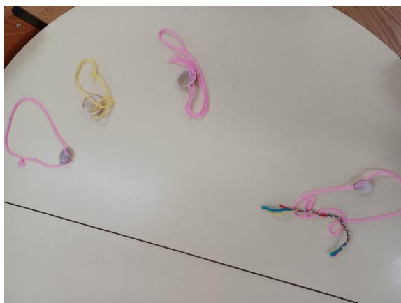
Figura 11- colares de conchas