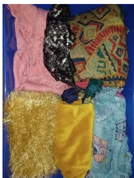
Figura 6- tecidos