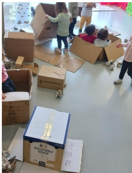
Figura 1- Exploração livre de caixas de papelão

Assim o educador tem um papel muito importante no que diz respeito à disponibilidade para apoiar, escutar e incentivar a criança. Nestas idades as experiências sensoriais também são muito importantes e cruciais na construção de determinadas aprendizagens, deste modo a exploração é fulcral, não só para o desenvolvimento dos sentidos, mas também como contributo para a sua criatividade e capacidade de dar sentido a algo. Percebi com o que experienciei que as atividades exploratórias são muito mais enriquecedoras para as crianças. Nesta prática pedagógica, implementei algumas atividades exploratórias, como a exploração livre com caixas de papelão, com folhas secas, com gelatina.