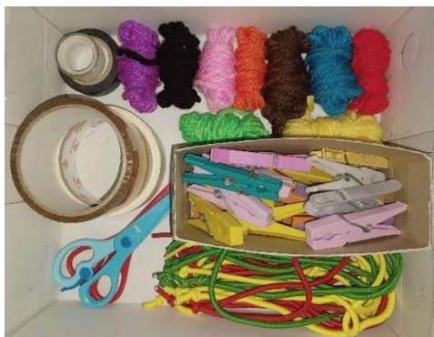
Figura 10- materiais acrescentados a pedido das crianças

roupa, lãs de várias cores, fita cola de diferentes tamanhos e cores, e por fim, tesouras de criança.