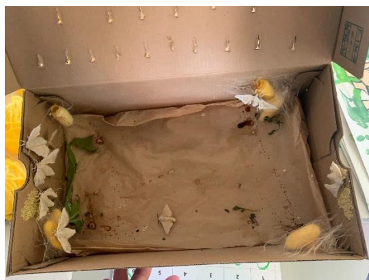
Figura 2- Bichos-da-seda

de o ter continuado a acompanhar. As crianças decidiram ficar com os ovinhos na sala e esperar pela primavera para as lagartinhas nascerem novamente.