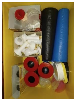
Figura 8- plásticos