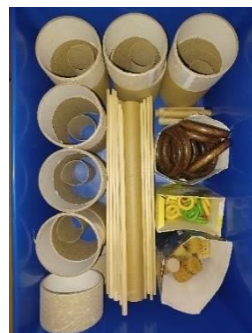
Figura 9- papelão e madeiras

No dia 5 de novembro, dia em que coloquei as gavetas na área logo pela manhã, assim que as crianças entraram na sala, questionaram “já podemos brincar na área do arco-íris?”, “é hoje que vamos brincar aí?”, “podemos brincar com as coisas todas?”. Foi-lhes apenas explicado que poderiam brincar na área da forma que quisessem, que iria estar um telemóvel a gravar no qual não deveriam mexer e que no final tinham as imagens para ajudar na arrumação dos materiais.