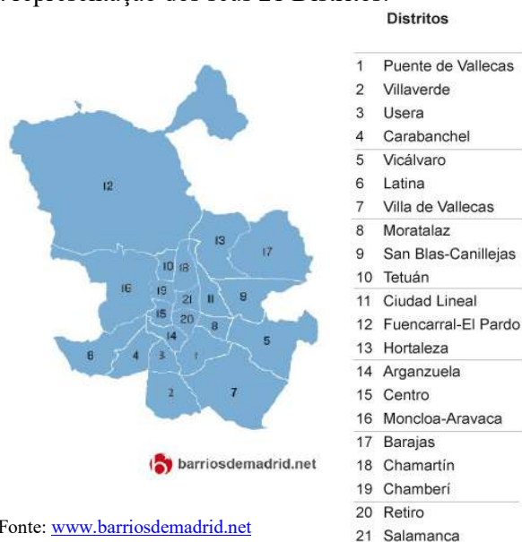
Figura 1: Madrid por Distritos

Madrid é a capital de Espanha, onde se situam a maioria das estruturas governamentais do país e onde está estabelecido o Rei. É também o centro da Comunidade de Madrid. A cidade em si é constituída por 21 Distritos, cada um com uma Junta Municipal 6 . Na figura abaixo podemos ver a estrutura geográfica da cidade, com a representação dos seus 21 Distritos.