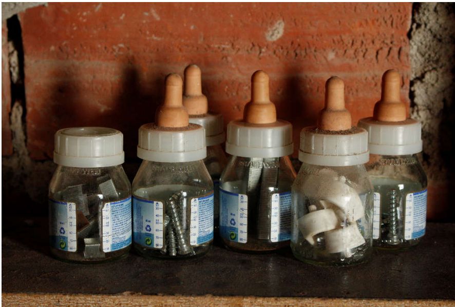
Figura 15. Aqui , 2015, página 63

recolhida uma imagem por dia ao longo do processo de construção do livro. Cada imagem (figura 15 e 16) recolhida sintetiza e representa um dia do quotidiano retratado.