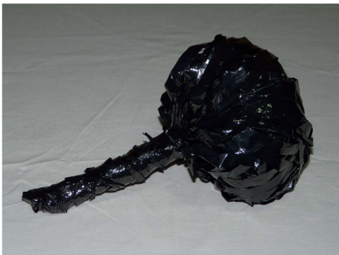
Figura 8. Exemplo de ideia pronta para ser explorada pelo David. Série Fitas , 2011.

Também nesta situação assumi a posição de espectador, porque apenas “podemos conhecer o seu mundo – mas não o podemos ter.”