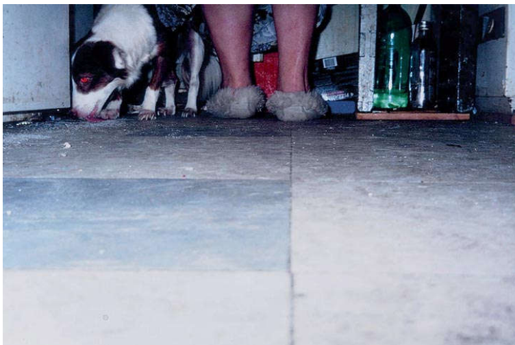
Figura 12. Richard Billingham, Untitled (RAL 36) , 1995, Fuji long-life colour print on aluminium, 105 x 158 cm

Dentro do leque destes trabalhos, surgiu primeiro um pequeno conjunto de fotografias isoladas figura (13 e 14), de tamanho 29x42cm, em impressão a laser, recolhidas em ambiente exterior, em contexto lúdico e que abordam a relação da família com a matéria plástica explorada pelo David. Este trabalho teve a sua continuidade em Sábado à tarde , um livro de fotografia, com 48 páginas, de capa mole e tamanho de 20x26cm, que revela como especificado