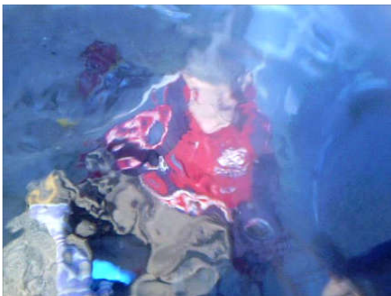
Figura 17. Retrato , vídeo, 2014

É um vídeo sem grandes regras, é uma pausa entre trabalhos, que se complementa na capa do cd do vídeo, também em formato de caderno tamanho A5, com o mesmo título. Este caderno-capa, é constituído por poemas e desenhos que sintetizam o quotidiano. As páginas não encontradas são as do vídeo, pois os restantes poemas são escritos em imagens. É um diário, uma forma de controlar os impulsos, as emoções, a ebulição quotidiana. É o fruto das inúmeras pausas necessárias à sanidade mental, escrevendo, desenhando, filmando, recuperando o controlo de uma realidade sempre fugidia. Nan Golding ao escrever acerca do seu trabalho The Ballad of Sexual Dependency (figura 15) refere que: