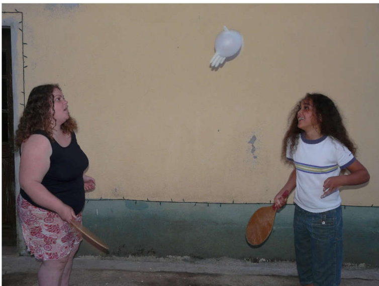
Figura 14. Sem título , 2011, fotografia em impressão a laser, 29x42cm

Para o vídeo David , foram recolhidas imagens também no exterior, em pequenos blocos, num contexto lúdico, não apenas com o David, mas também com a irmã. Durante esse trabalho de recolha de imagens fiz ao mesmo tempo o registo de forma verbal, acerca do que estava a pensar no momento da filmagem. Uma performance que deu lugar a um monólogo