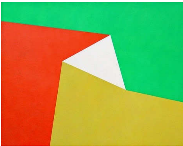
Figura 6. Exemplo de pintura relacionada com a economia de meios cromáticos. Ángelo de Sousa, Sem título . Acrílico sobre tela. 115 x 150 cm

aparatoso. Por outro lado, as incapacidades do equipamento levaram-me a investigar soluções para recolher a imagem pretendida. Os obstáculos de um meio tão rudimentar levaram a um lado mais experimental dentro do processo de trabalho. (Figura 7). Os defeitos na captação de som e imagem, as dificuldades que o meio introduziu, a fraca qualidade de imagem permitiram criar uma espécie de paralelismo entre a condição física do modelo principal e o próprio trabalho, a imperfeição da condição humana e a imperfeição da imagem. O erro e o defeito inestético ficaram patentes no trabalho como forma de interpolação no observador. Tal como o quotidiano não corresponde a padrões de perfeição, também o seu retrato é portador de imperfeições.