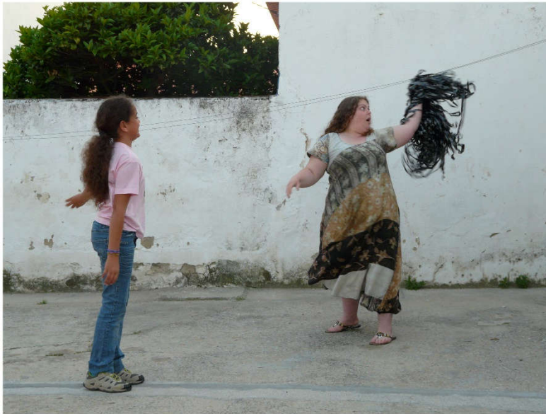
Figura 13. Sem título , 2011, fotografia em impressão a laser, 29x42cm

no título, um sábado à tarde em contexto familiar. Seguindo esta metodologia de trabalho, surgiram vídeos como David , Caderno Mágico ou Aqui?