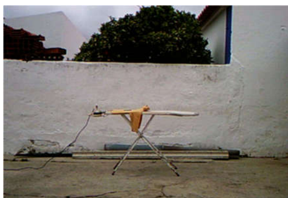
Figura 3. Sábado à tarde , página 5, 2012.

Neste registo do quotidiano surgem alguns objetos que ganham a característica de objetos-símbolo uma vez que eles próprios ajudam a fazer uma leitura do próprio trabalho. São objetos quotidianos, que o observador facilmente identifica como símbolos de alguma coisa no seu próprio mundo, por serem isso mesmo, objetos quotidianos. Esta afinidade entre mundos tem o seu interesse para o trabalho na medida em que poderá permitir um elo de ligação entre o observador e o trabalho (Figura 3 e 4).