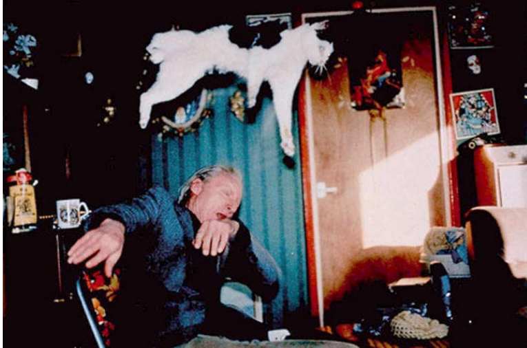
Figura 11. Richard Billingham, Untitled (RAL 28) , 1994, Fuji long-life colour print on aluminium, 105 x 158 cm

trabalho de Richard Billingham (figura 11 e 12) É como assistir a um espetáculo em que os atores são personagens da vida real e a história não é meramente ficcional, é o contacto com a coisa real , através da imagem.