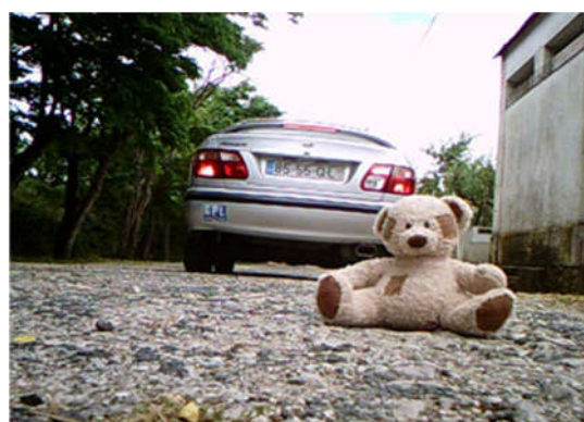
Figura 4. Boca do Coração , vídeo, 2012

Exemplos de objetos quotidianos: na figura 3, uma tábua de passar a roupa a ferro, símbolo do universo doméstico, na figura 4, um ursinho de peluche, símbolo da infância.