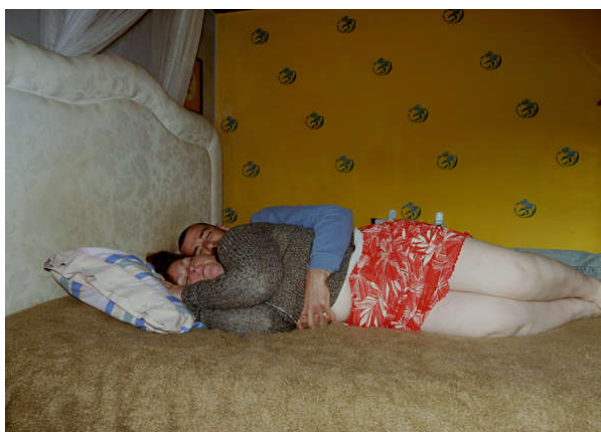
Figura 16. Equação do Amor , 2012, página 27, variação do quadro Ib e seu marido , Lucien Freud, Retratos, 1992

Neste pequeno livro de fotografia, de capa mole, 32 páginas e apenas 15x21,5cm, recolhi imagens quotidianas em vários contextos e ambientes: praia, jardim, quintal e interior da casa. São imagens de um casal 24 que recriam uma série de quadros de vários pintores, de finais do século XIX e século XX, nomeadamente Edouard Manet, Edvard Munch, Gustave Caillebote, Henri Toulouse-Lautrec, Edward Hopper e Lucien Freud. Construído em forma de narrativa pessoal, é uma incursão ao quotidiano da relação amorosa (figura 16) entre um homem portador de deficiência e uma mulher gorda portadora de problemática psiquiátrica.