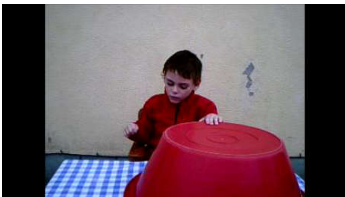
Figura 7. Exemplo de solução para fazer face à impossibilidade da câmara de filmar não conseguir captar imagens no interior da casa, na divisão pretendida por fracas condições de luz. A recolha de imagens foi feita em ambiente exterior, onde foi recriado o ambiente interior da divisão da casa pretendida através do transporte da mesa, ativando uma economia de meios e