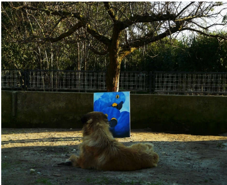
Figura 1. Exemplo de um animal doméstico no contexto de trabalho. Sábado à tarde , página 12, 2012.

Outros elementos que também se encontram lugar no trabalho são os animais pois fazem parte do meio familiar e do quotidiano em questão (Figura 1).