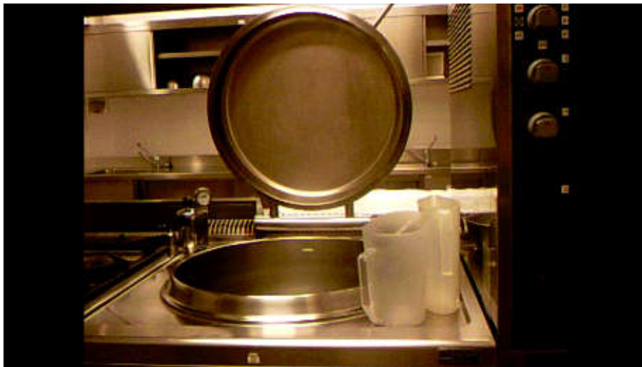
Figura 9. Nesta imagem recolhida em ambiente de trabalho, as colegas não quiseram que a sua imagem fosse captada. Foi necessário encontrar uma solução que respeitasse os seus direitos de imagem. Caderno Mágico , vídeo, 2014.

privado continuará sempre a existir, uma vez que como autora desses registos e dessa documentalidade de situações eu continuo sempre a ter o poder de decisão sobre aquilo que quero dar a mostrar e sobre a forma como o quero fazer, mantendo na privacidade do sombrio interior do lar, aquilo que considero que lá deva ficar. É uma condição moral patente no trabalho, há limites que escolhi não transpor, procurando sempre onde é que está a barreira desse limite que se encontra no respeito pelos direitos dos modelos intervenientes no trabalho (figuras 9 e 10).