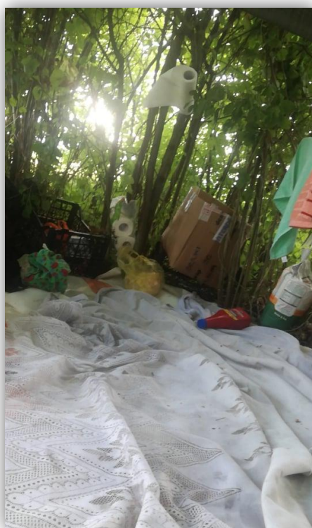
Figura 1- Travessia pela floresta na fronteira da Bih e Croácia

Atualmente estima-se que cerca de 7500 – 8000 pessoas estejam registradas nos campos de acolhimento temporário que, segundo o ACNUR e a OIM, apenas têm capacidade para 4145 pessoas, sendo que quase 5000 se fixam no Norte do país, mais propriamente em Bihać, na fronteira com a Croácia. Nos últimos meses de 2019 verificou-se um aumento do número de pessoas na cidade de Tuzla, embora nessa cidade ainda não exista nenhum centro de acolhimento de migrantes, sobrevivendo estes nas chamadas squats compostas por casas abandonadas, traseiras de estações de comboio ou autocarros.